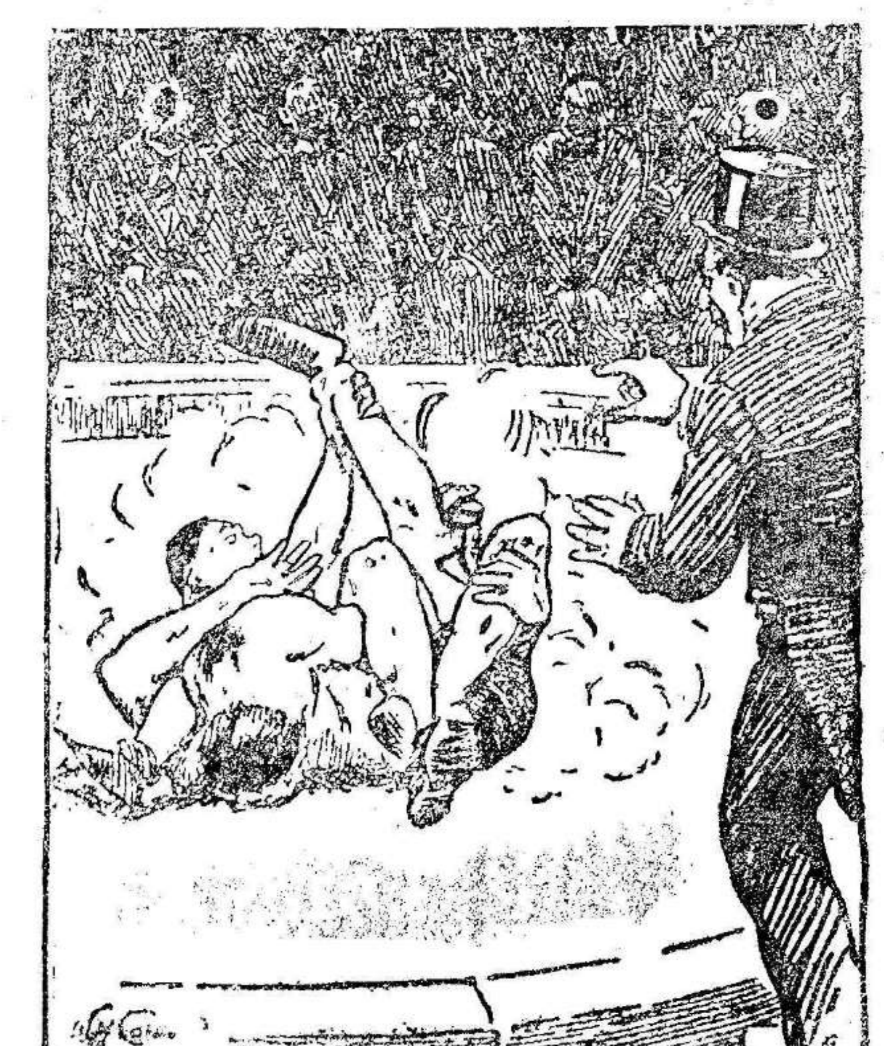
EL «MANAGER».—¡Pero, hombre, que se está usted rompiendo su propia pierna!