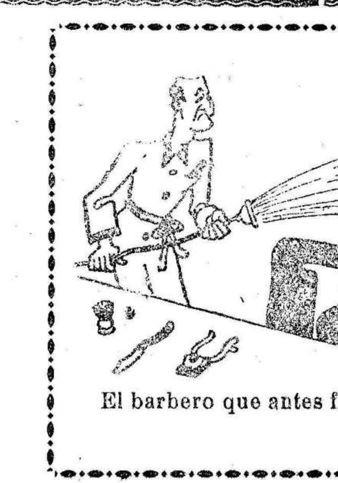
El barbero que antes fué bombero.

El gobernador civil señor García Franco, que después de la visita realizada el viernes al aeródromo