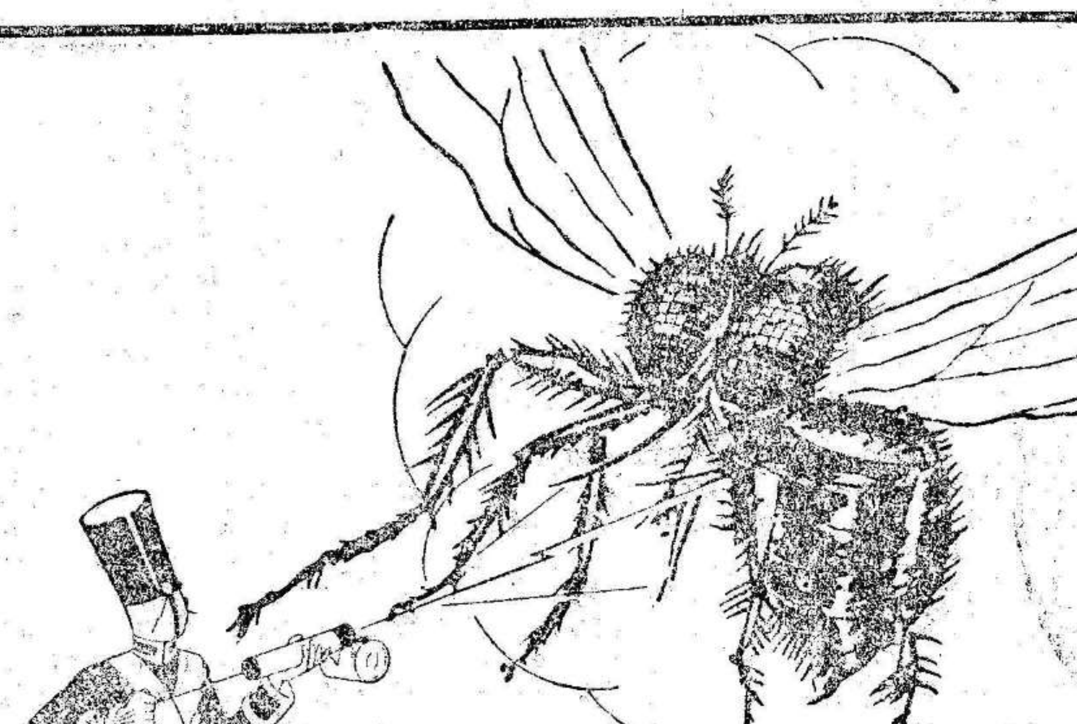
El enemigo mortal de los pequeños!

1 de cada 4 de los niños que mueren antes de los 5 años es víctima de la diarrea infantil. El principal propagador de esta enfermedad no es otro que la mosca común. Destruíd las moscas y salvad la vida de vuestros queridos bebés. Vaporizad Flit. Flit extermina moscas, mosquitos, pulgas, polillas, hormigas, escarabajos, chinches... y sus crías. No es peligroso. No mancha. No confunda Flit con los otros insecticidas. Bidón amarillo-franja negra. No se vende a granel. Exija los envases precintados.