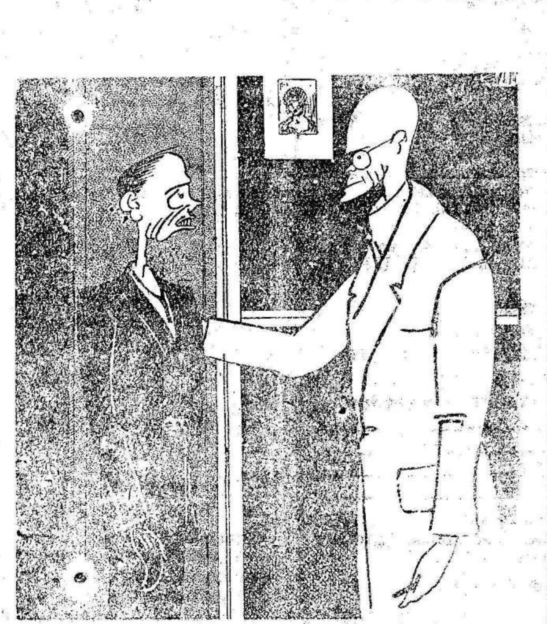
—Su padre, ¿no era tuberculoso? —No, señor, era fabricante de gaseosas.

El coche se dirigía a Cercedilla, siendo los heridos trasladados al pueblo próximo donde se les asistió.