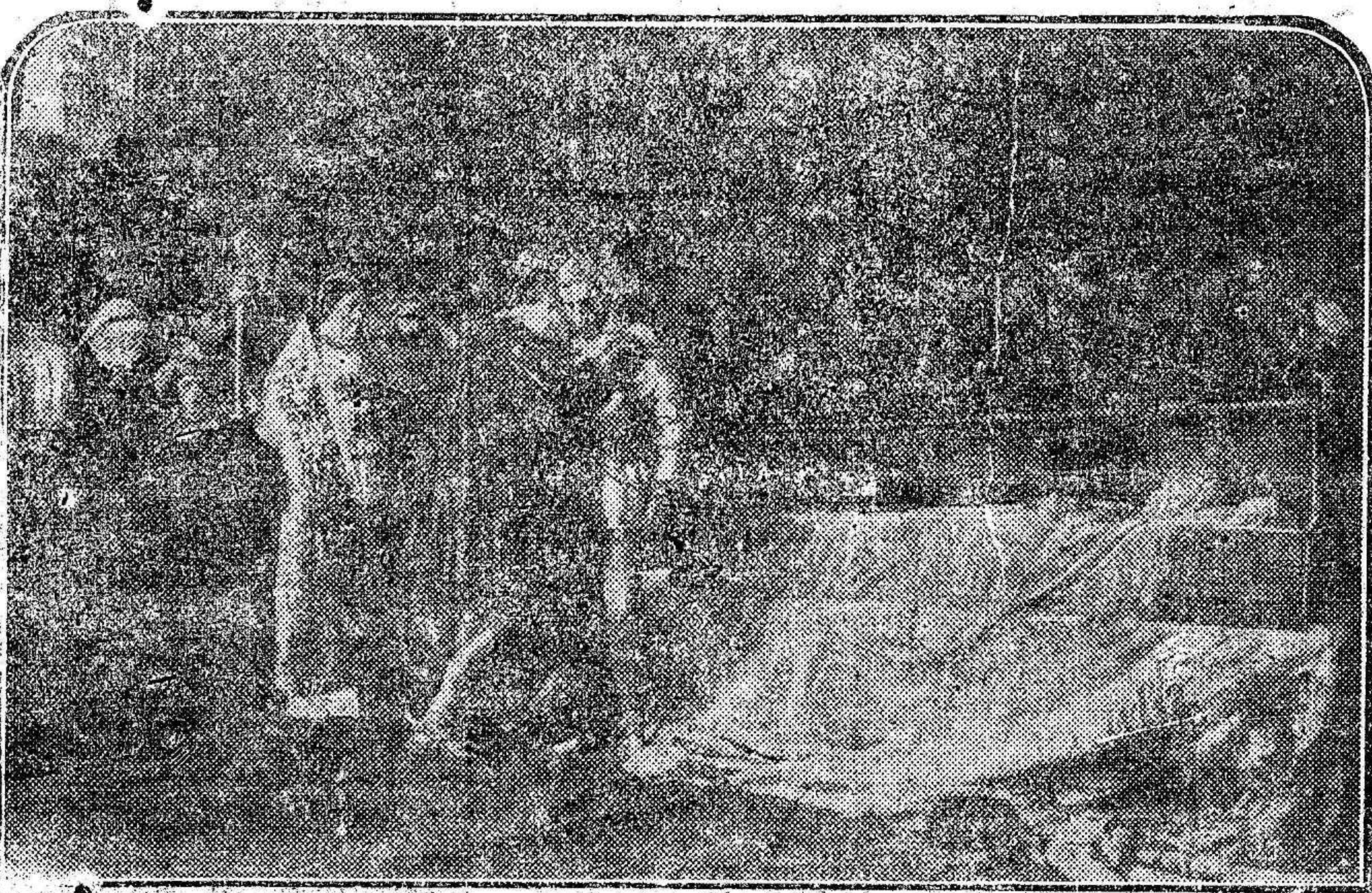
El cuadro de Moreno Carbonero «La conversión del duque de Gandía», inspirado en los famosos versos del duque de Rivas: «No más abrasarse el alma—en sol que apagar-se puede—No más servir a señores—qué en gusanos se convierten.»