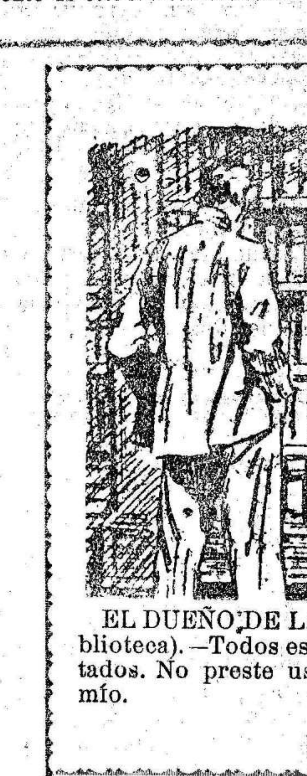
EL DUEÑO DE LA CASA (mostrando su biblioteca).—Todos estos libros me han sido prestados. No preste usted jamás un libro amigo mío.

Como consecuencia de las obras realizadas recientemente en esta Casa Consistorial, esa documentación sufrió varios traslados sin haber pasado por el Archivo, y actualmente se encuentra en un departamento de este mismo edificio.