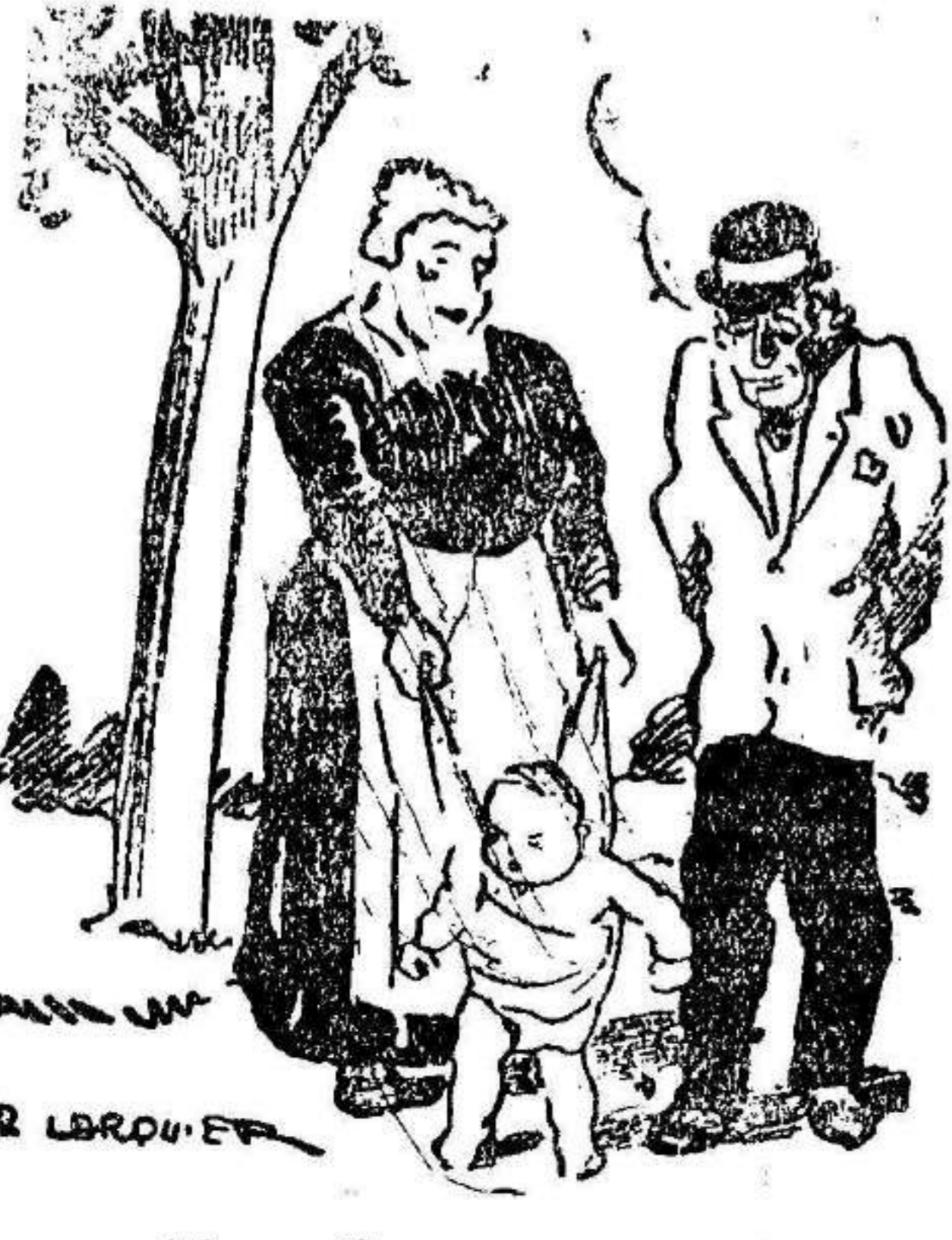
—¿Hace tiempo que anda este niño? —Unos ocho meses. —¿Caray! Deb; estar ya muy cansado...