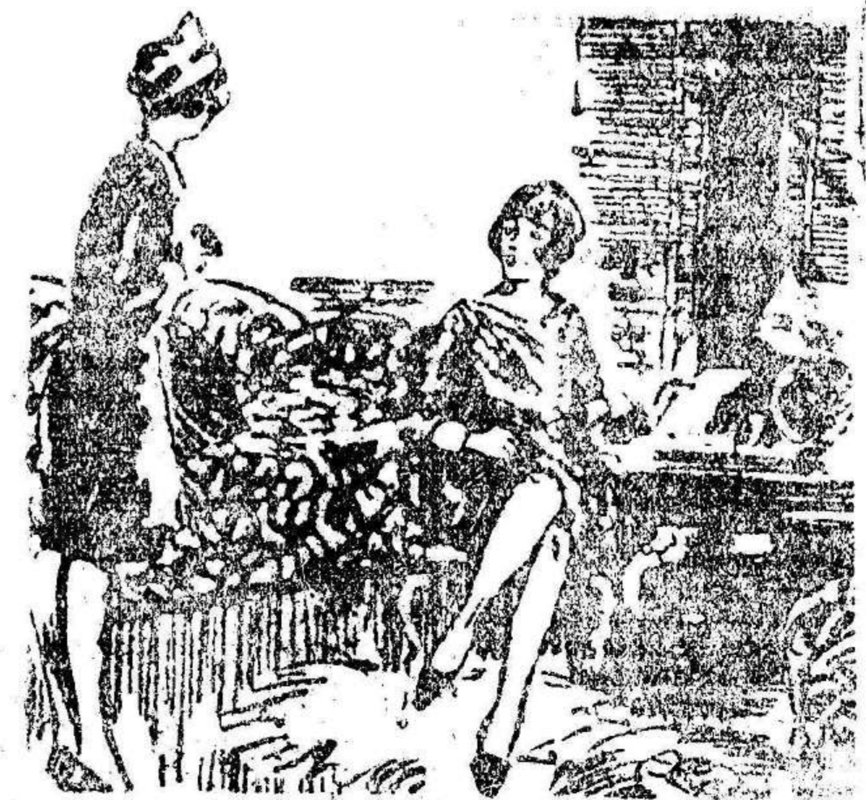
—Señorita, la cocinera enferma me encarga que le diga que ya no se marcha. —¿Y eso? —Porque el médico le ha ordenado un mes de reposo absoluto.