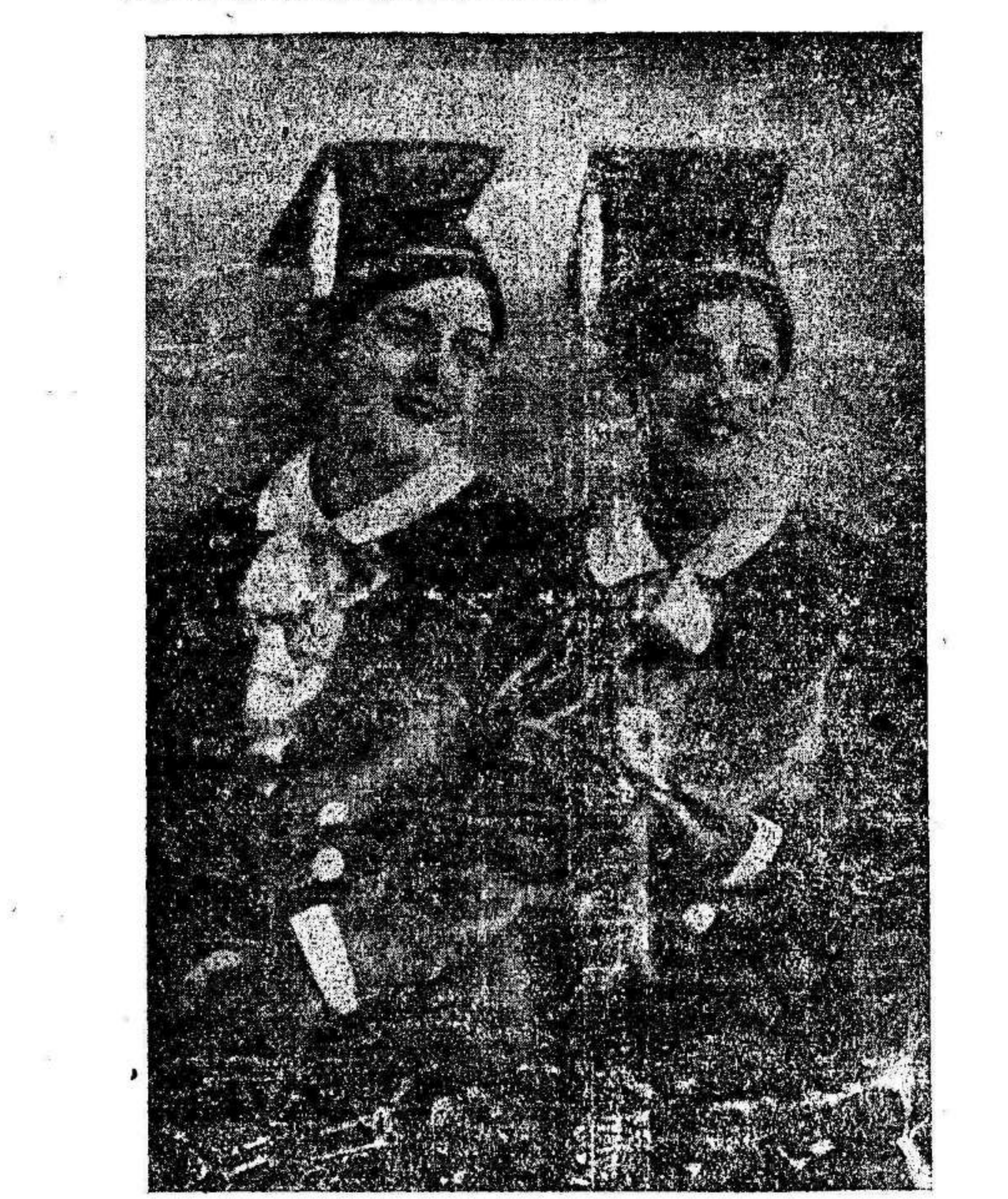
PYL Y MYL notables bailarinas que después de una brillante actuación se despiden hoy del público del Ortiz.