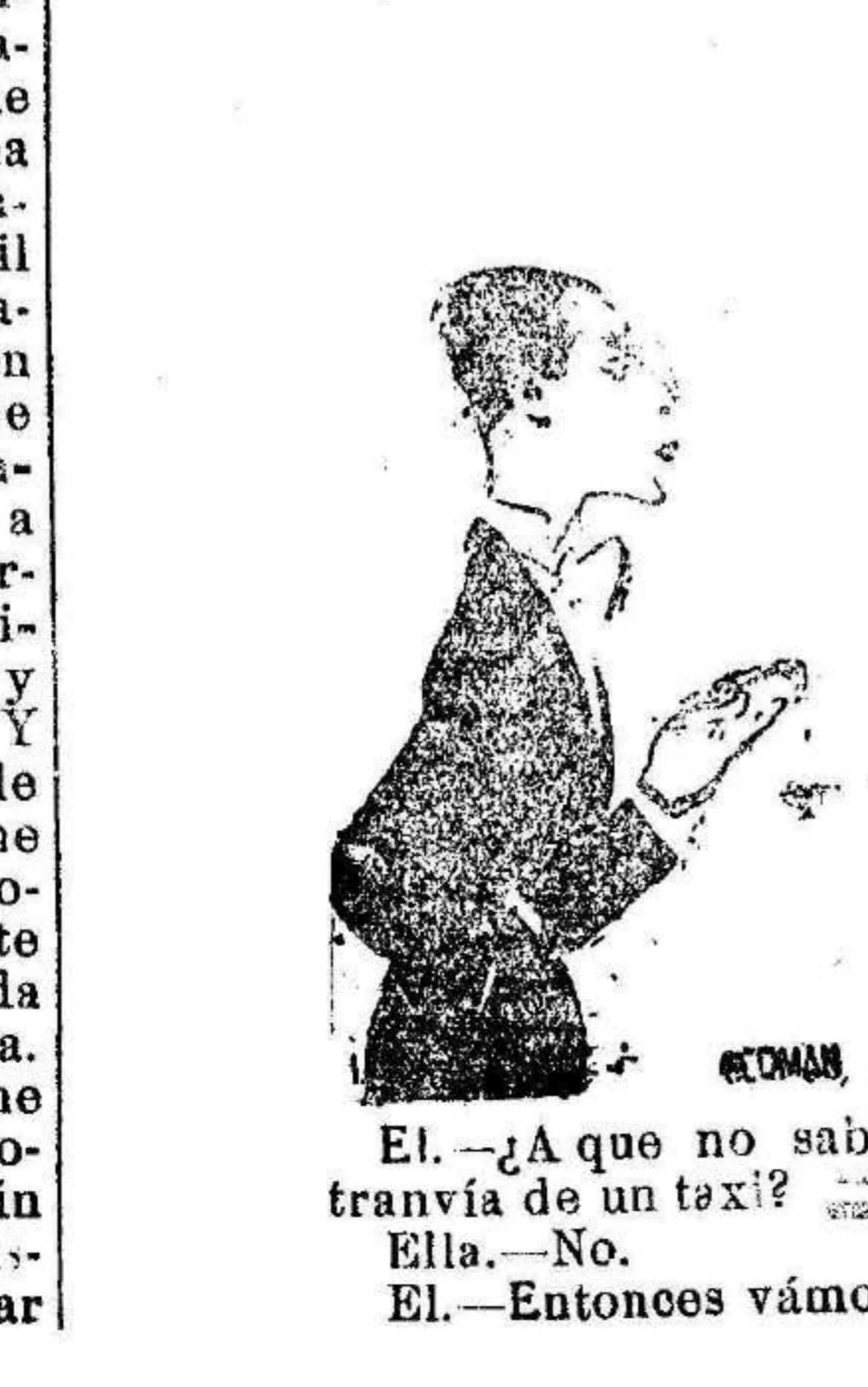
El.—¿A que no sabes en qué se diferencia un tranvía de un taxi? Ella.—No. El.—Entonces vámonos en tranvía.

La temperatura. 19, a las 11 n. Zaragoza.—Se está dejando sentir un frío intensísimo como nunca se ha conocido en esta ciudad. Los termómetros han marcado durante el día de ayer siete grados y ocho décimas bajo cero. Las orillas de los ríos se han helado. Las heladas han paralizado los trabajos agrícolas. El ministro de justicia. Zaragoza.—Se encuentra en esta población el ministro de Justicia y culto. Esta mañana visitó el Pilar en una de cuyas capillas se encuentran los restos de sus padres.