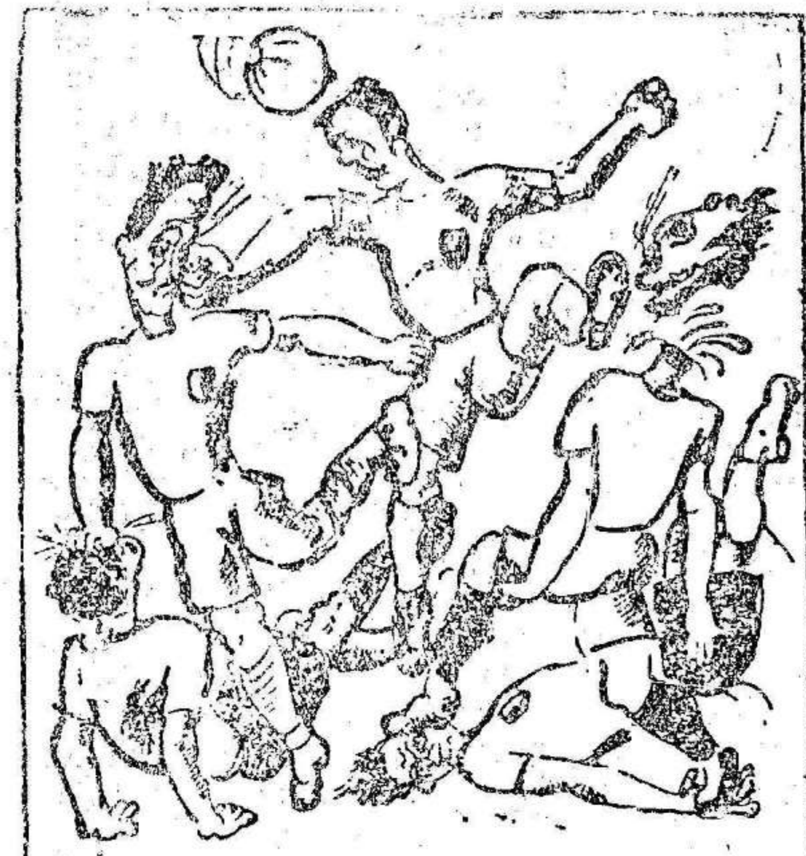
Al final el juego se hizo más interesante.

Apenas he salido de Rusia y he puesto el pie en la primera ciudad alemana, he tenido una clara sensación de alivio; he sentido que se me ensanchaban los pulmones y que respiraba otra vez con plena libertad. La dictadura del proletariado se me representa ahora como un estado patológico; como una obsesión o una pesadilla. No quiero escamotear esta sensación física que refleja exactamente la reacción del espíritu burgués frente a la opresión proletaria. Pero no quiero tampoco dejarme arrastrar por esta impresión puramente subjetiva de pequeño burgués o intelectual que se siente excluido o, mejor dicho, perseguido por la clase social dominante hoy en Rusia. El régimen bolchevique no deja lugar a dudas sobre su naturaleza, finalidad y procedimientos. El bur-