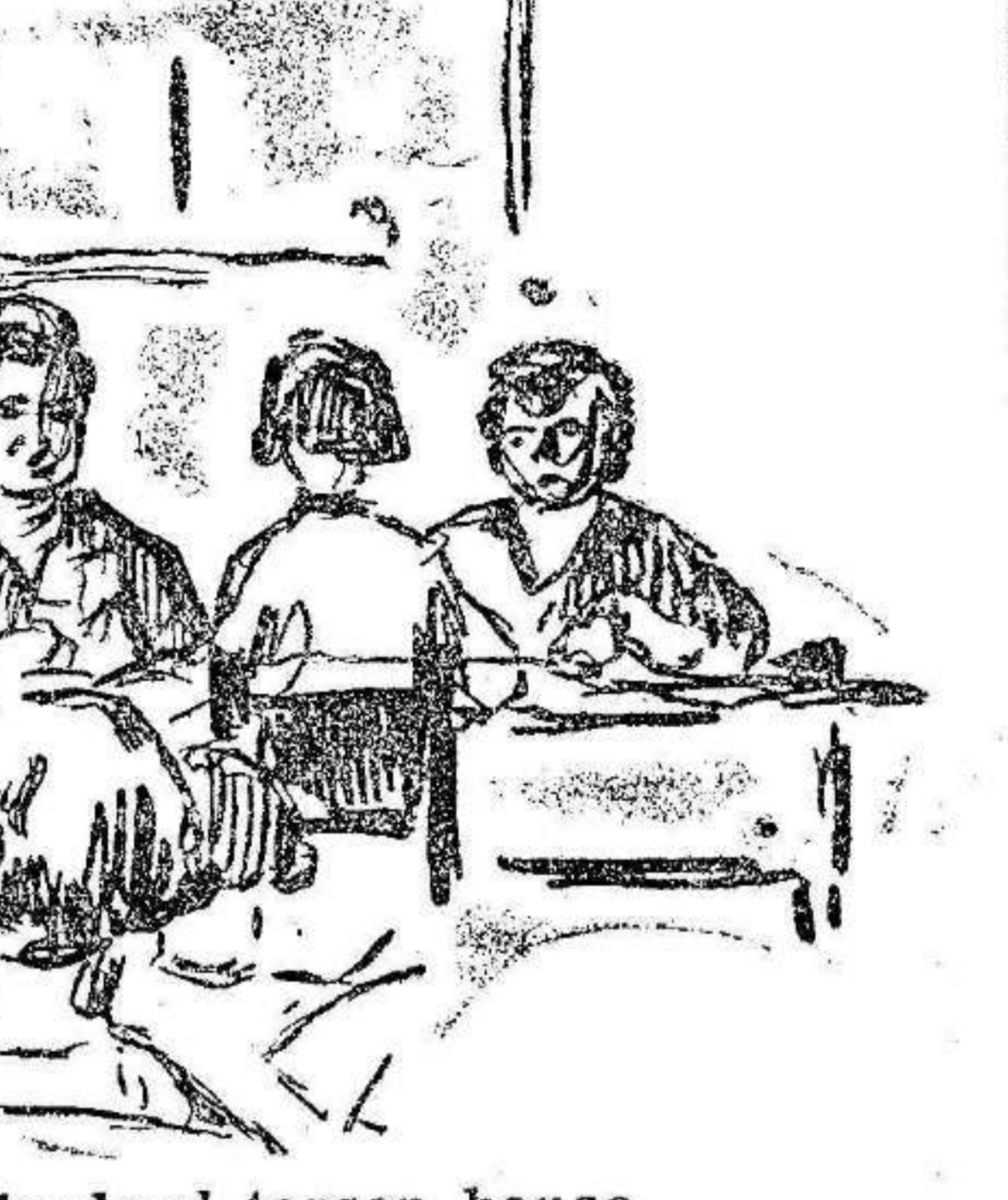
Un exámen visto desde el tercer banco

Valladolid.— Cumpliendo órdenes del alcalde la guardia municipal de Velliza intentó detener a cuatro mozos, pero el boticario soliviantó al vecindario, impidiendo que las detenciones se hiciesen efectivas.