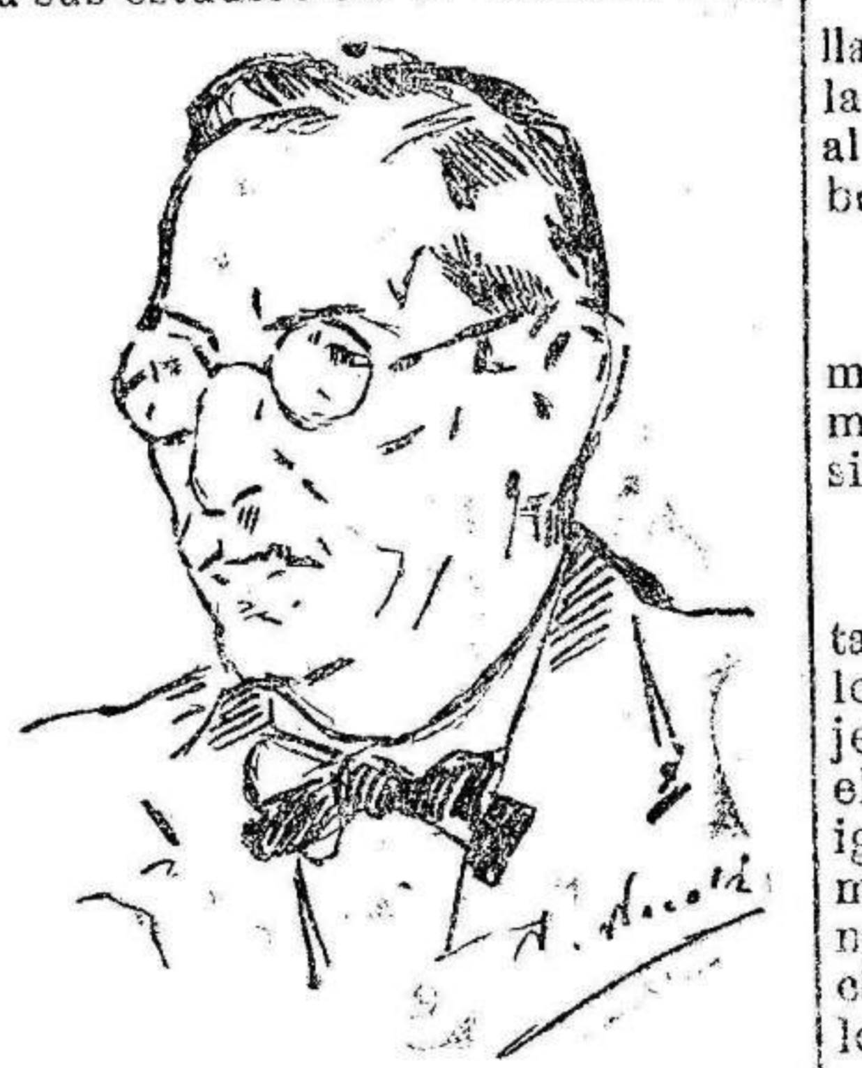
El profesor de Dibujo

En concepto de las alumnas, las profesoras se muestran algo rigurosas en los exámenes. Estas, por su parte, justifican la necesidad de no ser extremadamente benévolas.