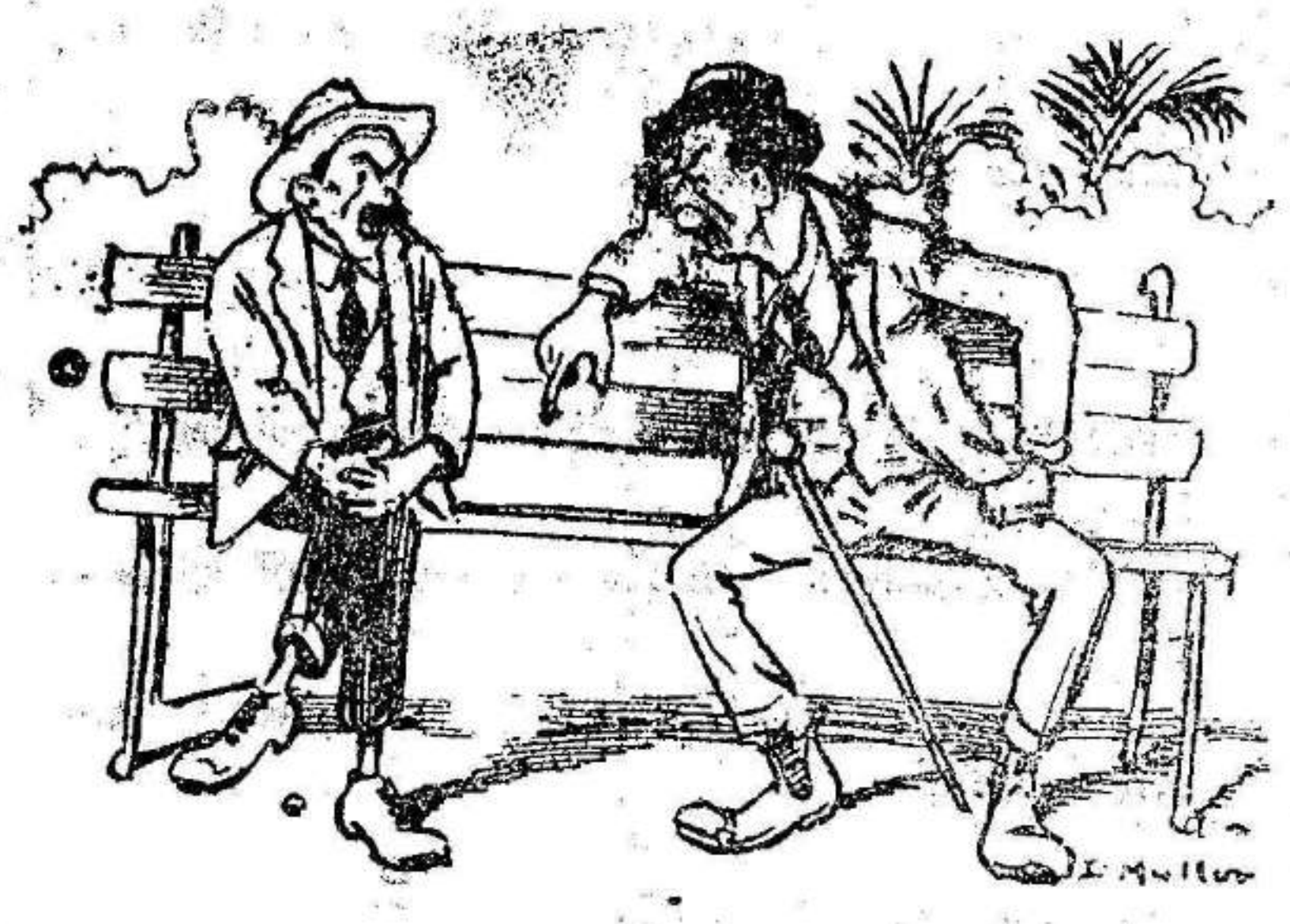
—¡Usted no sabe lo que es comer queso manchego! ¡Si usted probara el manchego legítimo que he comido yo en Cuba, hecho en aquel país!

No ha defraudado, ciertamente, el concierto del domingo, la curiosidad que había despertado el anterior, antes bien ha ido en aumento, como lo demostró la gran afluencia de público que llenó todas las localidades del teatro y escuchó, se emocionó y aplaudió con intensidad. A tres nacionalidades pertenecen los músicos del concierto. Tres rusos (Maussorgsky, Rimsky-Korsakoff y Tschalkowsky); dos franceses (Debussy y Ravet) y un alemán (Wagner).