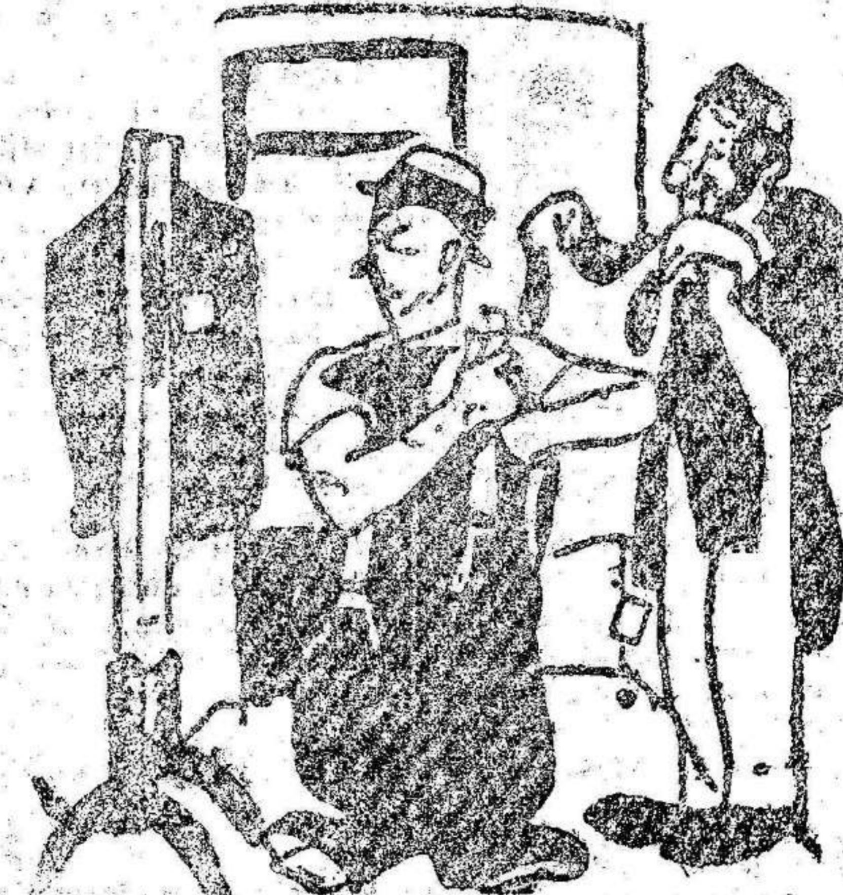
—Le está maravillosamente! —Sí, pero el pantalón me molesta un poco en los sobacos. (Lustige Blaetter.)