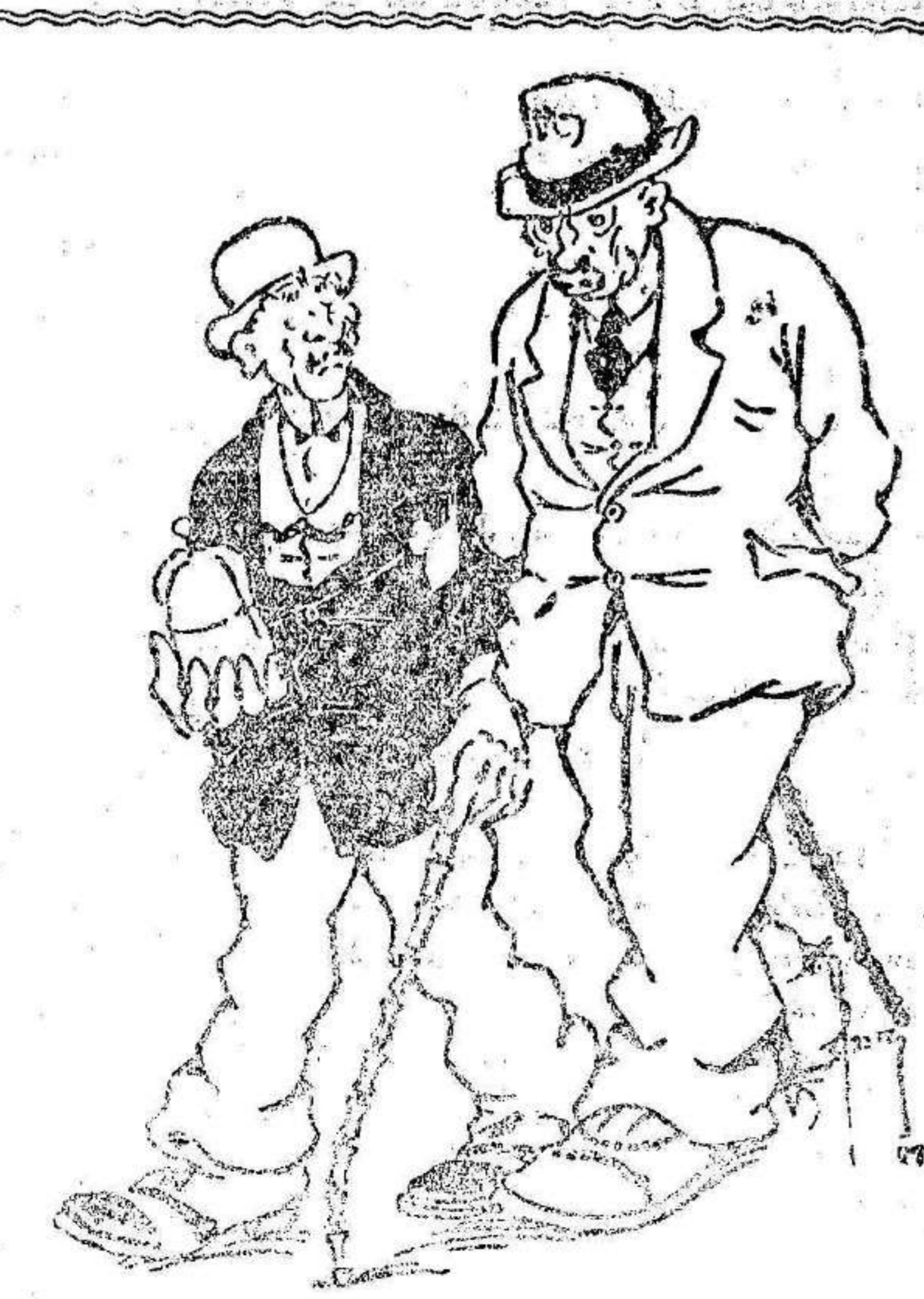
—Te quejas porque tu paquete es pesado?... ¡Sin embargo, yo no me quejo, y eso que mi mujer pesa 180 kilos y hace más de veinte años que pesa sobre mí!

«¡Te quejas porque tu paquete es pesado?... ¡Sin embargo, yo no me quejo, y eso que mi mujer pesa 180 kilos y hace más de veinte años que pesa sobre mí!»