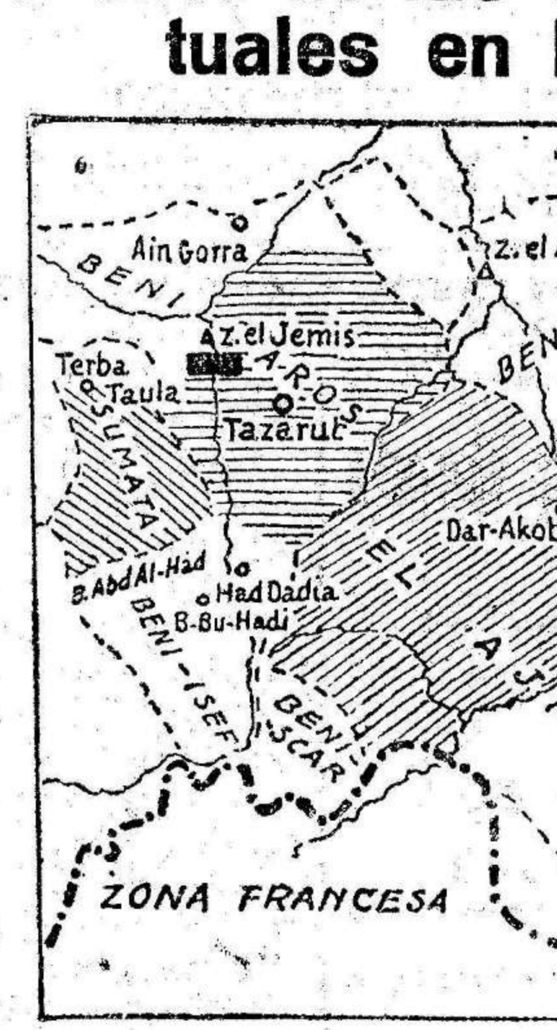
Gráfico de las operaciones actuales en Marruecos

La muerte de Tensemani, cabecilla rebelde que había adquirido en estos últimos tiempos un cierto renombre entre los disidentes, ha venido a dar un mayor relieve a las operaciones que con éxito singular y con escasa resistencia vienen realizando nuestras tropas en Marruecos.