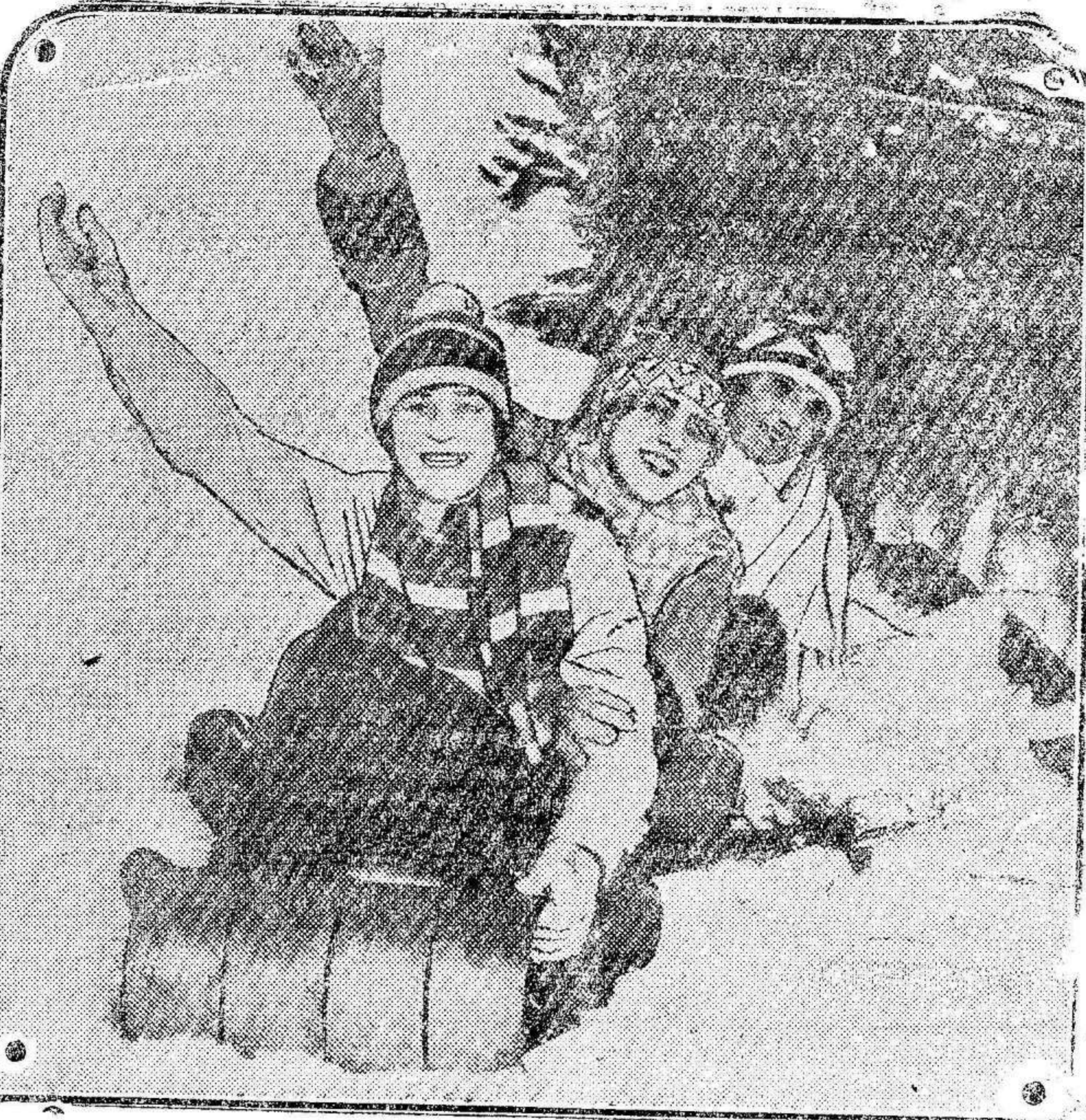
Tres encantadoras señoritas riéndose de la nieve. Probablemente, después se acercarían a una hermosa estufa, riéndose también de ella. Lo importante es reír. Estas bellas damitas, decididamente, no tienen pelo de tontas.