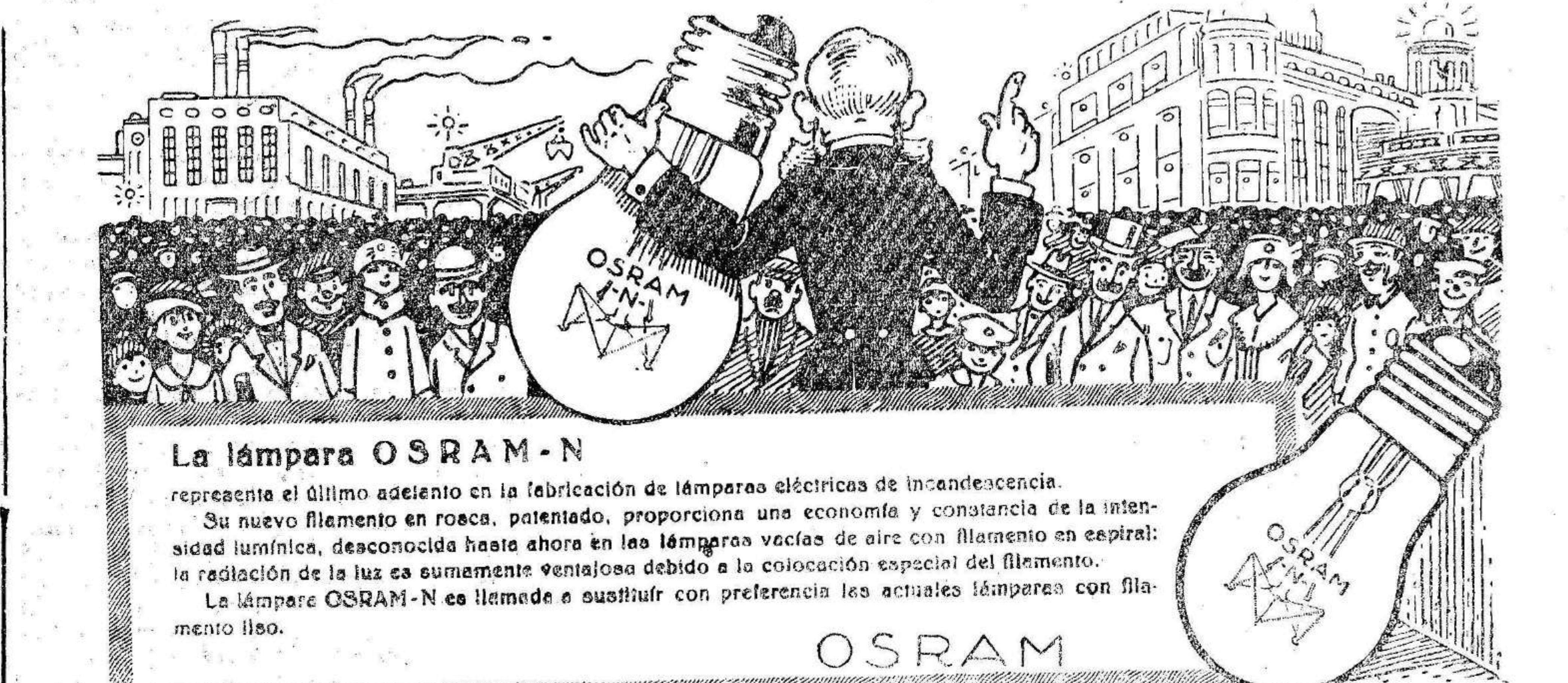
La lámpara OSRAM-N representa el último adelanto en la fabricación de lámparas eléctricas de incandescencia.

Este periódico ha sido sometido a la censura