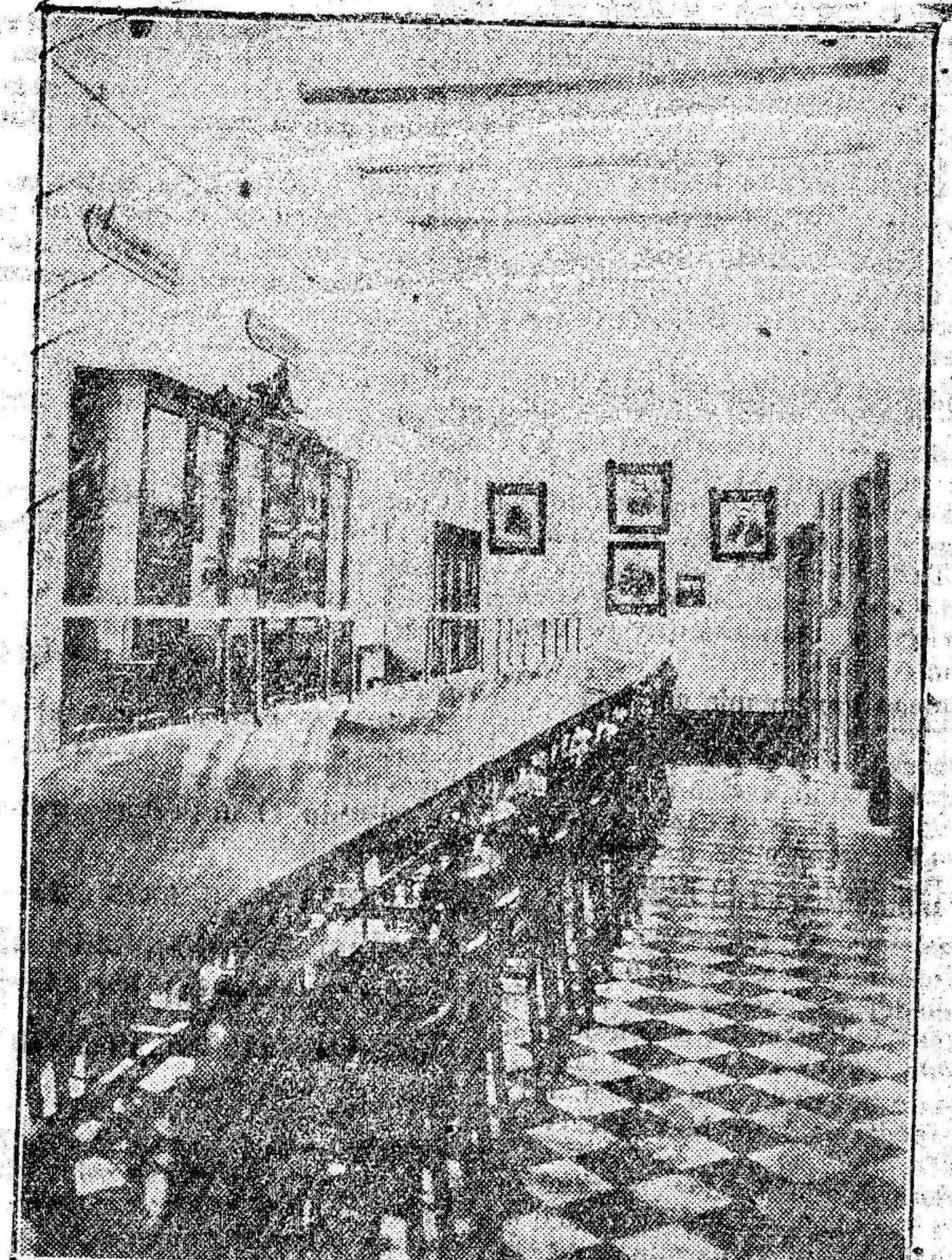
Biblioteca del Penal