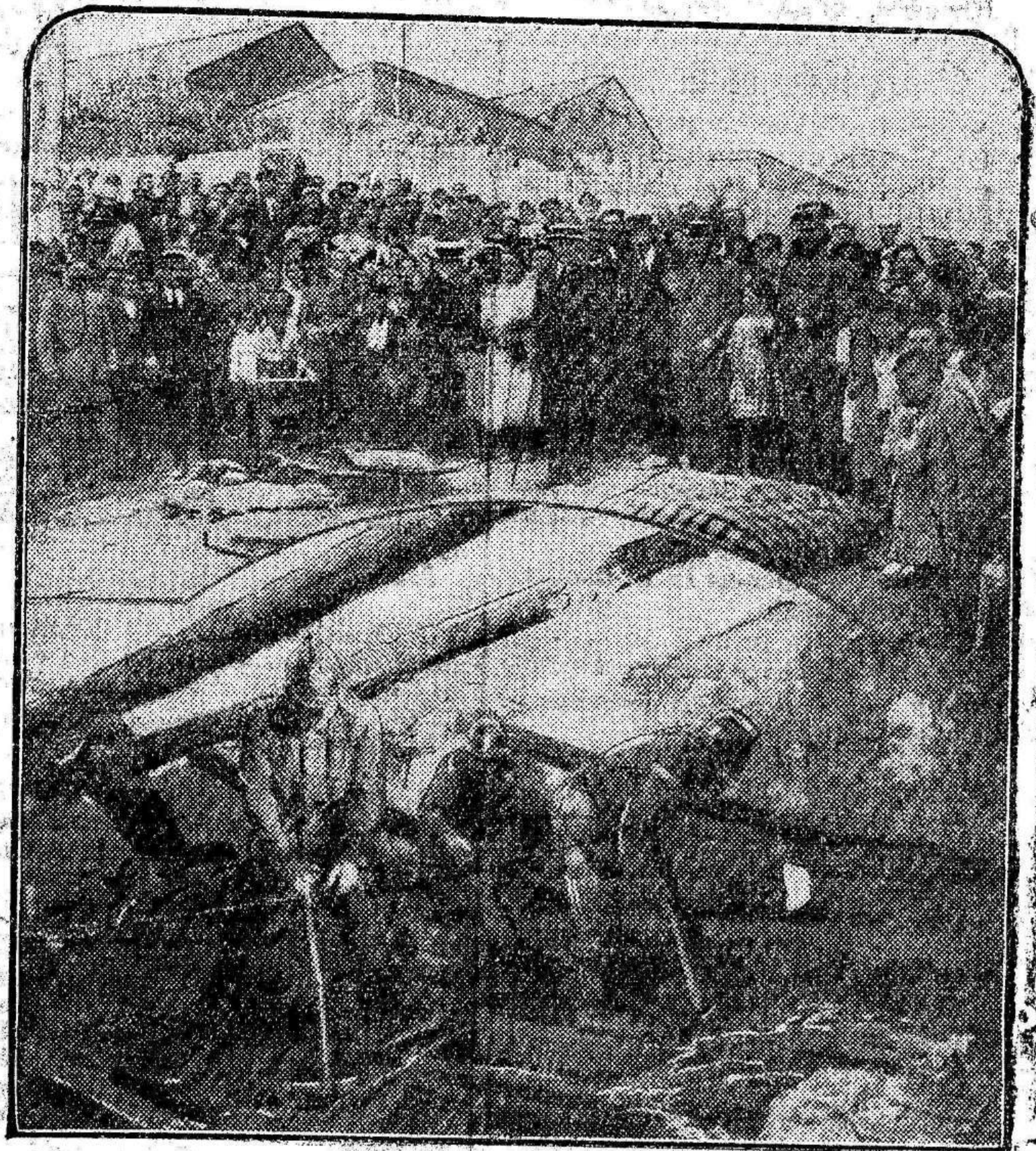
El incendio en la casa de la calle de Hilarión Eslava, donde vivieron las niñas desaparecidas.—Parte del público que se aglomeró para presenciar el siniestro, y una brigada de bomberos en los trabajos de extinción

Cuando iba a penetrar en la meta el español Gutiérrez, se adelantó el francés Chekis, el cual ganó el concurso.