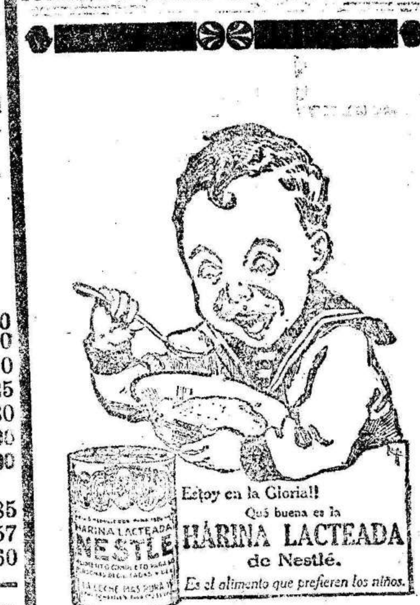
¡Ejerce en la Gloria! Qué buena es la HARINA LACTEADA de Nestlé. Es el alimento que prefieren los niños.

Por mediación de la antigua Casa Ungria (Encarnación, 2, Madrid), se puede registrar con todas las garantías de la ley las marcas de fábrica, comercio, ganadería, etcétera; los nombres comerciales, firmas y denominaciones sociales, los mercaderes comerciales y los productos farmacéuticos, obtener patentes de invención, cobrar créditos contra deudores morosos y obtener informes de la moralidad, capital y crédito de comerciantes compradores. Tiene en sus oficinas más de 50 empleados, y fianza en la Caja de depósito. Pídale usted tarifas y condiciones, y las recibirá a vuelta de correo.