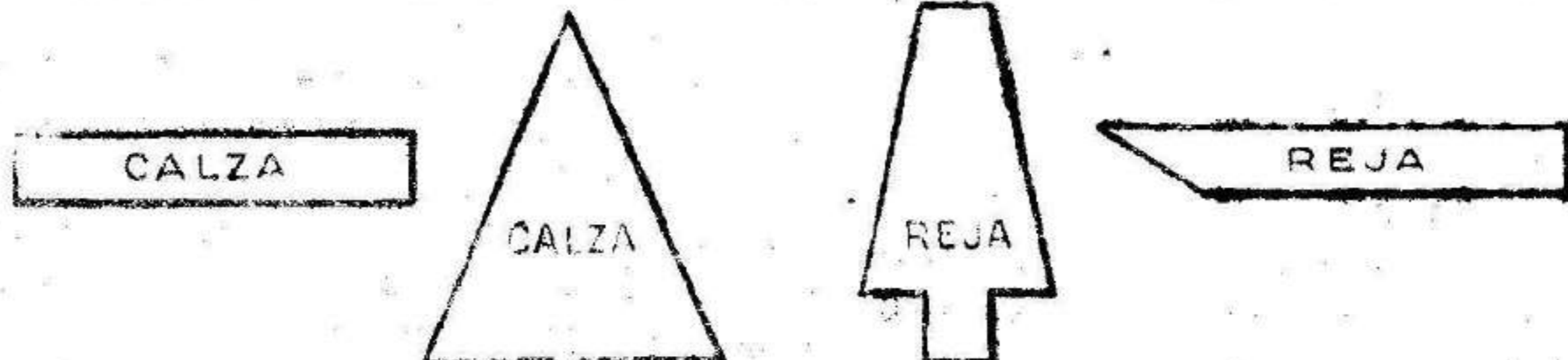
RECORTES Y PLETINAS PARA FABRICACION DE HERRADURAS.