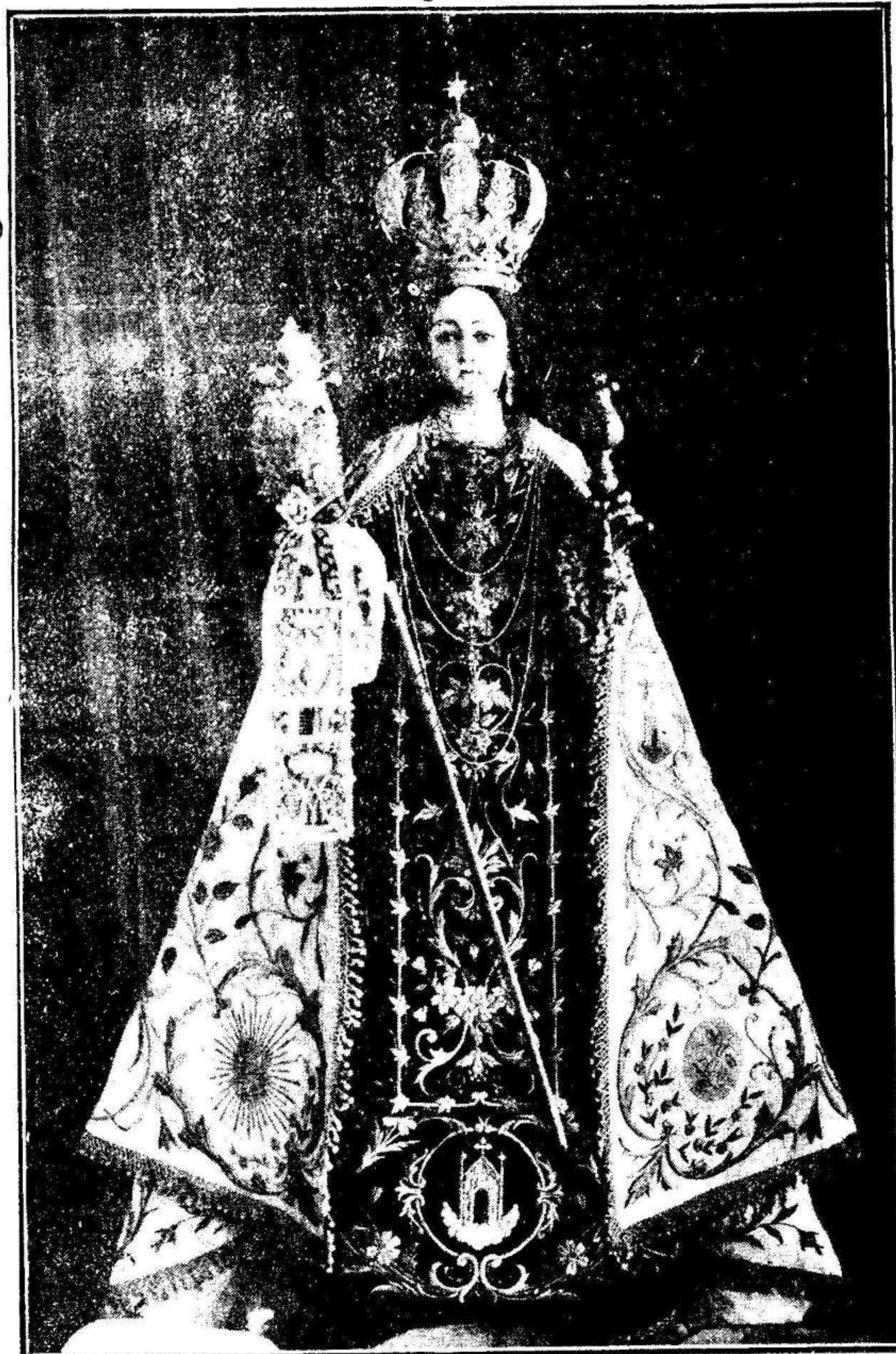
La Patrona del Barrio de su nombre, Nuestra Señora del Carmen, en cuyo honor se celebran solemnes y brillantes fiestas.