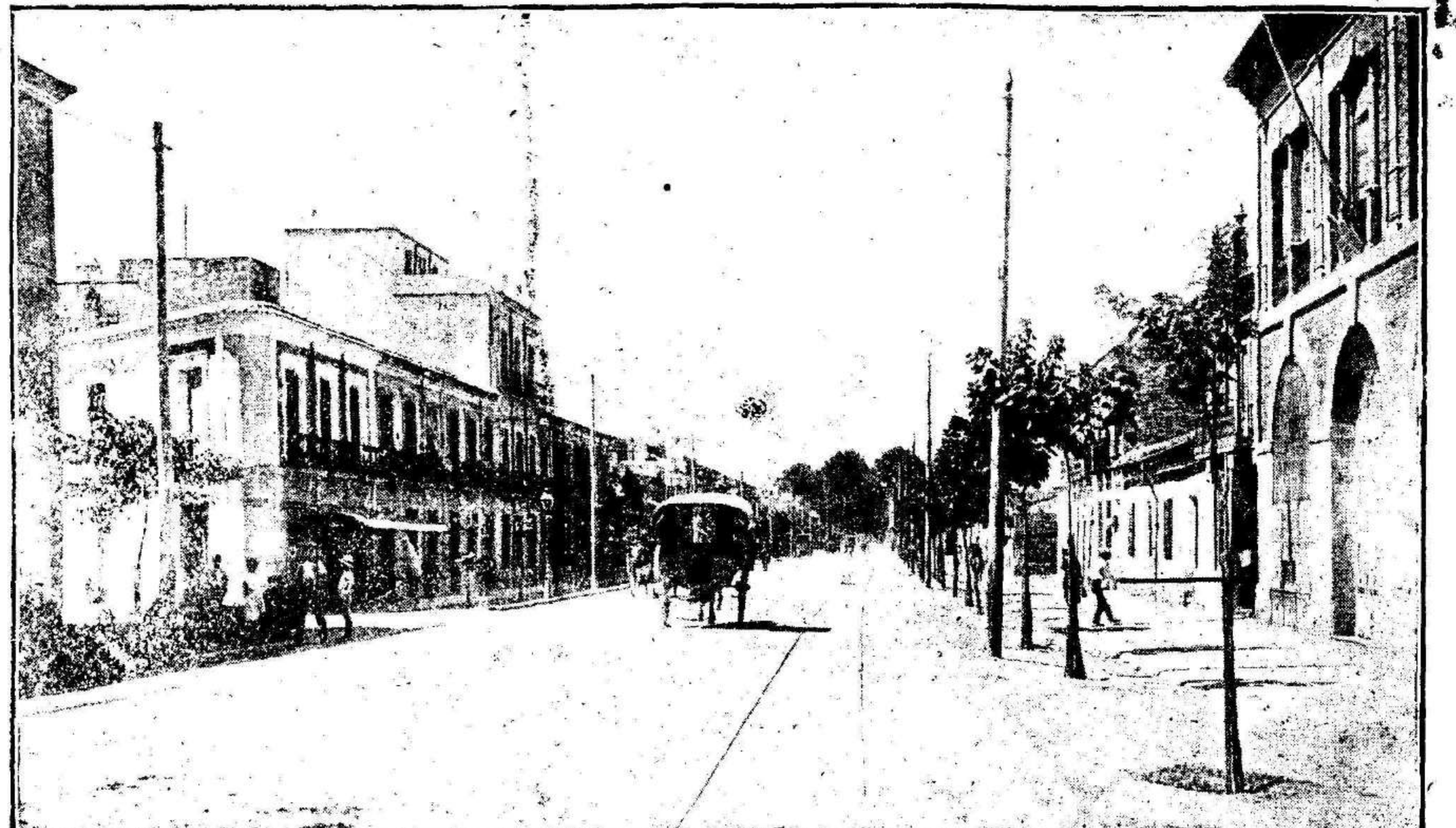
La entrada a Murcia y al Barrio del Carmen por las carreteras de Granada a Cartagena, es precisamente esta amplia y hermosa Avenida de Floridablanca.