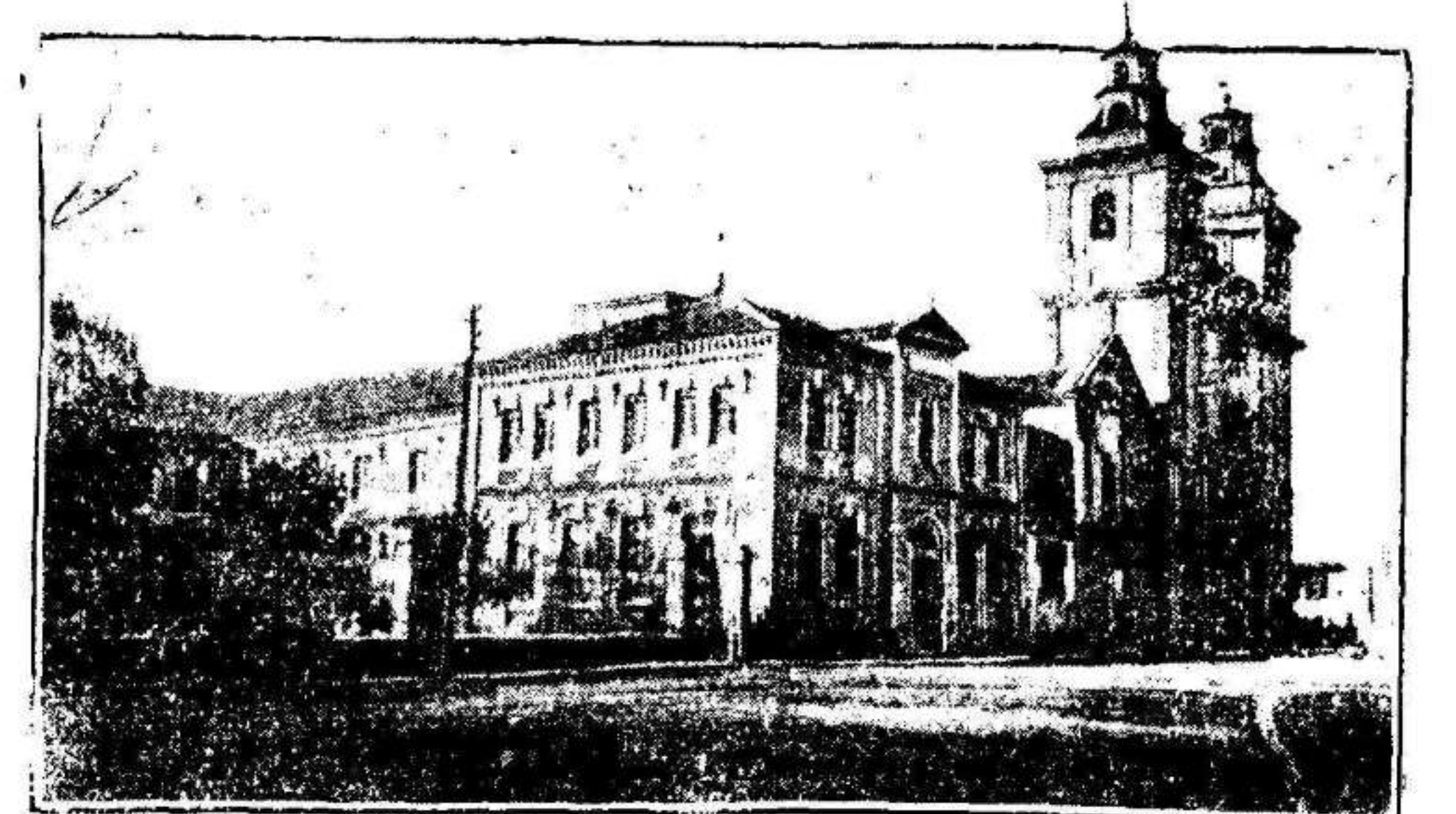
Una perspectiva de la iglesia del Carmen y el edificio de la Universidad

¡Virgen pura del Carmelo, haz que yo viva y que muera abrazado a tu bandera para conquistar el Cielo!