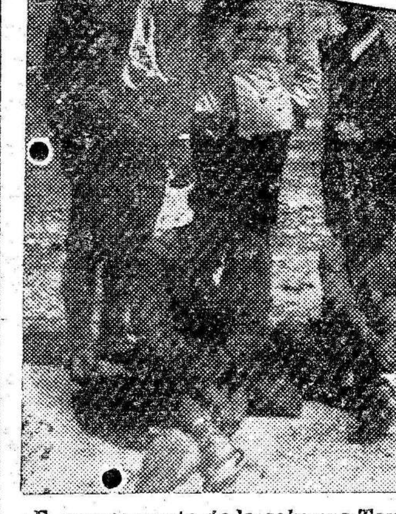
El campamento de la columna Tamarit y la posición que ocupaban una compañía de Ceriñola y una batería de montaña, vistas desde el redujo principal de Anual.

Mercado Hoy se ha celebrado el mercado semanal, viéndose muy concurrido. Las aves han bajado bastante de precio. Los pollos se han vendido de cuatro a cinco pesetas par. Mejoras urbanas Van muy adelantadas las obras de la explanada de San Francisco, habiéndose colocado la fuente de agua