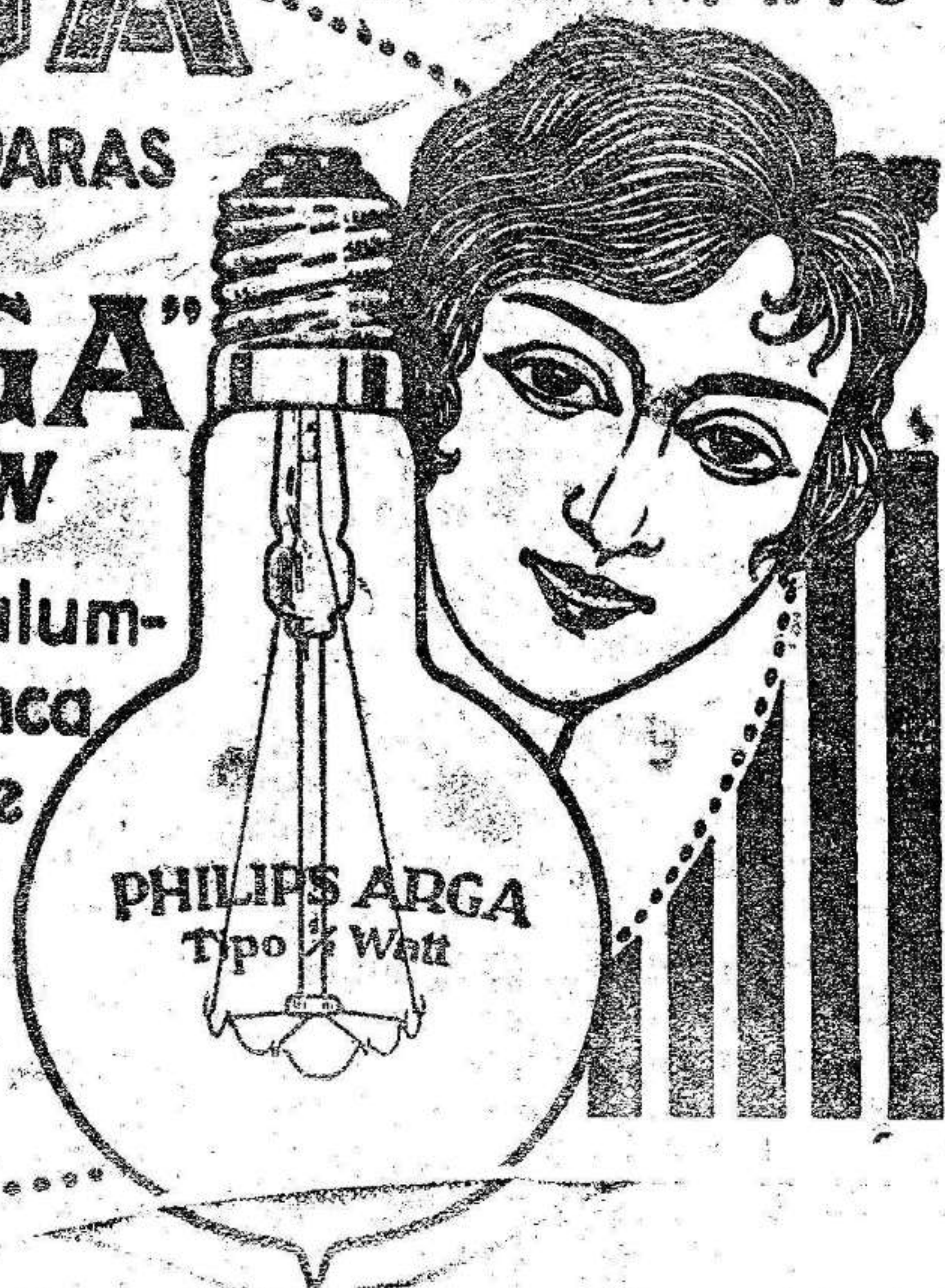
PHILIPS ARGA Tipo 1/2 Watt

Por el menor consumo de lámparas PHILIPS ARGA le salen prácticamente gratis. El particular, las industrias y el comercio tendrán a precio mínimo alumbrado más perfecto. Pídanse en todas partes. Al por mayor: ADOLEFO HIELSCHER, S. A., Madrid, MARQUÉS DE CUBAS, 10.