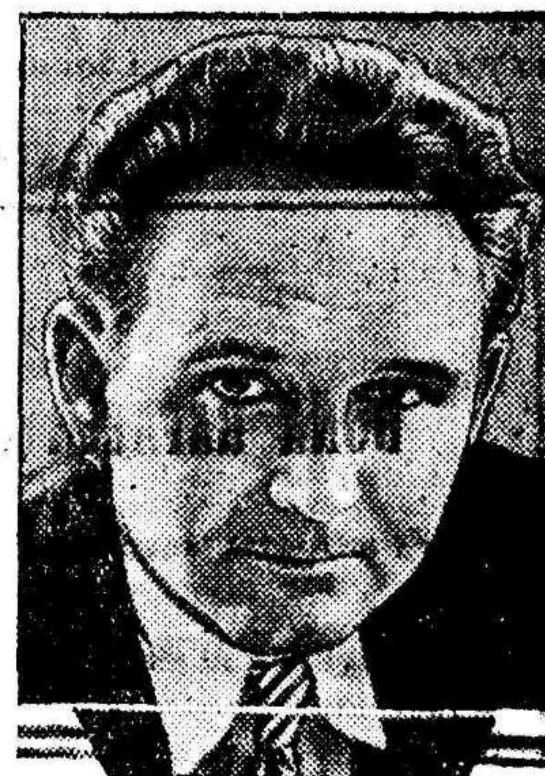
Franz Borzage, el formidable realizador de la película de CIFESA «HOMBRES DEL MAÑANA».

El mayor éxito del cine español y de Imperio Argentina con Miguel Ligeró