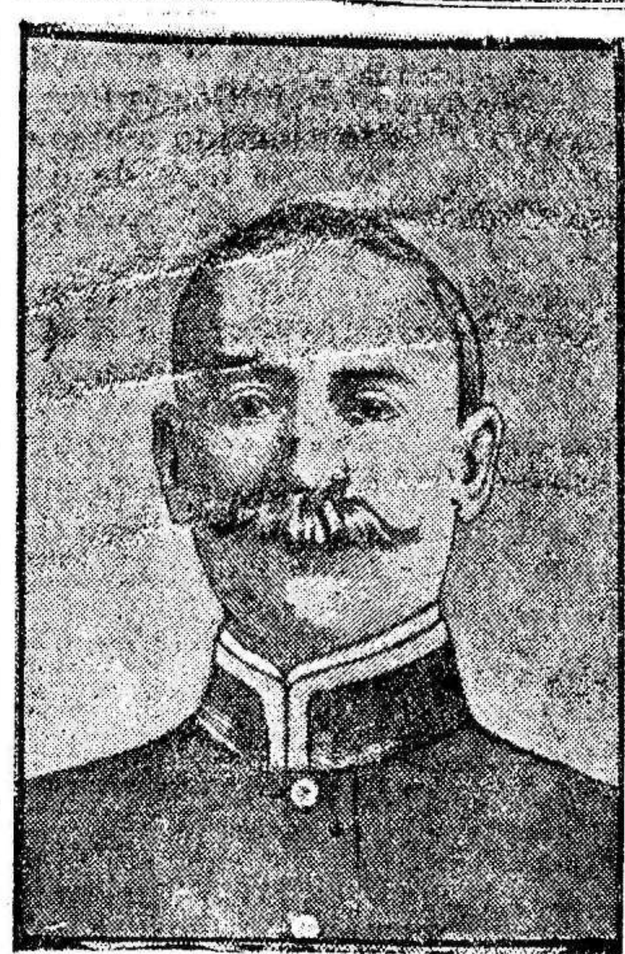
El almirante norteamericano Nenson.

Pudiera decirse que somos funcionarios públicos; está bien, así lo creo, todo menos una clase mixta, como parece se ha querido hacer; pero entonces no debemos tributar más que con el 5 por 100 hasta 1.300 pesetas como estos, y el exceso que pagamos debe destinarse al Estado a concedernos los derechos pasivos.