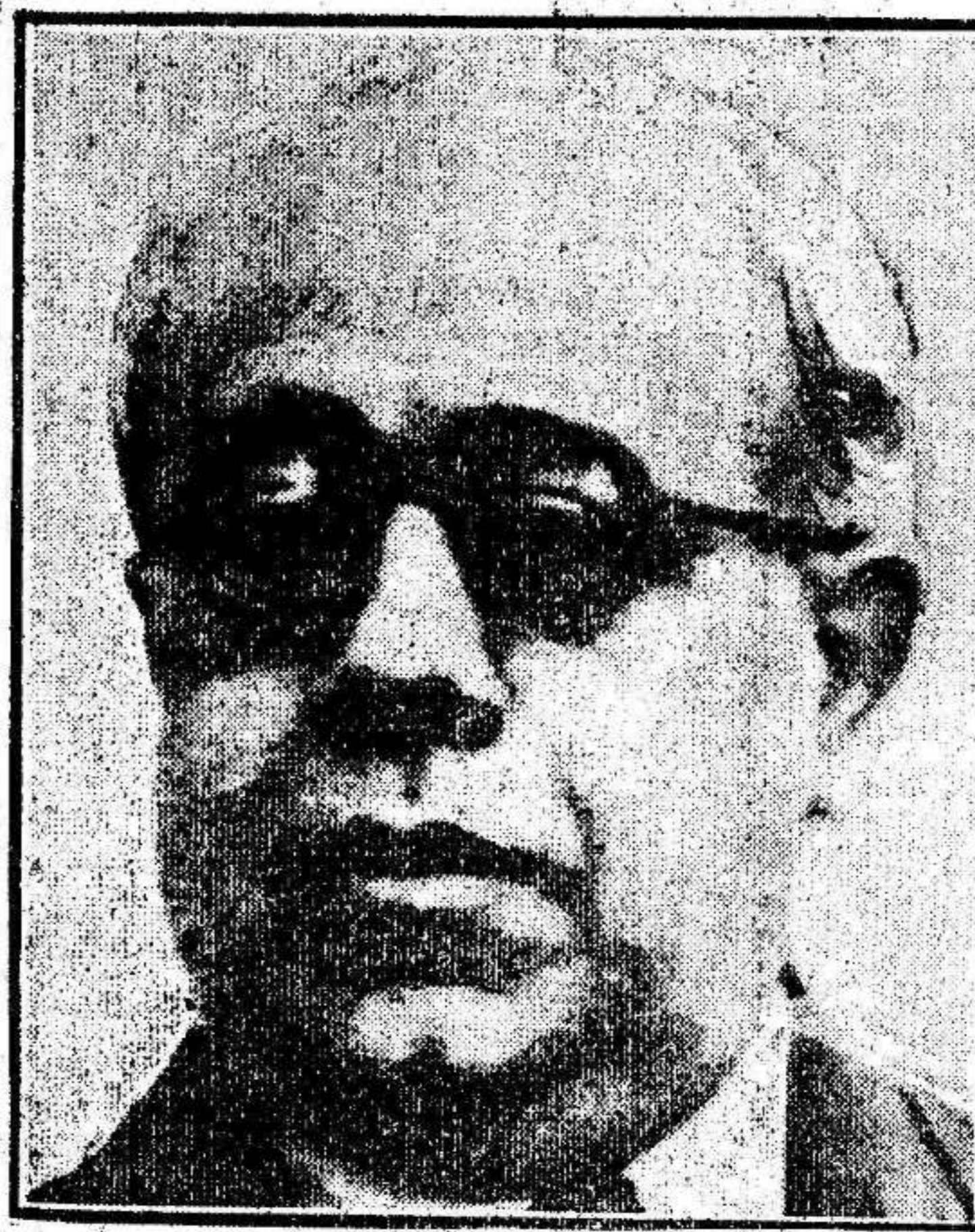
Don Manuel Aznar

Las tres figuras más destacadas del republicanismo español, que han logrado establecer el contacto con los socialistas para luchar en las próximas elecciones contra el enemigo común. Los puntos de vista expresados por los negociadores de esta alianza, han sido objeto de un detenido estudio y ambas partes saben deponer intransigencias y recelos hasta formar el frente único de la República. Los acuerdos constituirán el índice del programa que han de exponer a la consideración nacional para que el pueblo decida sobre la suerte de la República.