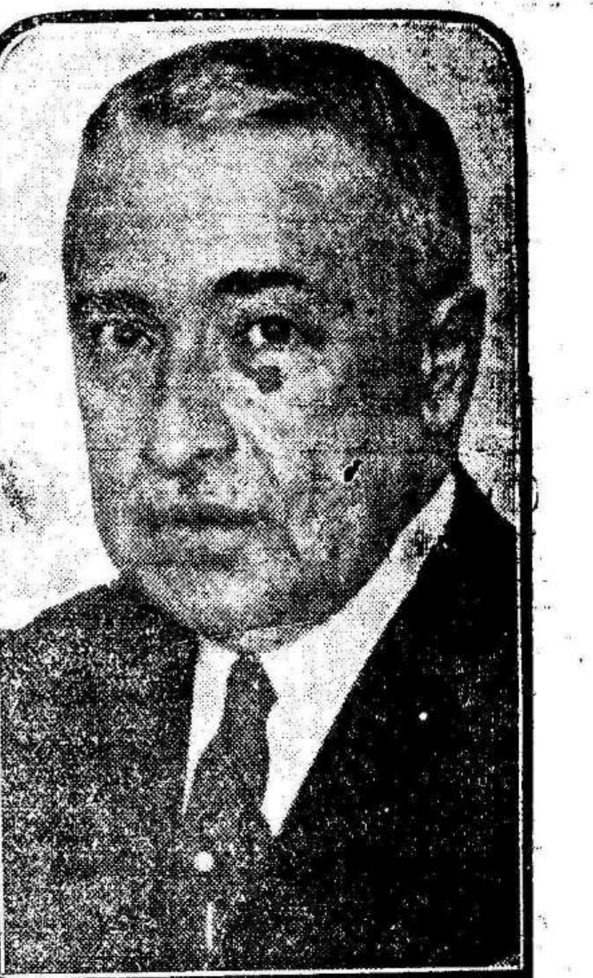
Don Félix Escalas, que ha sido nombrado gobernador general de Cataluña y presidente de la Generalidad.

Acercar del estado social de Cataluña dijo que tenía la complejidad de una región de gran potencialidad industrial, con extremismos inevitables y que evidencian precisamente esa potencialidad.