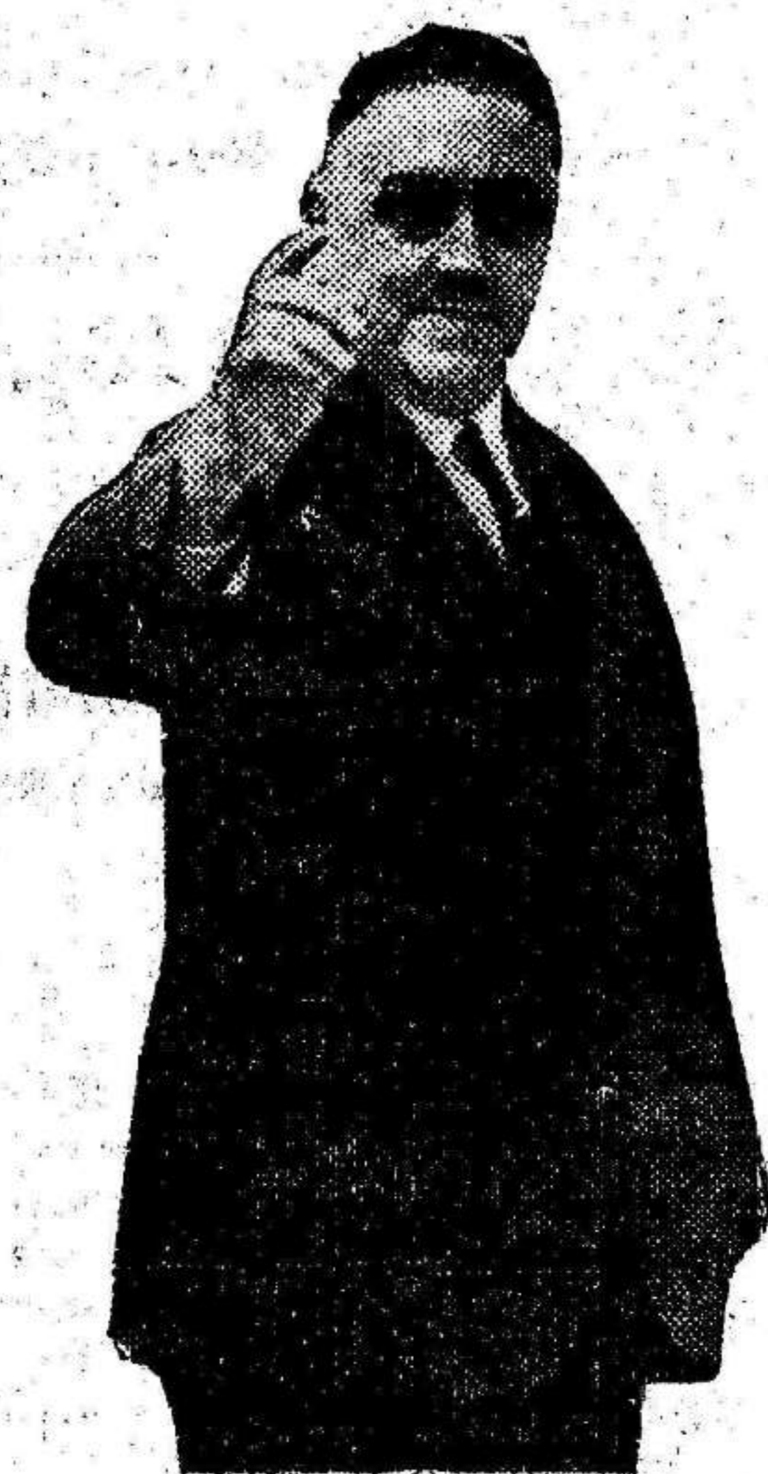
Don Felipe Sánchez Román