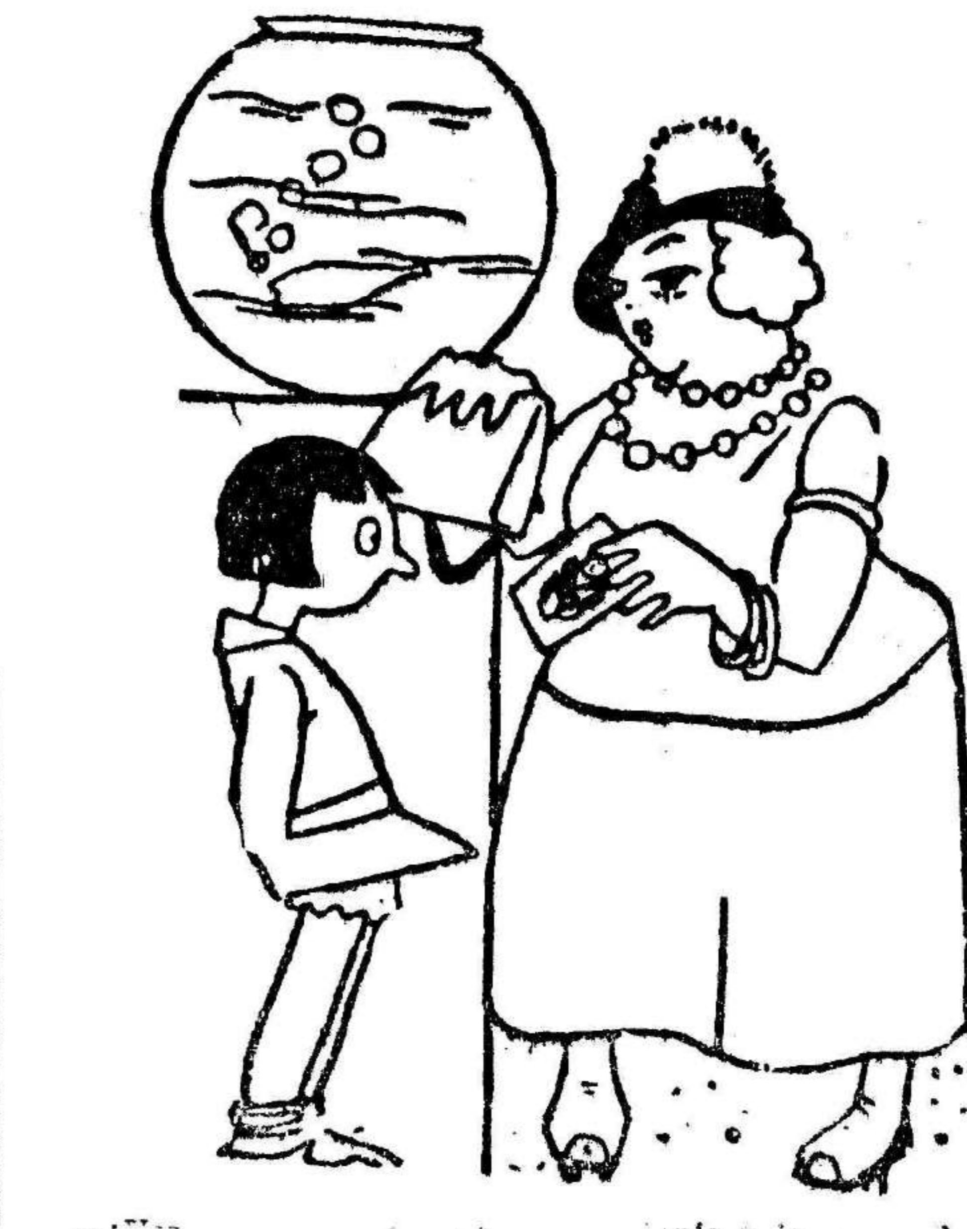
—Y ya se había inventado la fotografía?

VALENCIA, Quiosco Kilo de la Pla- ta, calle Daroca.