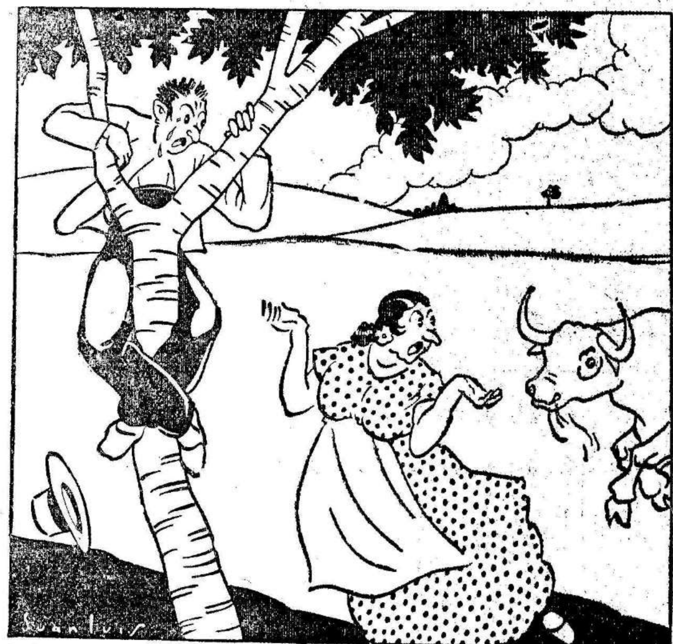
—¿Mané de mi arma! ¿Sárvame, qué lo tengo en mí? —¿Qué quiere, Angustia? ¿Te cree que t'ha casó con Pasqua Marquet?