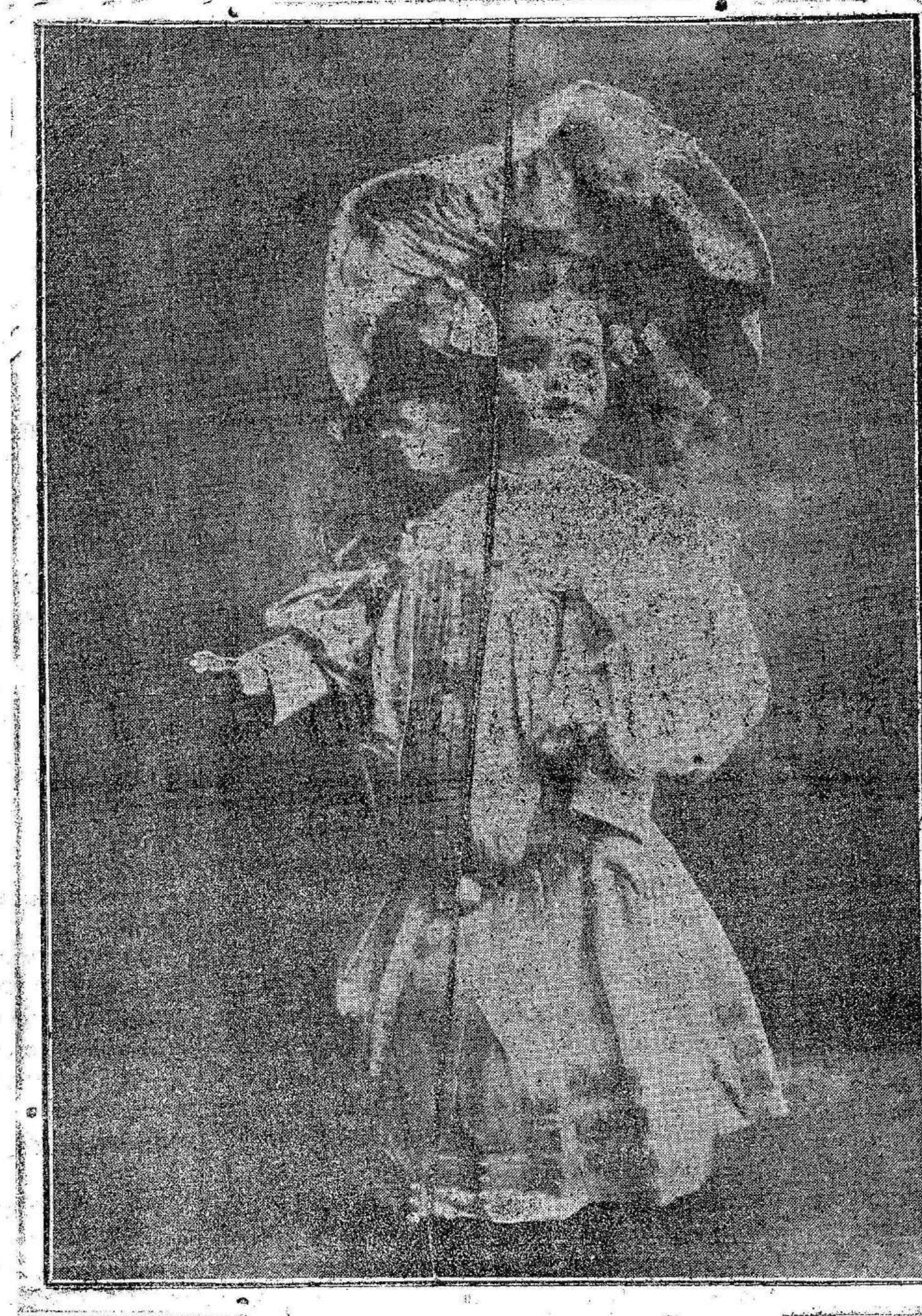
Segundo premio.—LA MUÑECA

—Los anunciantes tienen derecho a percibir tantos bonos de opción como fracciones de 2 pesetas satisfagan en la Administración de El Liberal. —Los suscriptores percibirán, desde Enero, tantos dos bonos como meses adelantados abonen, sin perjuicio de los que les correspondan por los meses corrientes. Las fotografías de los regalos se exhiben en Cartagena, en el Bazar Cartago, plaza San Francisco, 24.