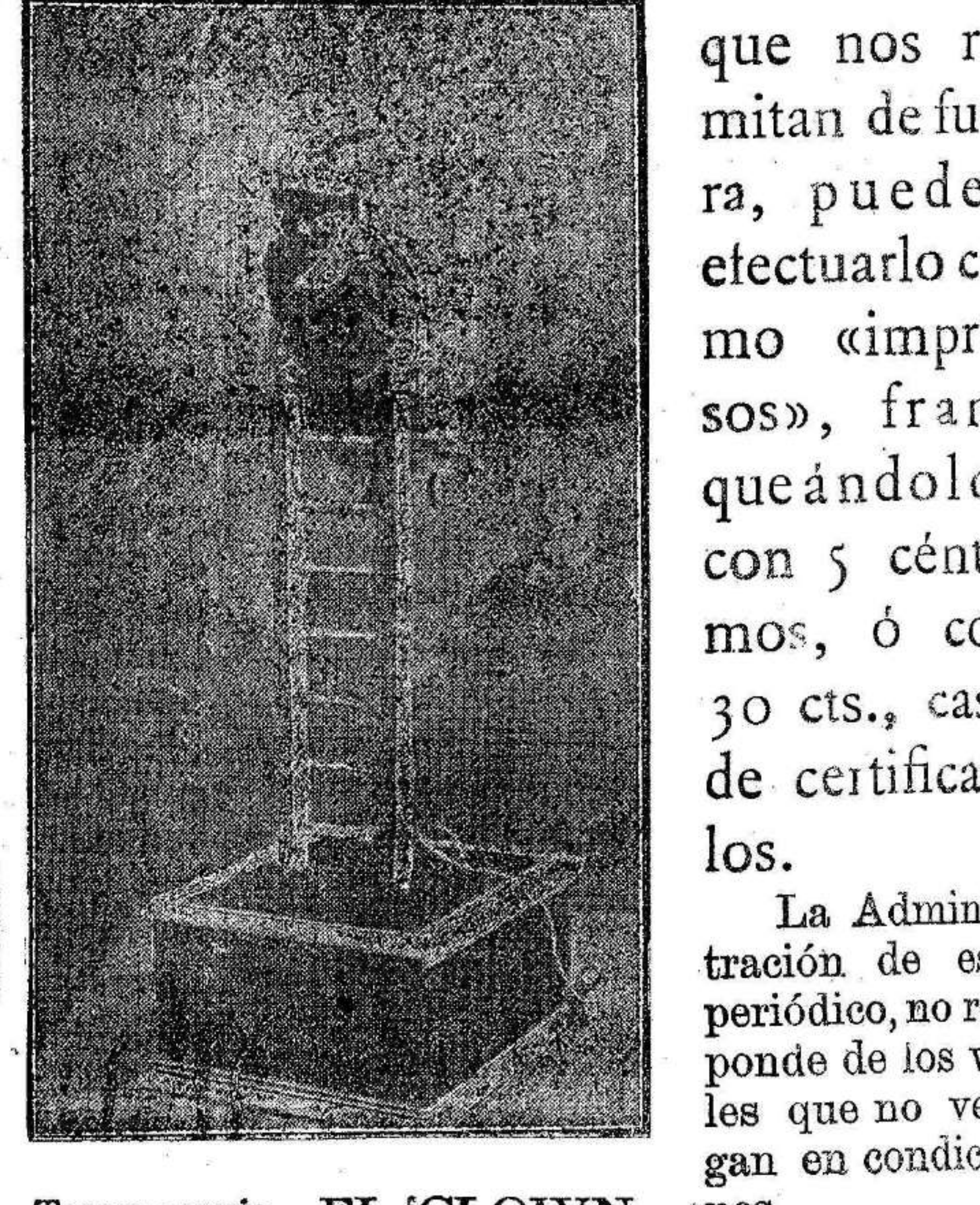
Tercer premio.—EL CLOWN

—Se concederá un bono de opción a los regalos de El Liberal a los niños, presentando ó remitiendo a la Administración de este periódico, 15 vales antes del día 8 de Enero de 1907.