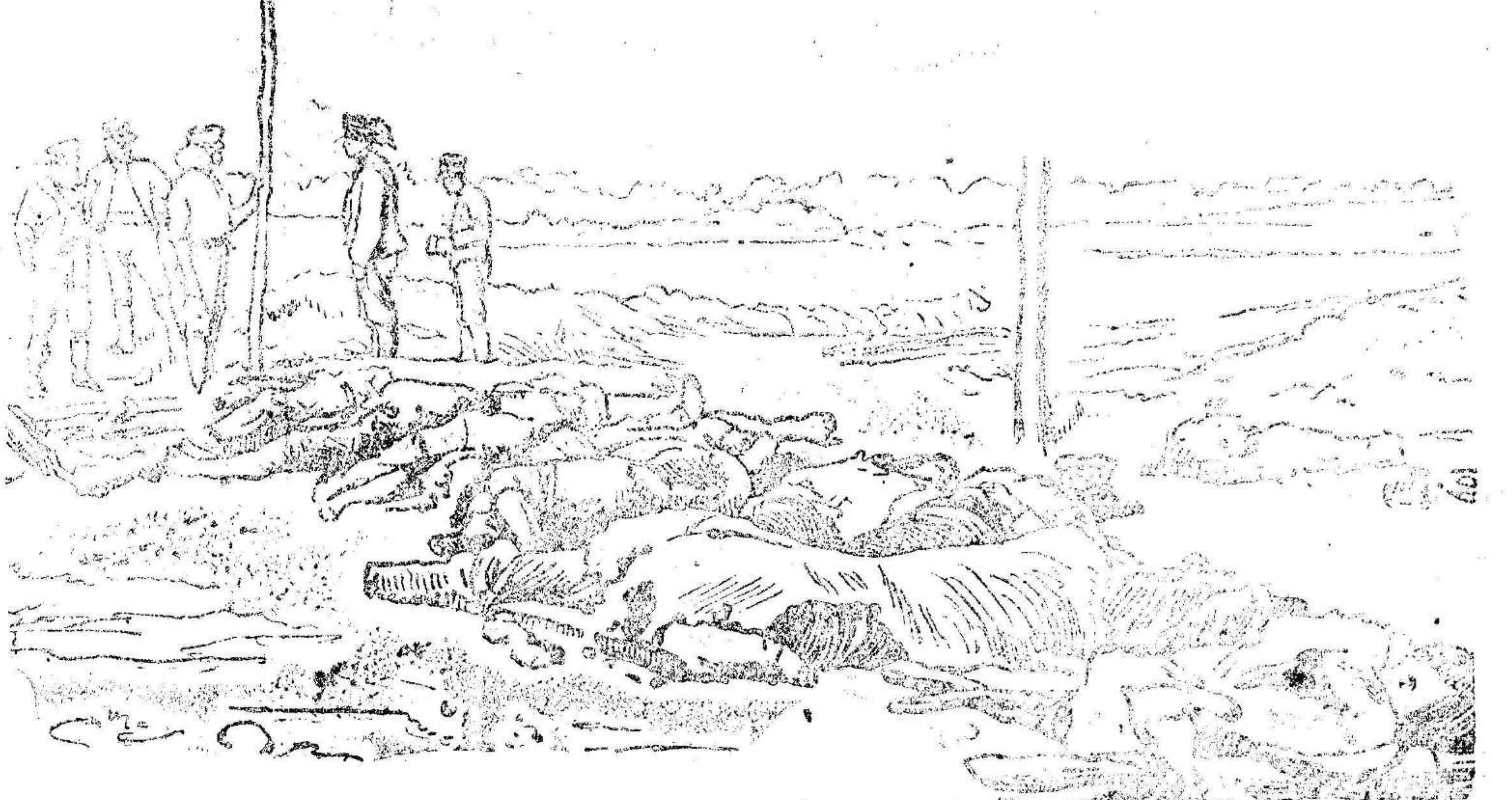
APUNTES DE LA GUERRA

Fuó detenido el comandante Castro, que intentó sublevar la escuela de artillería.