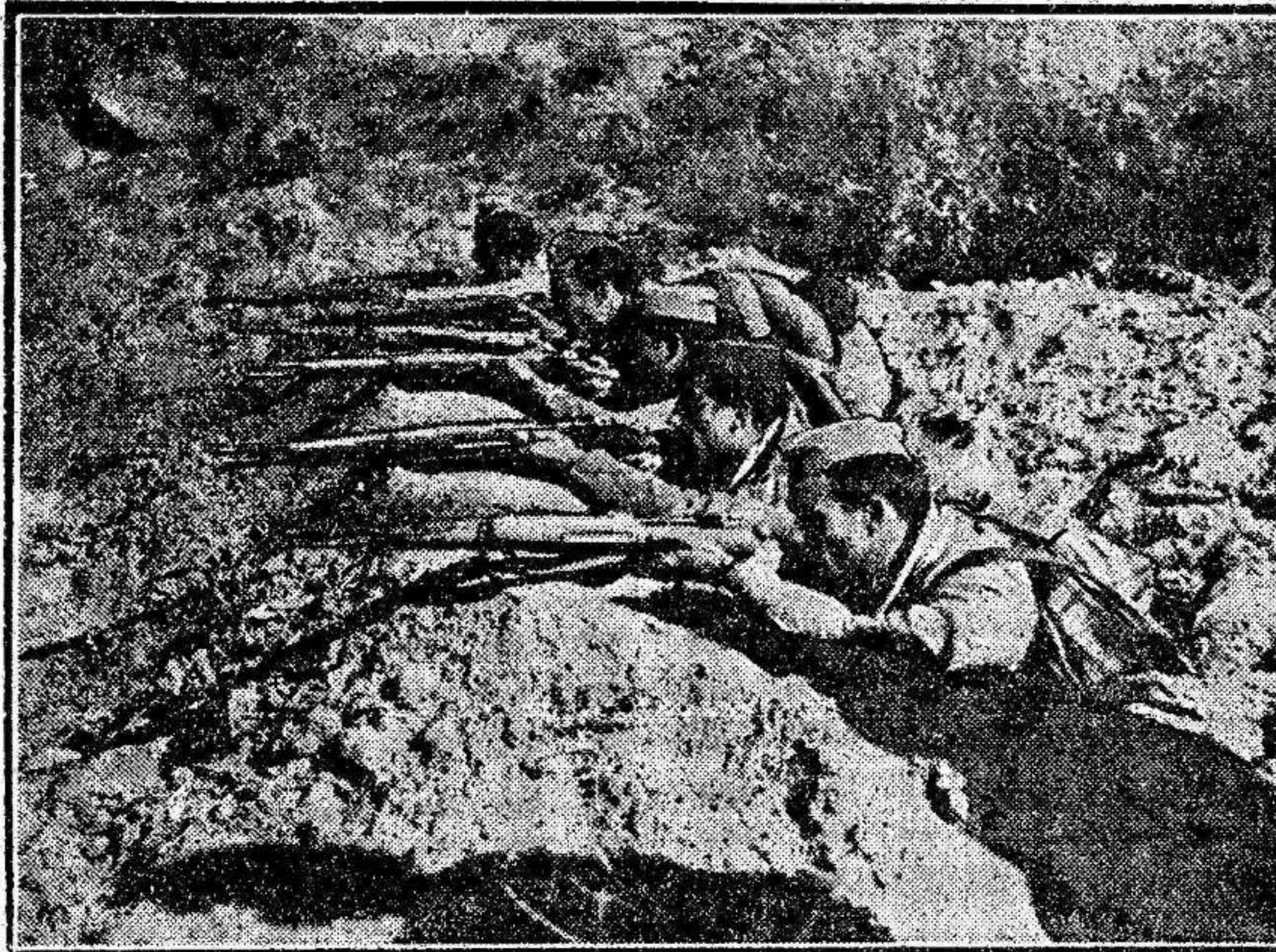
Un aspecto de cómo nuestros leales combatientes defienden en las trincheras la causa de la República y del pueblo.