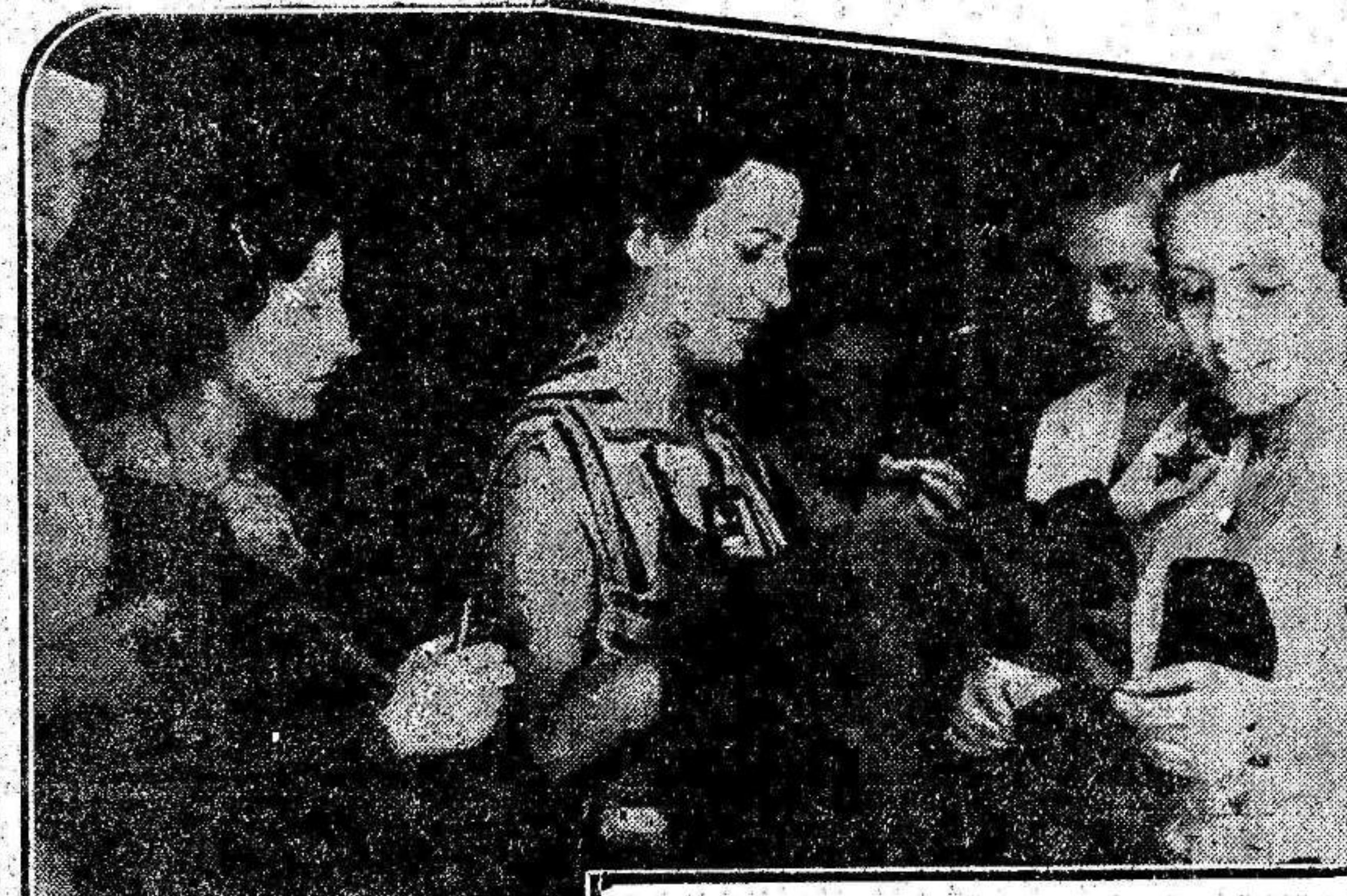
Grupo de obreras de la aguja, pertenecientes a las Juventudes Socialistas, en la puerta del edificio habilitado como taller y donde diariamente trabajan en la confección de prendas de abrigo.

Recomiendo con este motivo a los trabajadores que no hagan caso alguno a las burdas patrañas que hacen circular los enemigos de la República y que tengan presente que por muy cerca que el enemigo se encuentre de Madrid, su derrota será cuestión de horas. Todos deben mantenerse dentro de la mayor serenidad en las horas actuales y las mujeres han de preocuparse de cumplir con sus deberes de madres, levantando un baluarte con sus corazones, donde se estrellará irremediablemente la furia fascista.—Febus.