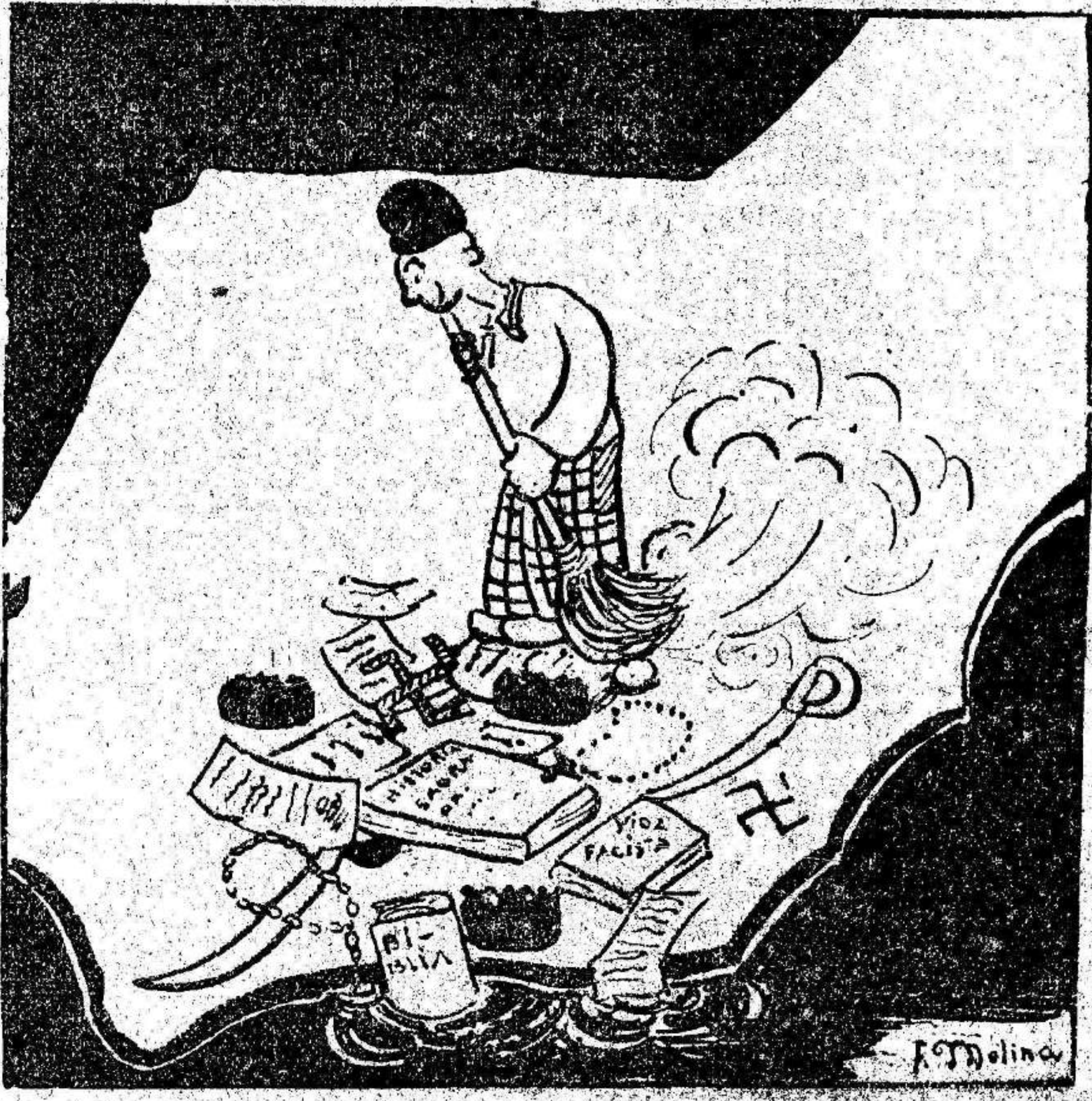
Antes de emplear nuestra nueva Lanza hay que barrerla bien.