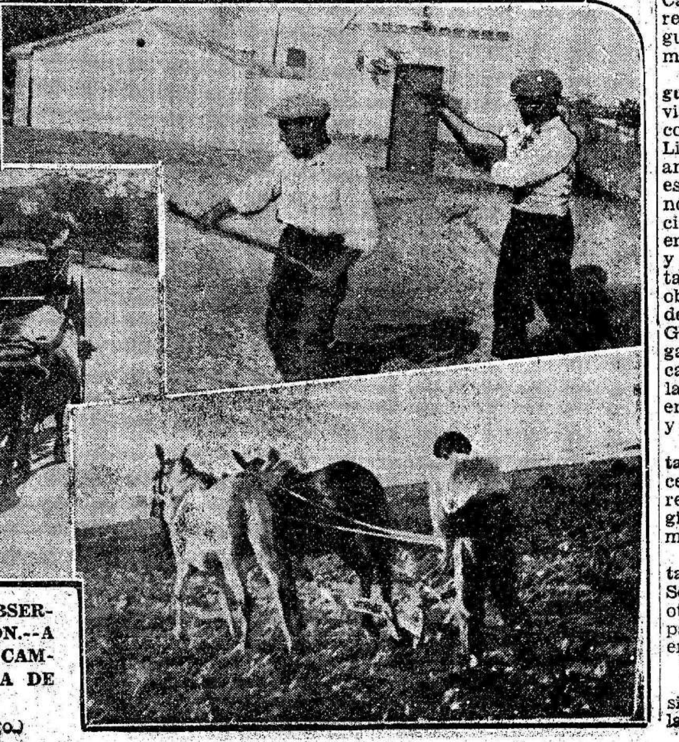
UN CARRERO Y DOS MILICIANOS OBSERVAN EL BOMBARDEO DE UN AVION.—A LA DERECHA SE PUEDE VER A LOS CAMPESINOS TRABAJANDO EN LA ZONA DE GUERRA

Murcia, 6 de octubre de 1936. A continuación se suspende la sesión para reanudarla a las seis de la tarde.