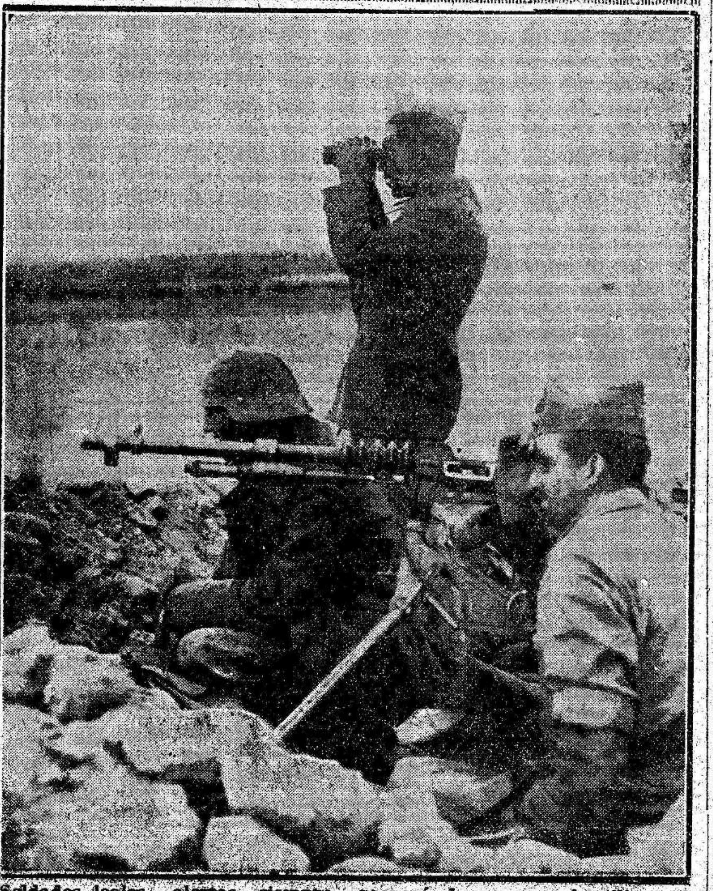
Soldados leales, alerta siempre, preparándose para hostilizar al enemigo.