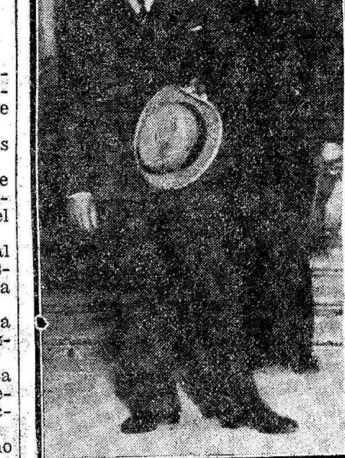
El primer embajador de Rusia en España, al salir de presentar sus cartas credenciales.

Los sótanos del Gobierno militar se encuentran separados de los del Alcazar por un solo tabique. Derrumbado que sea éste, no podrán los rebeldes seguir resistiendo.—Fébus.