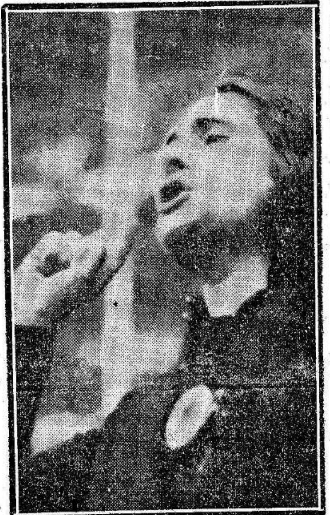
Dolores Ibaruri "Pasionaria"

BARCELONA.—Los periodistas han celebrado hoy una entrevista con el diputado del partido Comunista, Dolores Ibaruri "Pasionaria" que ha llegado esta tarde a Barcelona para tomar parte en un acto político.