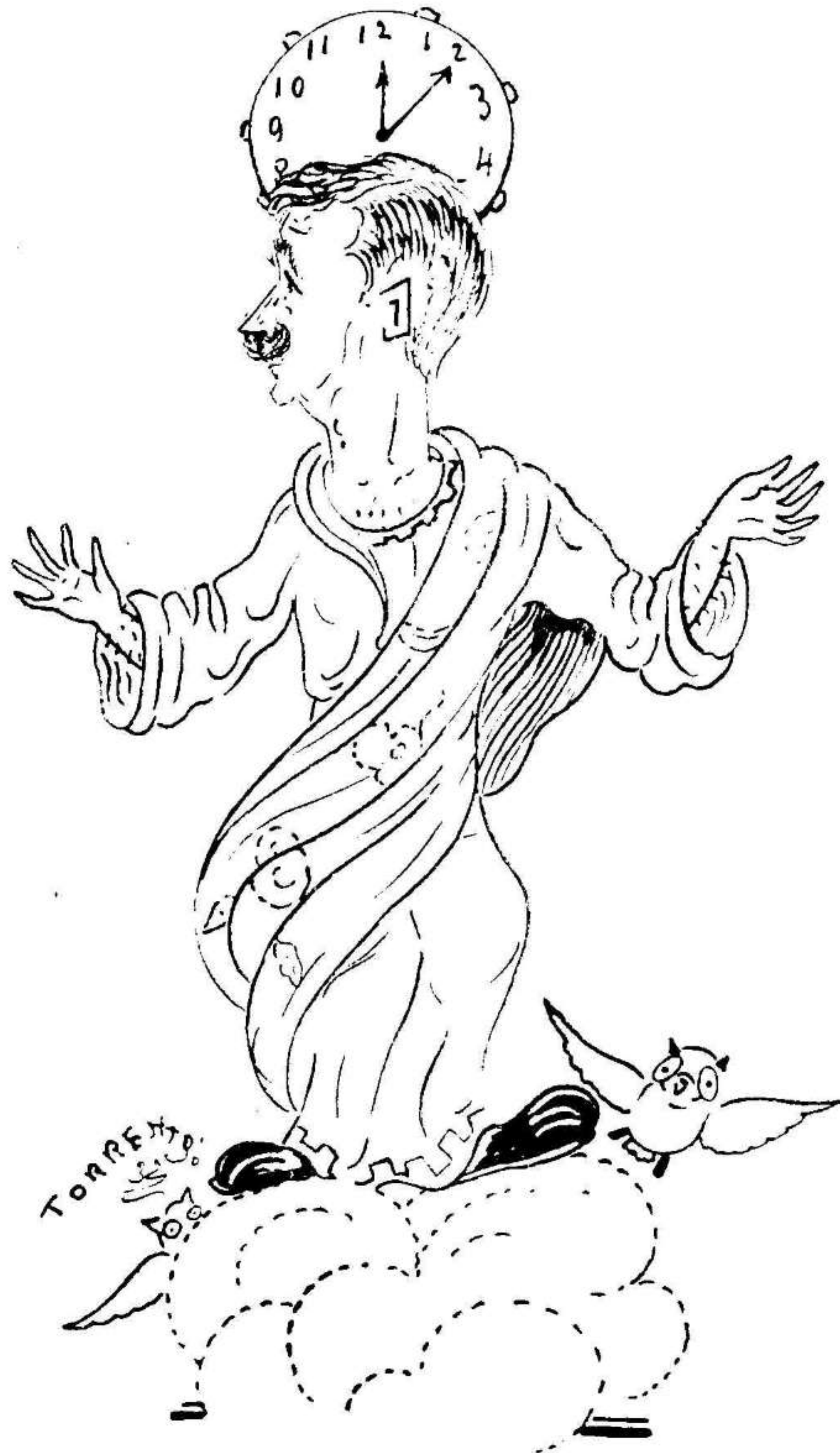
San Vila, (jabalí y mártir)