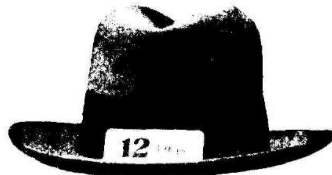
Platería... - Murcia

Por correo interior hemos recibido este buñuelo poético, que publicamos porque no es anónimo y en recompensa a los quince céntimos que se ha gastado el autor en el franqueo.