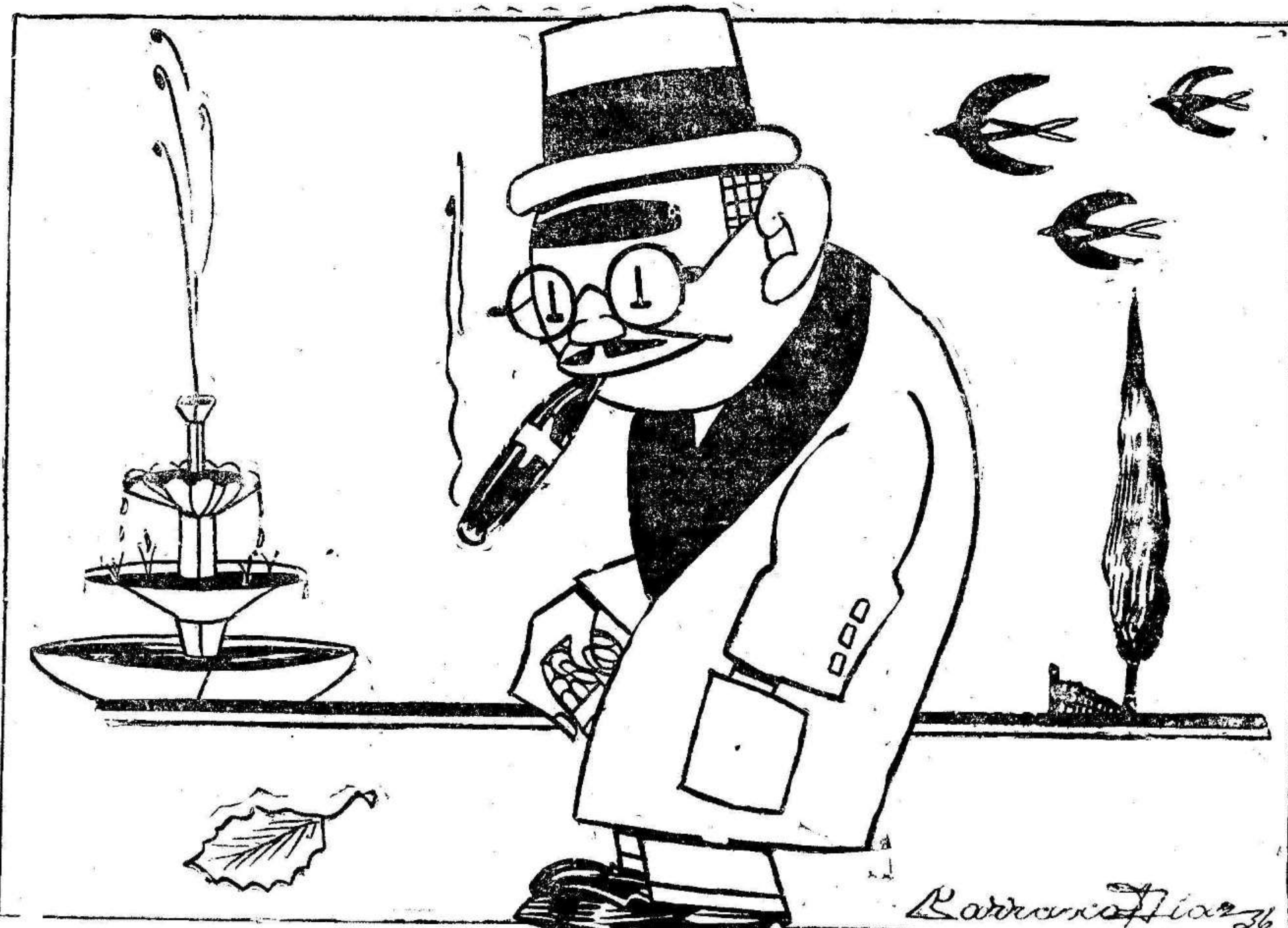
Y ahora, que me han “dejado cesante”, ¿a qué me voy a dedicar yo?