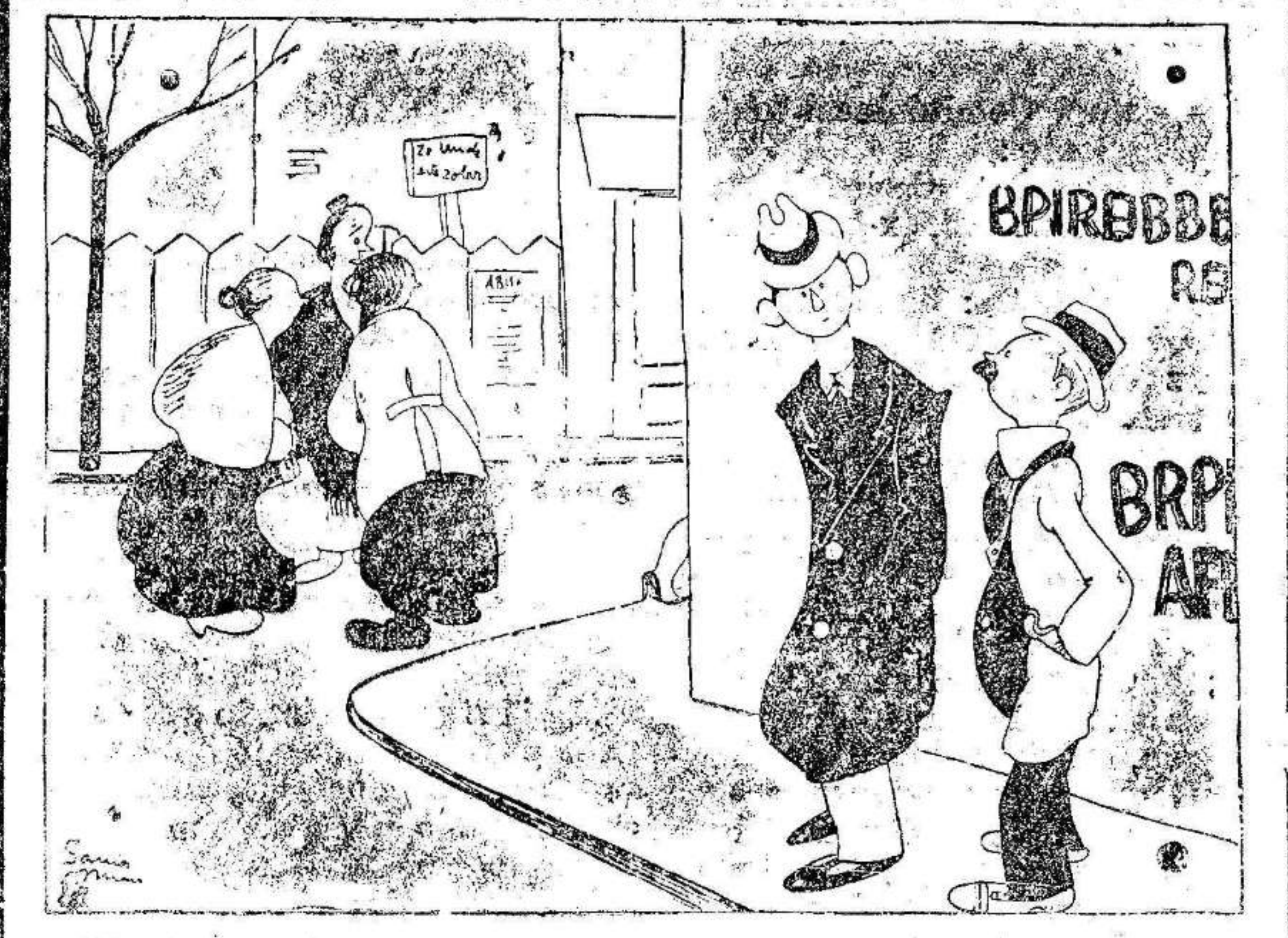
—Ya se sabe de fijo. La plaza de toros Monumental se inaugurará tres días antes que el teatro de la Opera. —¿Y cuándo se inaugurará el teatro de la Opera? —Tres días después que la plaza de toros Monumental.