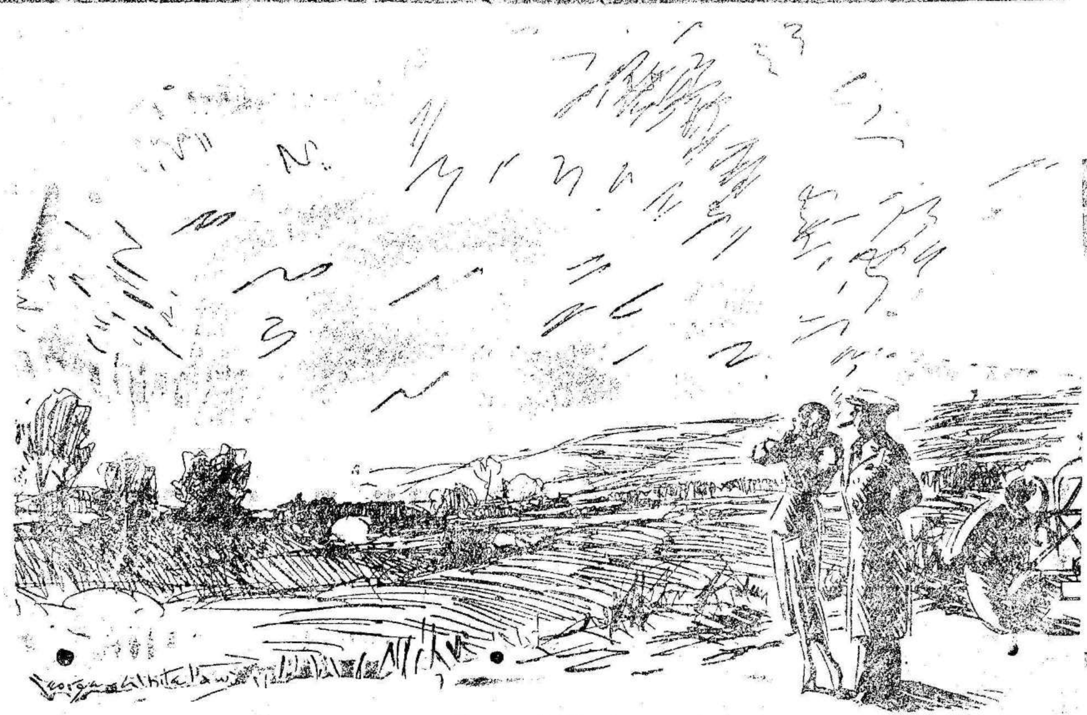
LA «ESTRELLA» CINEMATOGRAFICA TIENE IDEAS GENIALES. La «estrella» cinematográfica.—¿Qué apacible y tranquilo es esto! ¡E! una lástima que no construyeran ciudades en el campo.

El ministro de Obras públicas respondió que las batallas solo podrían ganarse en la lucha.