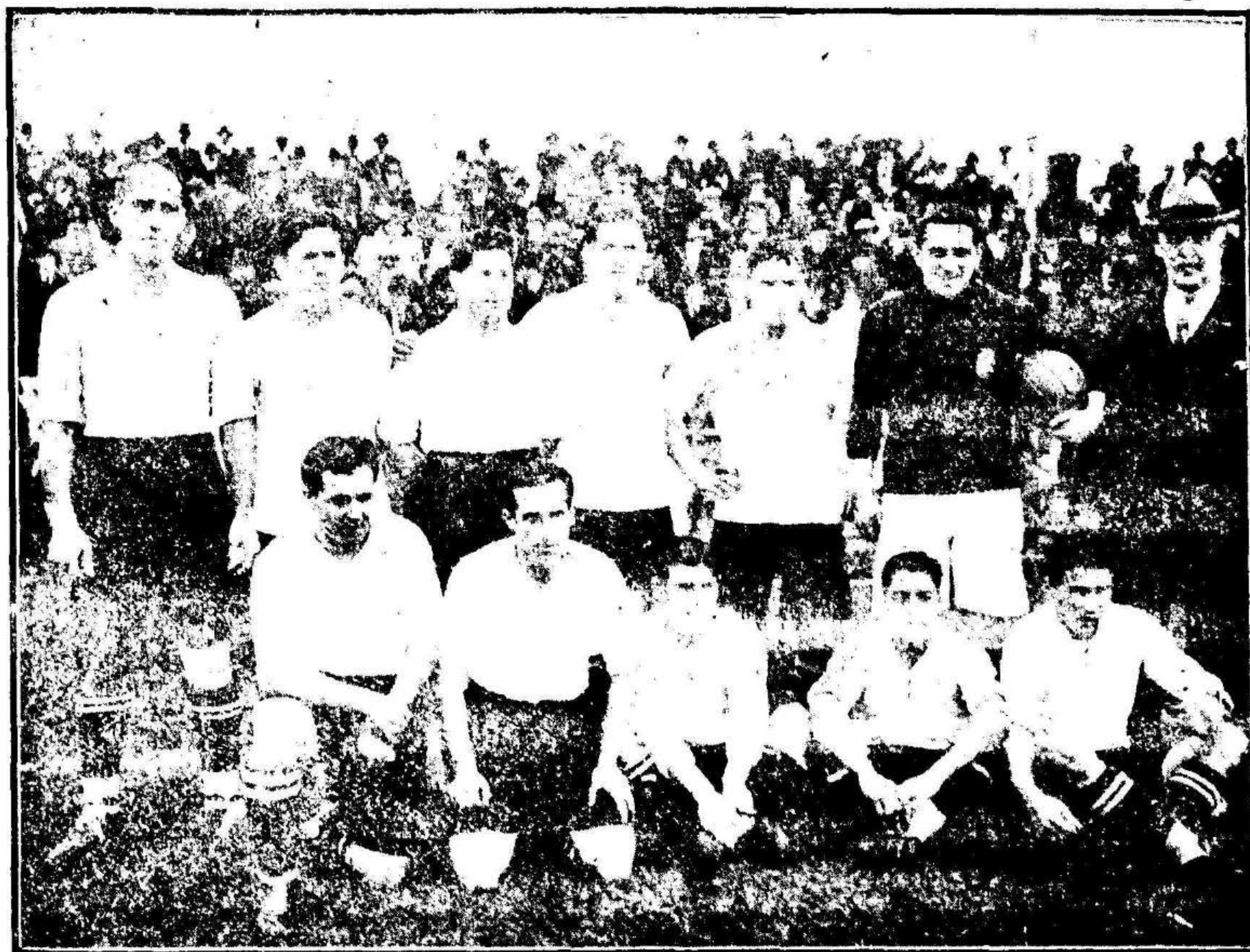
EL EQUIPO VASCO QUE RECIENTEMENTE HA JUGADO EN AMÉRICA DEL SUR.