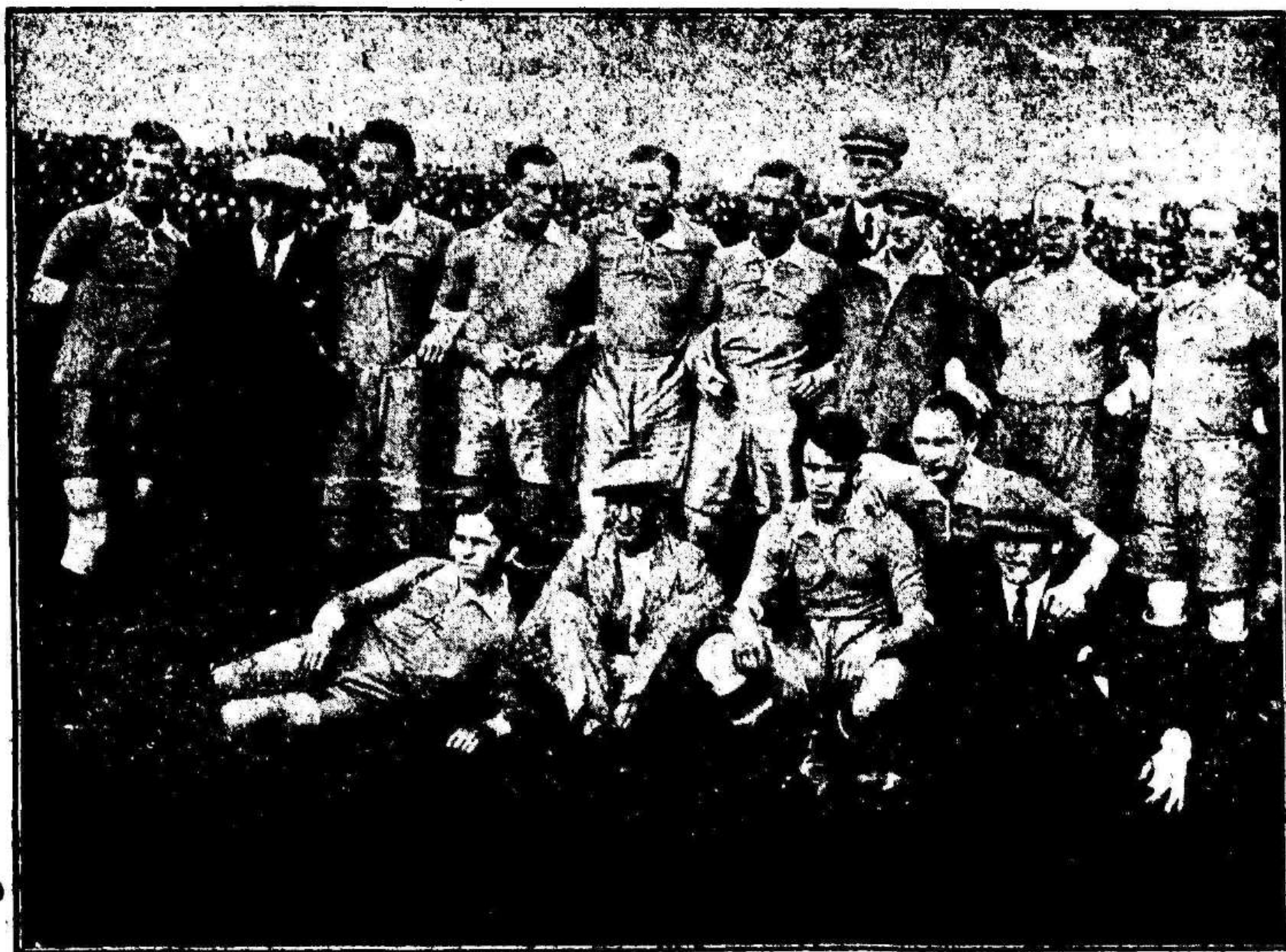
Equipo checoslovaco que ha jugado recientemente en la Argentina