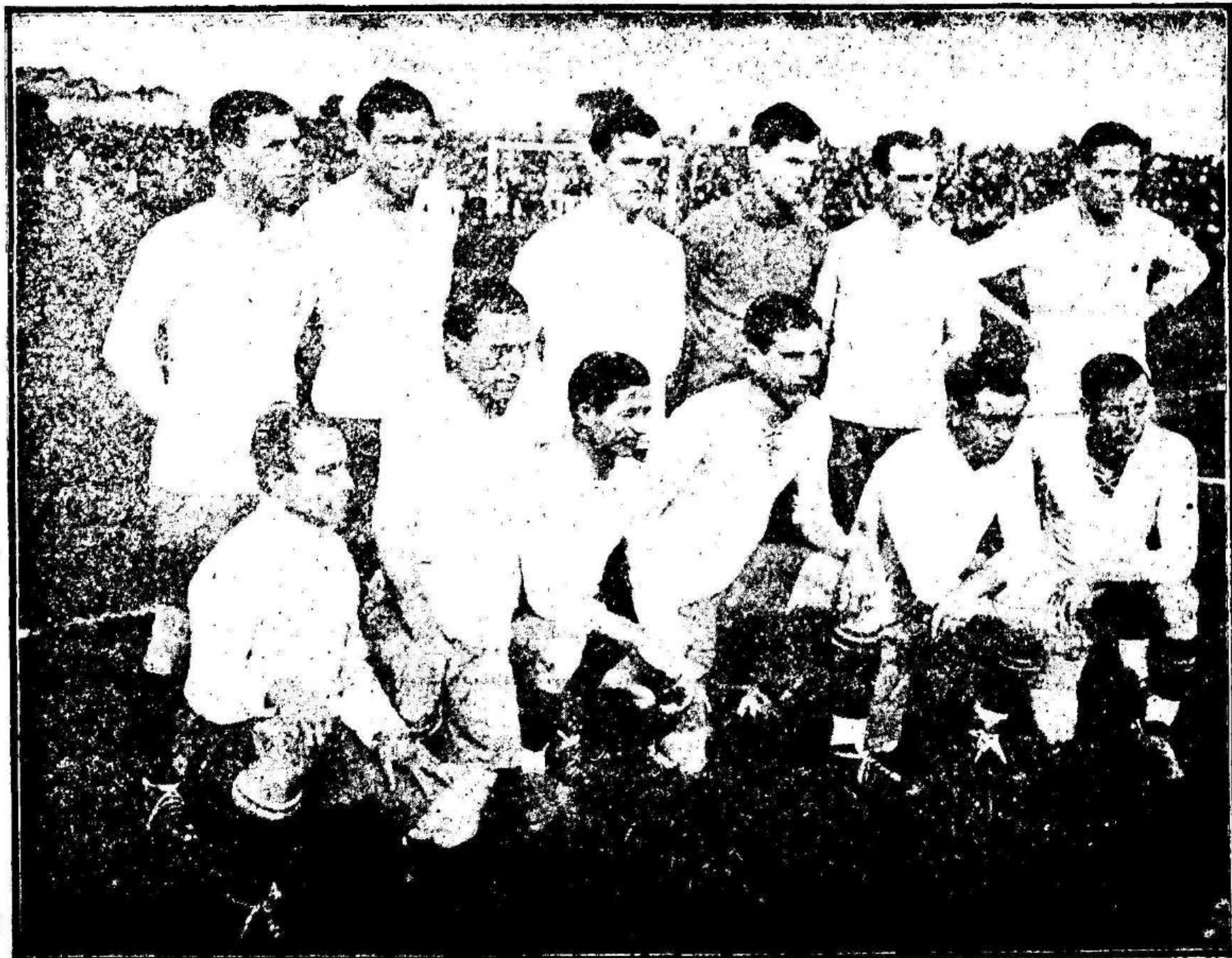
Equipo argentino que luchó recientemente con el team checoslovaco

A nuestro entender, en este viaje, el fútbol pasa siempre á los españoles; que fallamos siempre á improvisar. Este ha sido el aporte futbolístico en Sur América, por