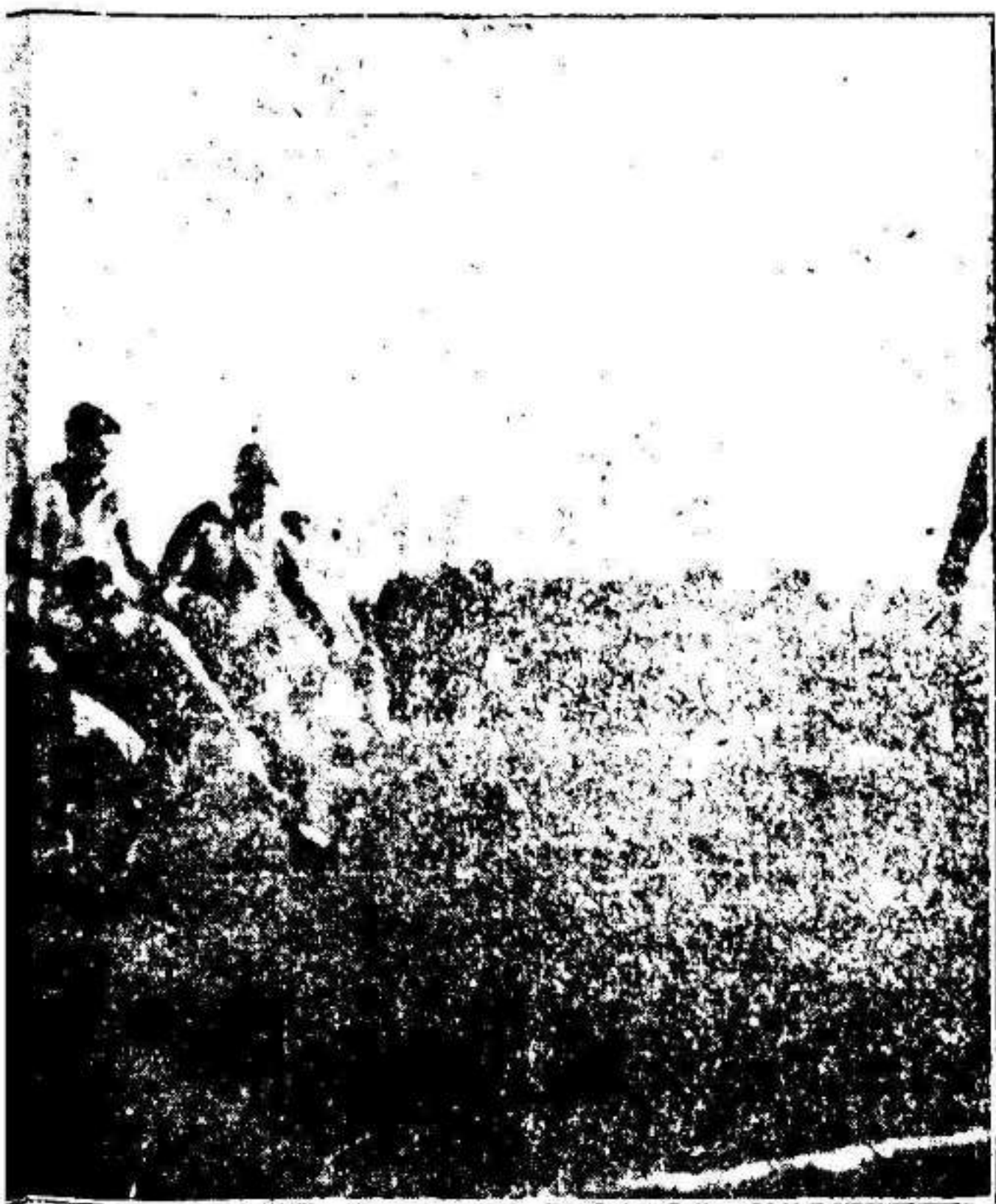
abrado entre argentinos y checoslovacos .

ad ha reflejado su pensamiento. No con- futbol que ha ido á aquellas Repúblicas. es individuales no han causado sensa-