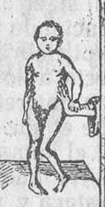
ENFERMEDAD DE LITTE