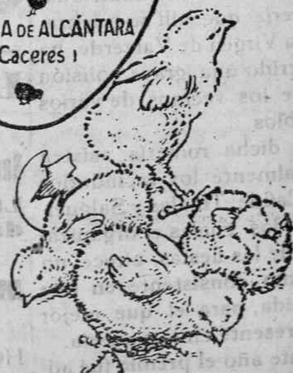
Polluelos recién nacidos