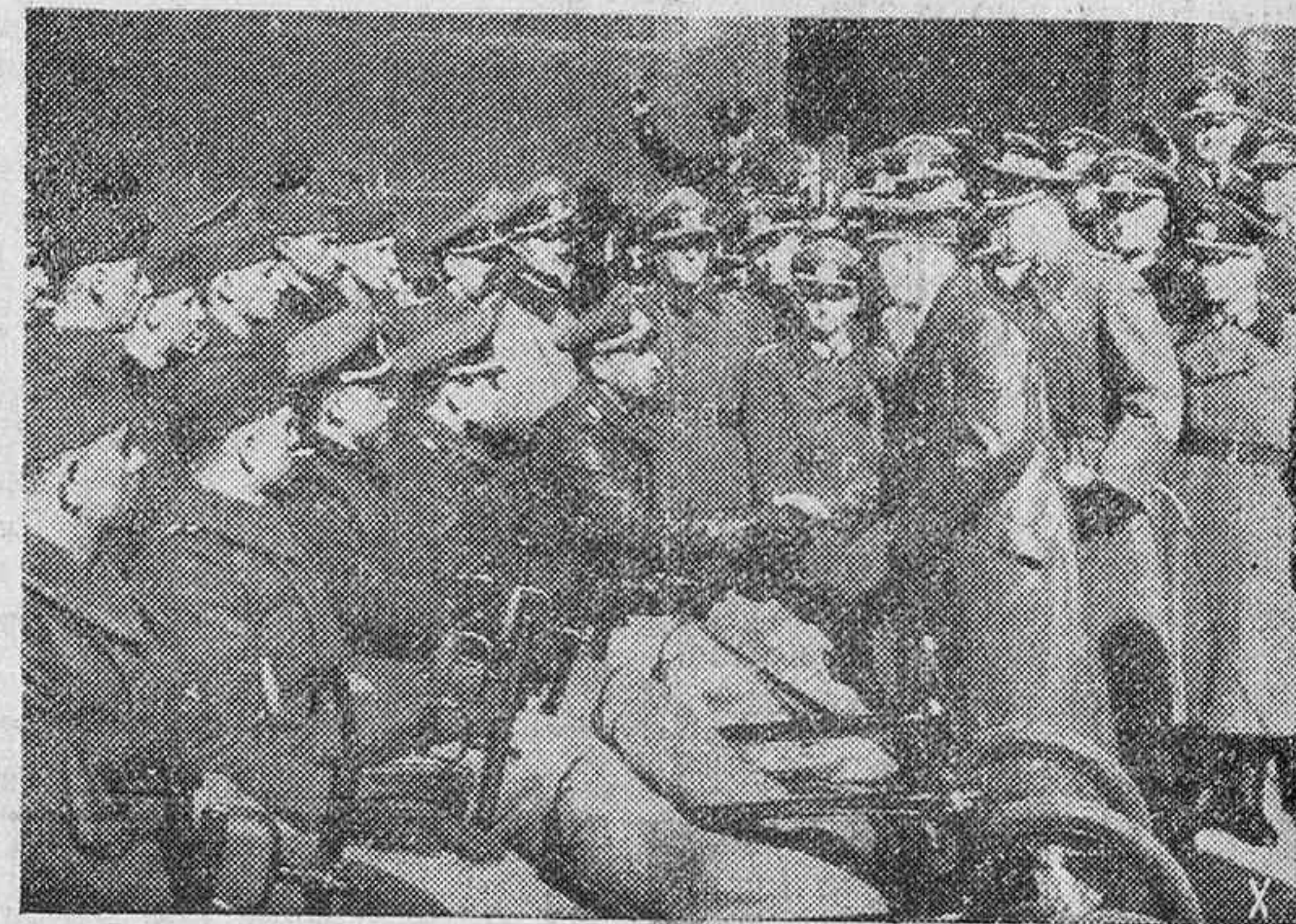
Durante su última visita a Berlín, el Führer saluda con palabras cordiales a los heridos de guerra.