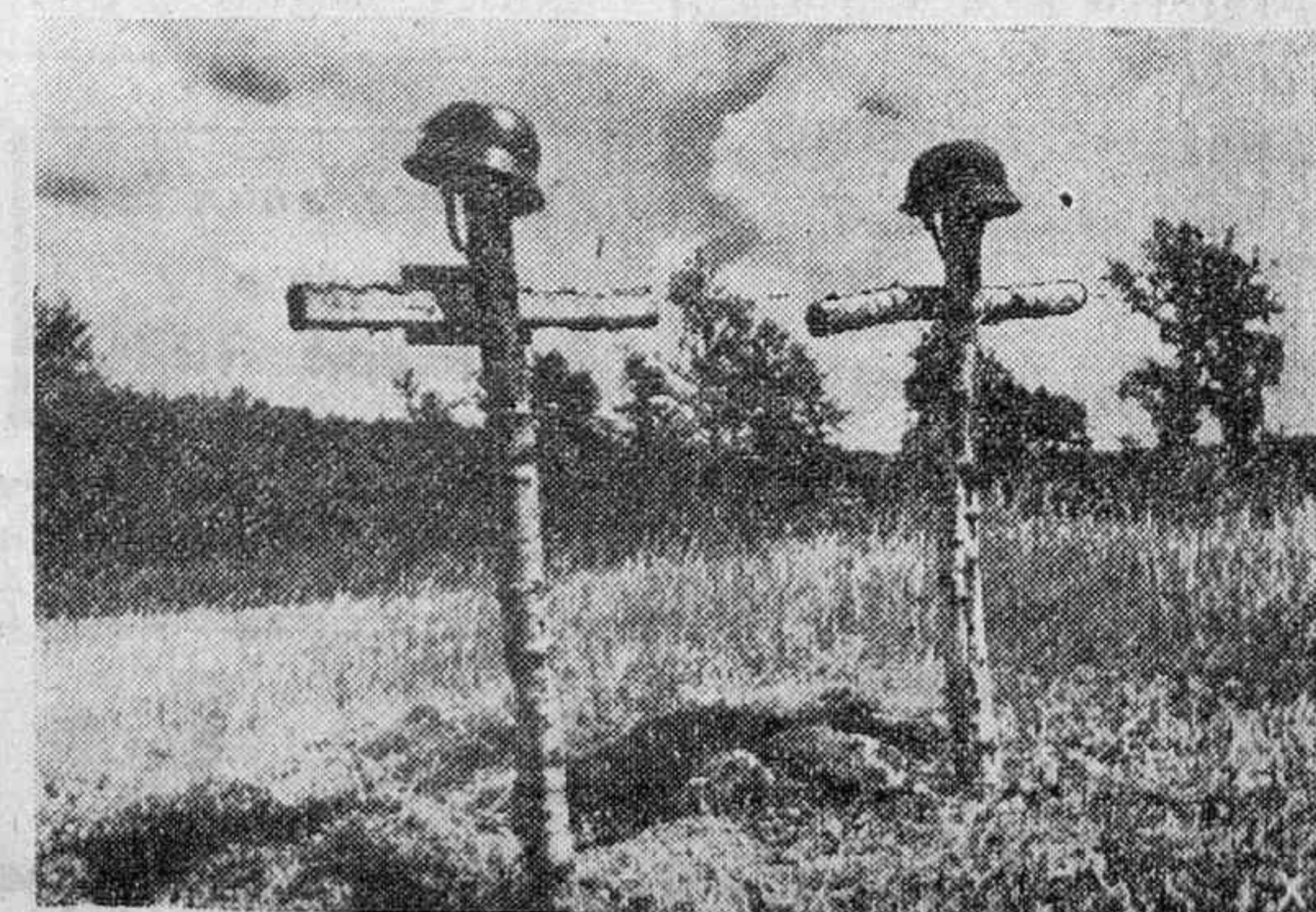
Tumbas de héroes en el Oeste.