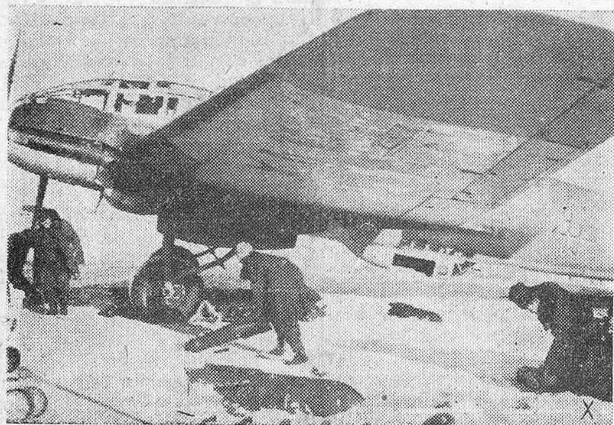
Nuevas bombas son cargadas para el ataque a la retaguardia soviética.