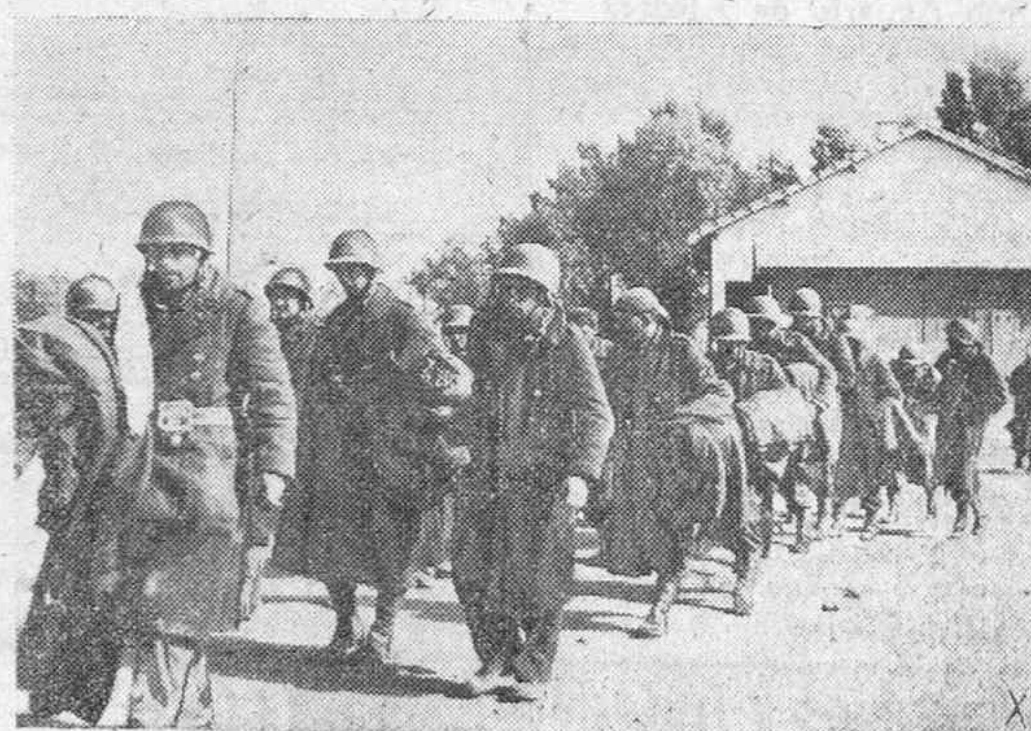
Fueron capturados durante las últimas victoriosas operaciones por tropas italianas en el frente de Túnez.