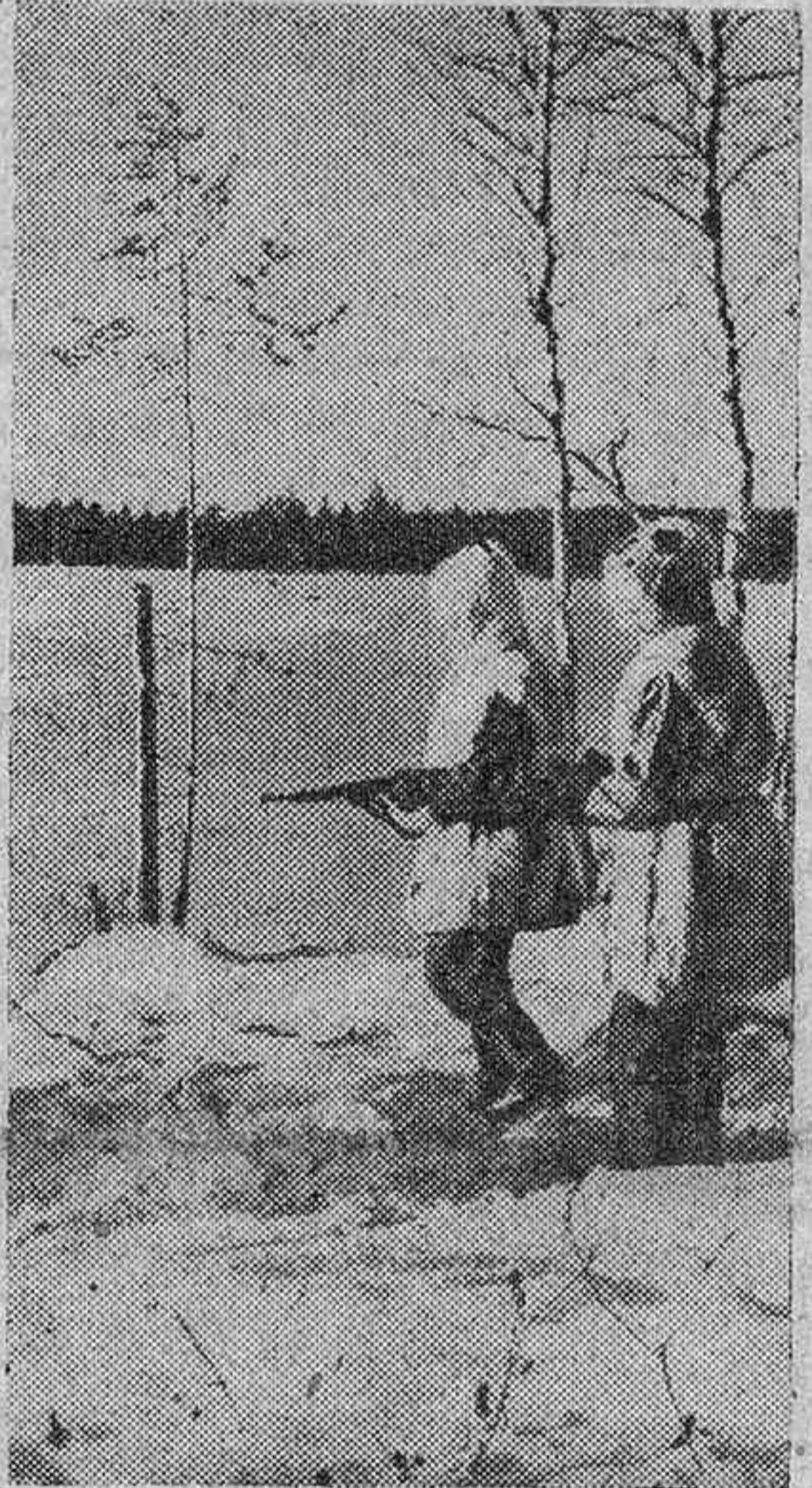
Soldados alemanes patrullando por los campos del Este

das. Los contraataques llevados a cabo con éxito por las fuerzas alemanas llevaron a conseguir alcanzar el Donetz en casi toda su línea.