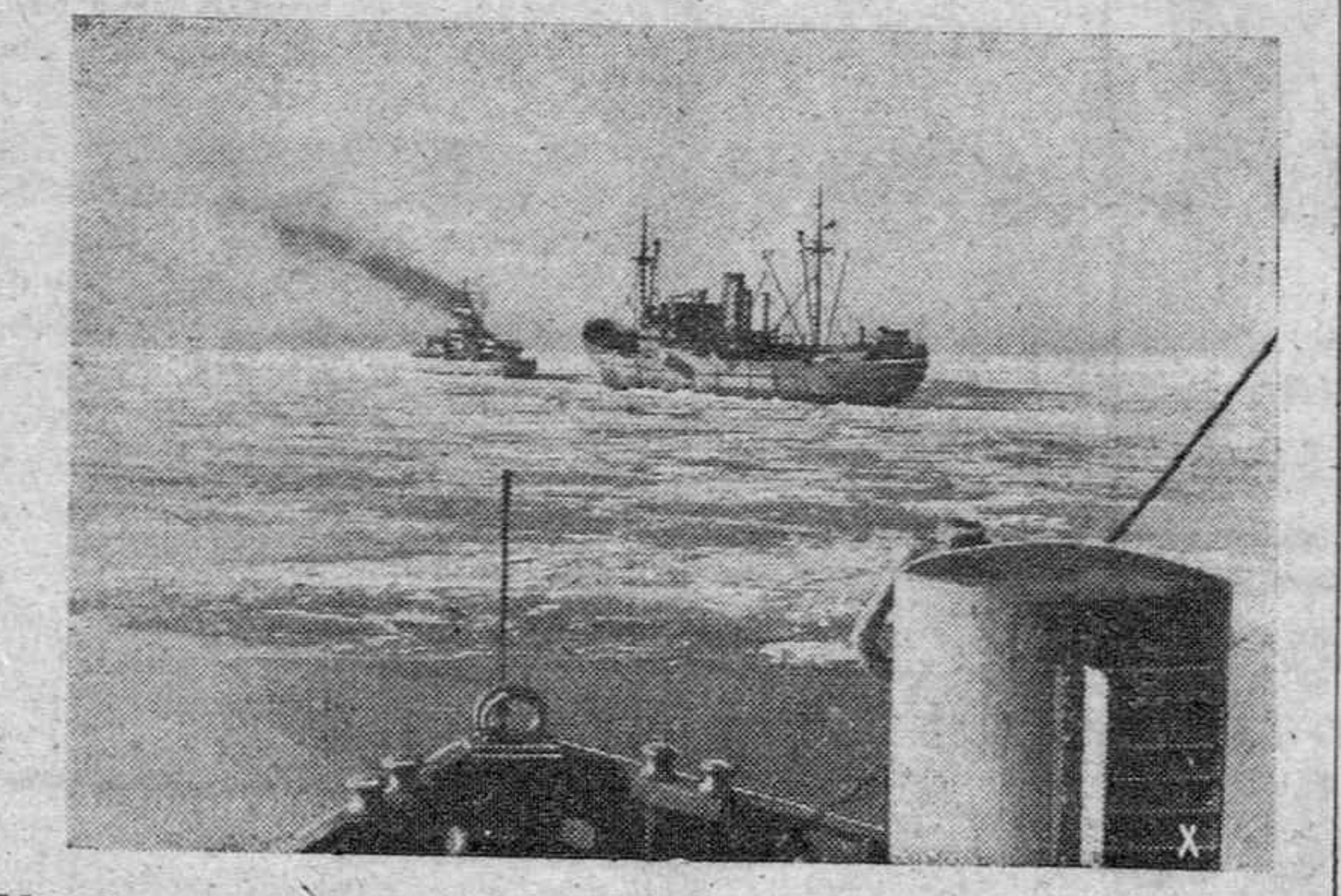
Muy duro es el servicio de los marineros alemanes durante el invierno y sólo hombres muy fuertes son capaces de resistirlo. La fotografía muestra un gran vapor alemán navegando por el mar casi helado.

RADIO ELECTRICIDAD LARREA TALLERES ELECTROMECANICOS San Antonio, 25 TELEFONO 1739