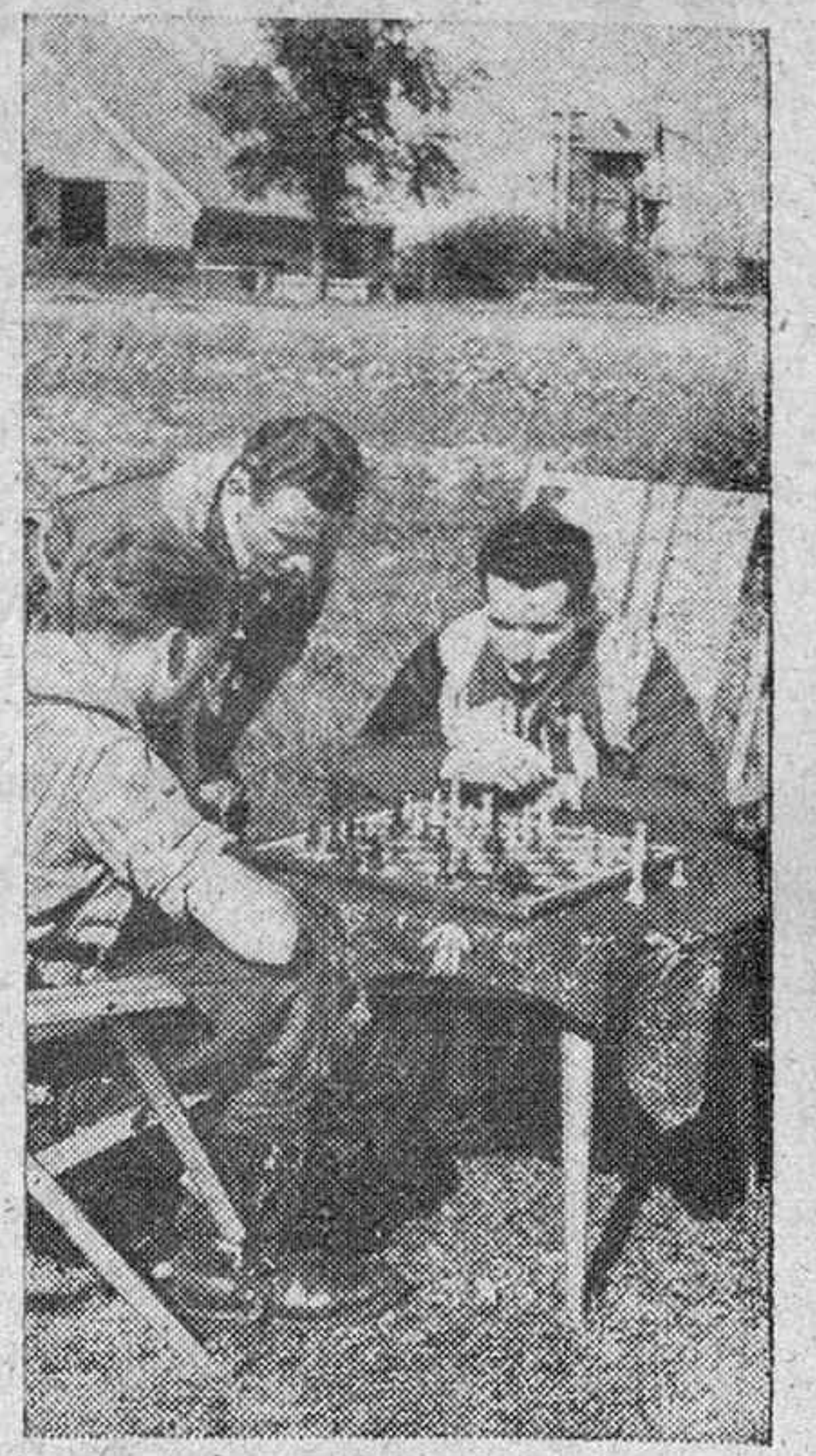
Una interesante partida durante los ratos de descanso.