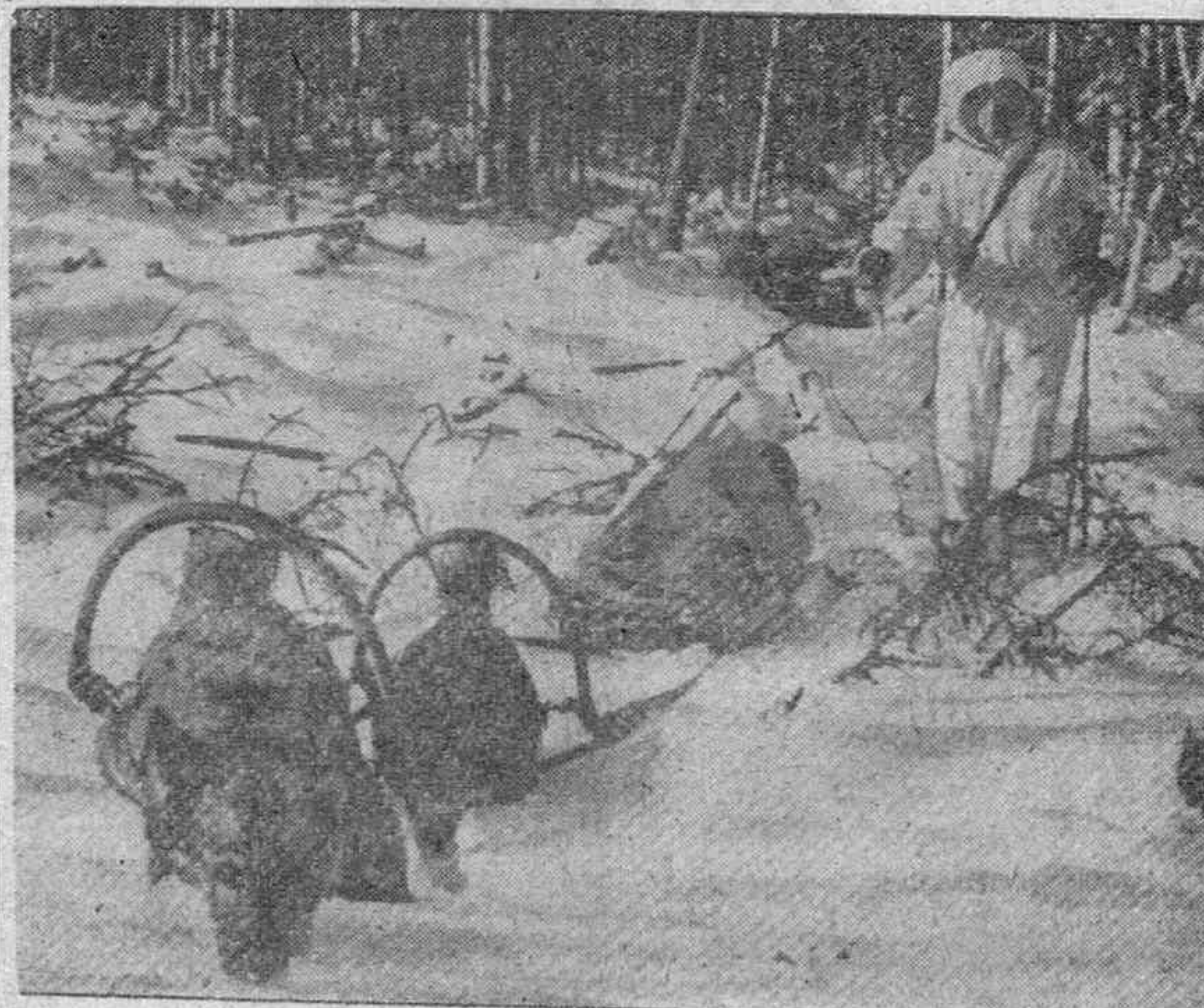
Los finlandeses emplean el tractor para el transporte de sus soldados heridos.