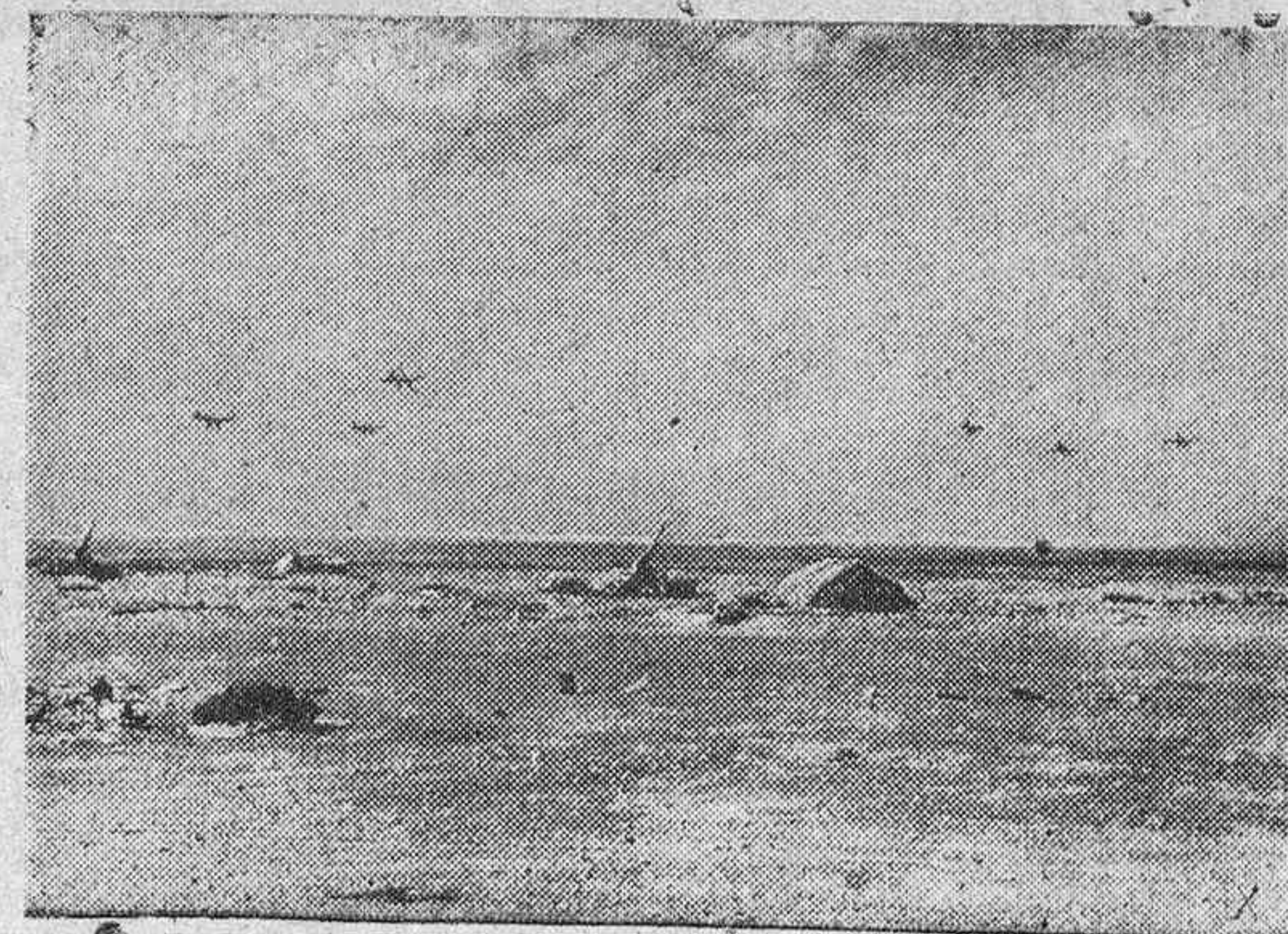
Aviones "Stukas" alemanes regresan de un vuelo por el espacio aéreo libio y egipcio.