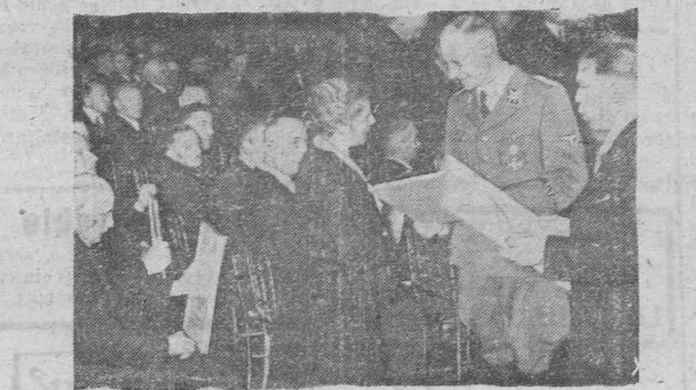
En presencia del Gauleiter Mutschmann fueron condecorados en la sala de fiesta del Castillo de Dresden 120 obreros alemanes por su gran rendimiento de trabajo en las industrias lecheras alemanas.

LECTORES: Haced vuestras compras y solicitud los servicios de los anunciantes de este periódico