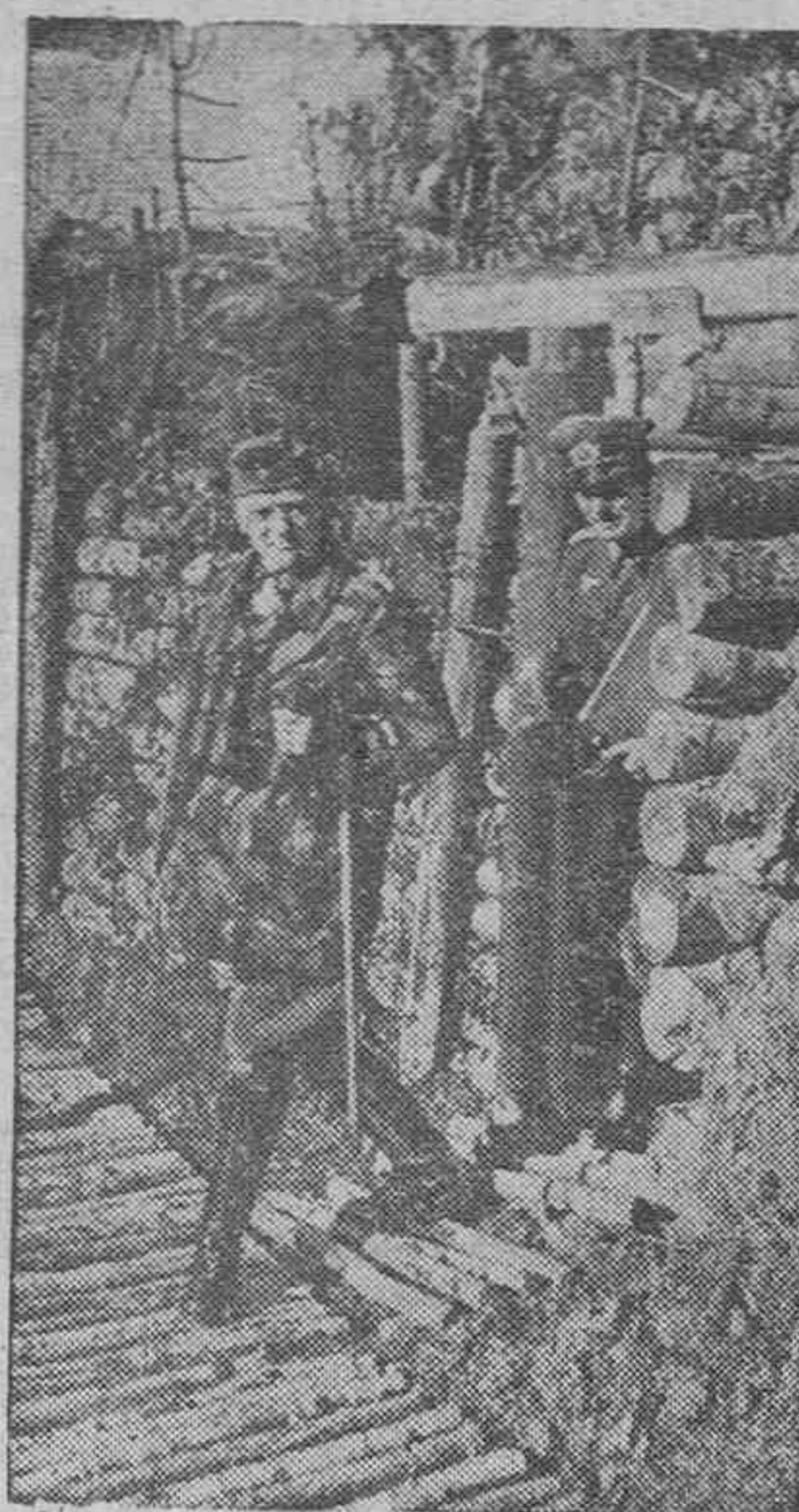
El general alemán Lindemann sale de conversar con el jefe de un puesto de mando en el frente del lago Ladoga