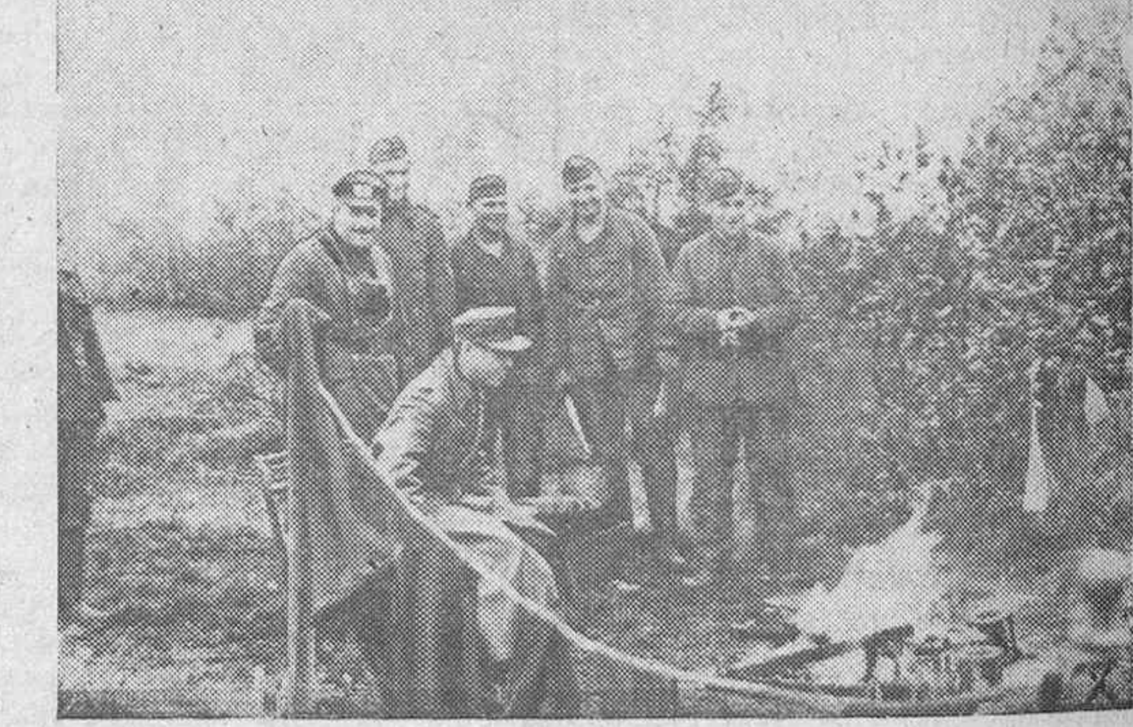
En el frente del Este ha descendido ya notablemente la temperatura y en muchos lugares los soldados alemanes se ven obligados a construirse fogatas como la que muestra nuestra fotografía