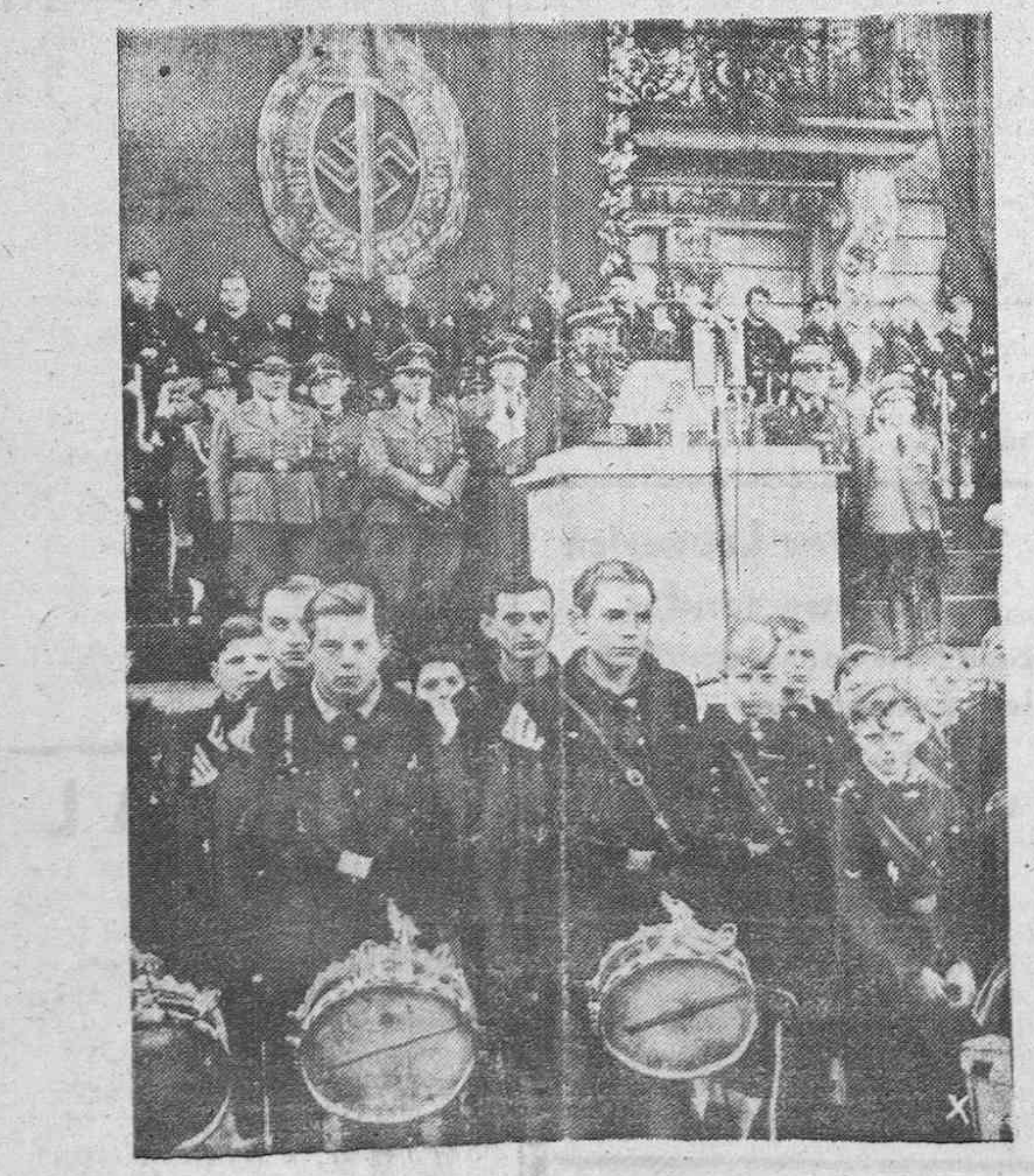
En Coburgo se han concentrado en memoria de la gran manifestación nacionalsocialista hace 21 años ante el Ayuntamiento de la ciudad las juventudes hitlerianas. El jefe de las tropas de asalto del Partido Schepmaun y el jefe del distrito Waechter pronunciaron discursos.