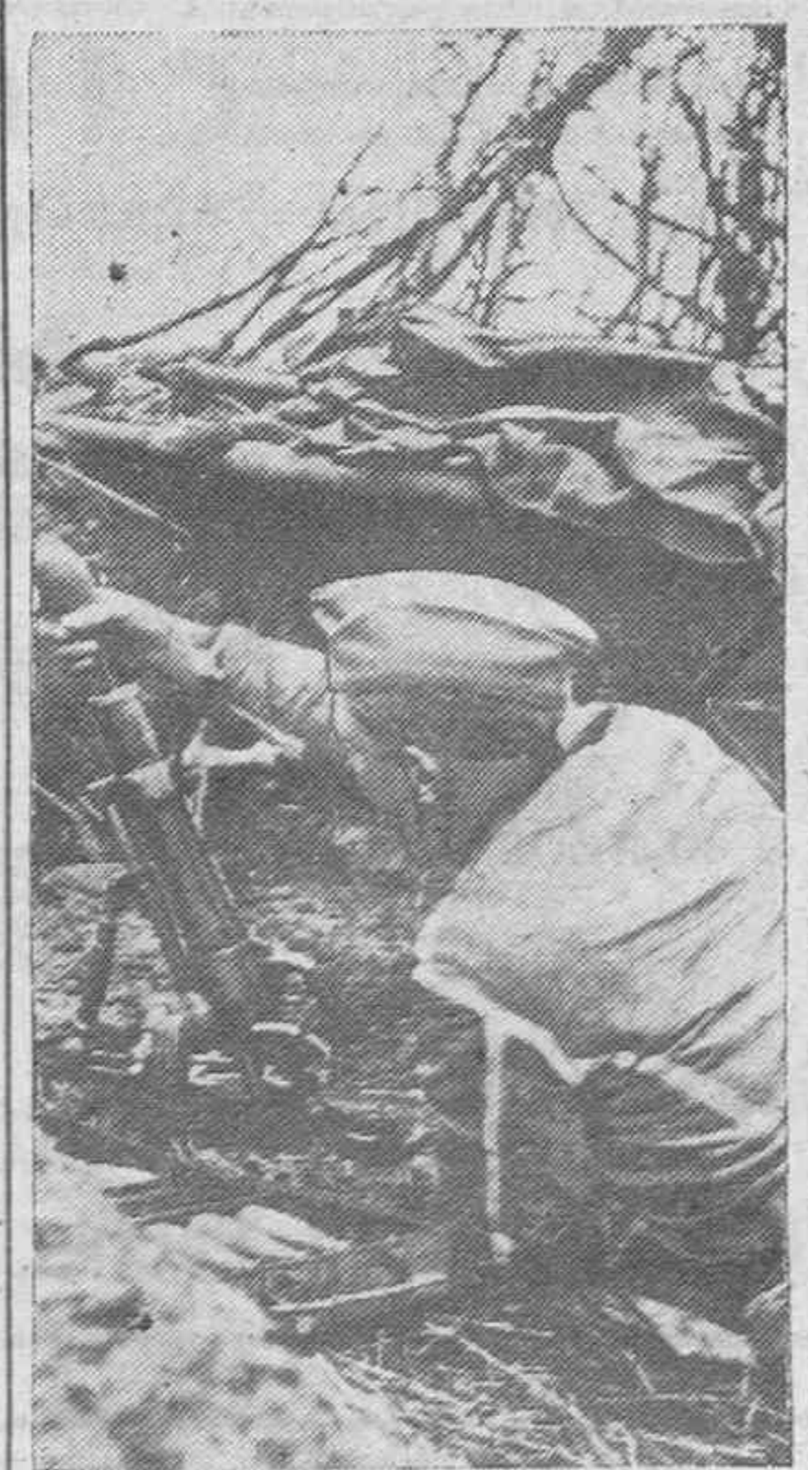
El jefe de un grupo de granaderos ha descubierto una posición bolchevique. Seguidamente se dirige con sus hombres a un punto desde donde el primer disparo sea certero.