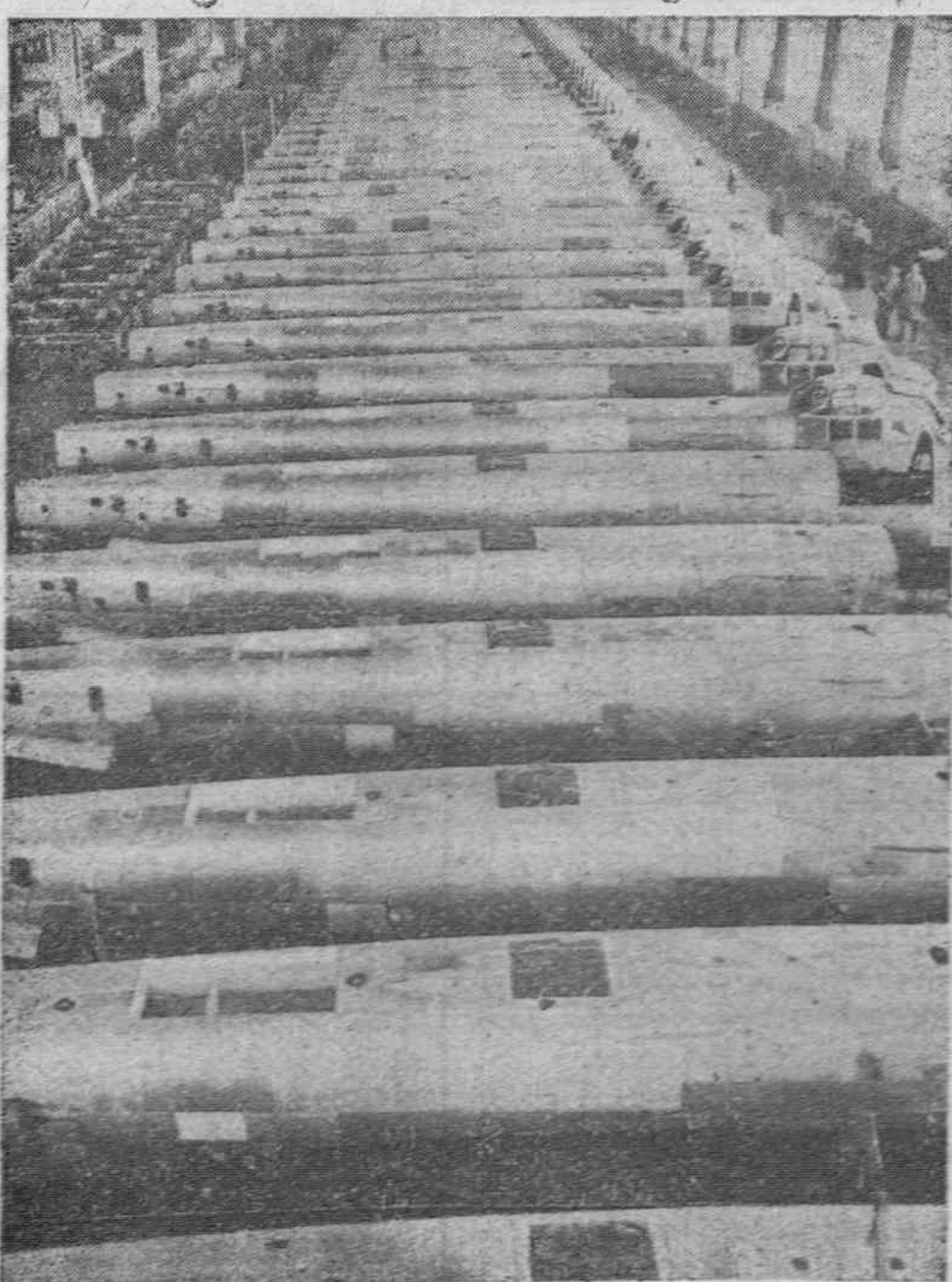
He aquí un gigantesco aspecto de una sala de montaje de aviones "Junkler 88".