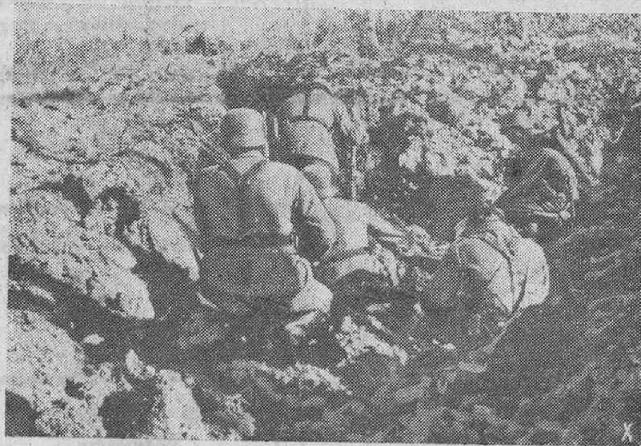
Infantería alemana y soldados de asalto, cubriéndose en un ataque en las proximidades de dicho lago.