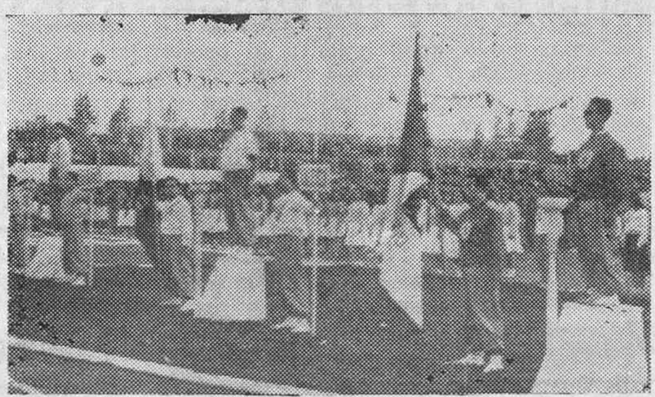
Momentos antes de empezar la última jornada de los segundos J. U. N. los equipos formaron en el Estadio ante el público inmenso que asistía y las Jerarquías nacionales.

A este acto asistirá el ministro de Polonia en España.—Cifra.