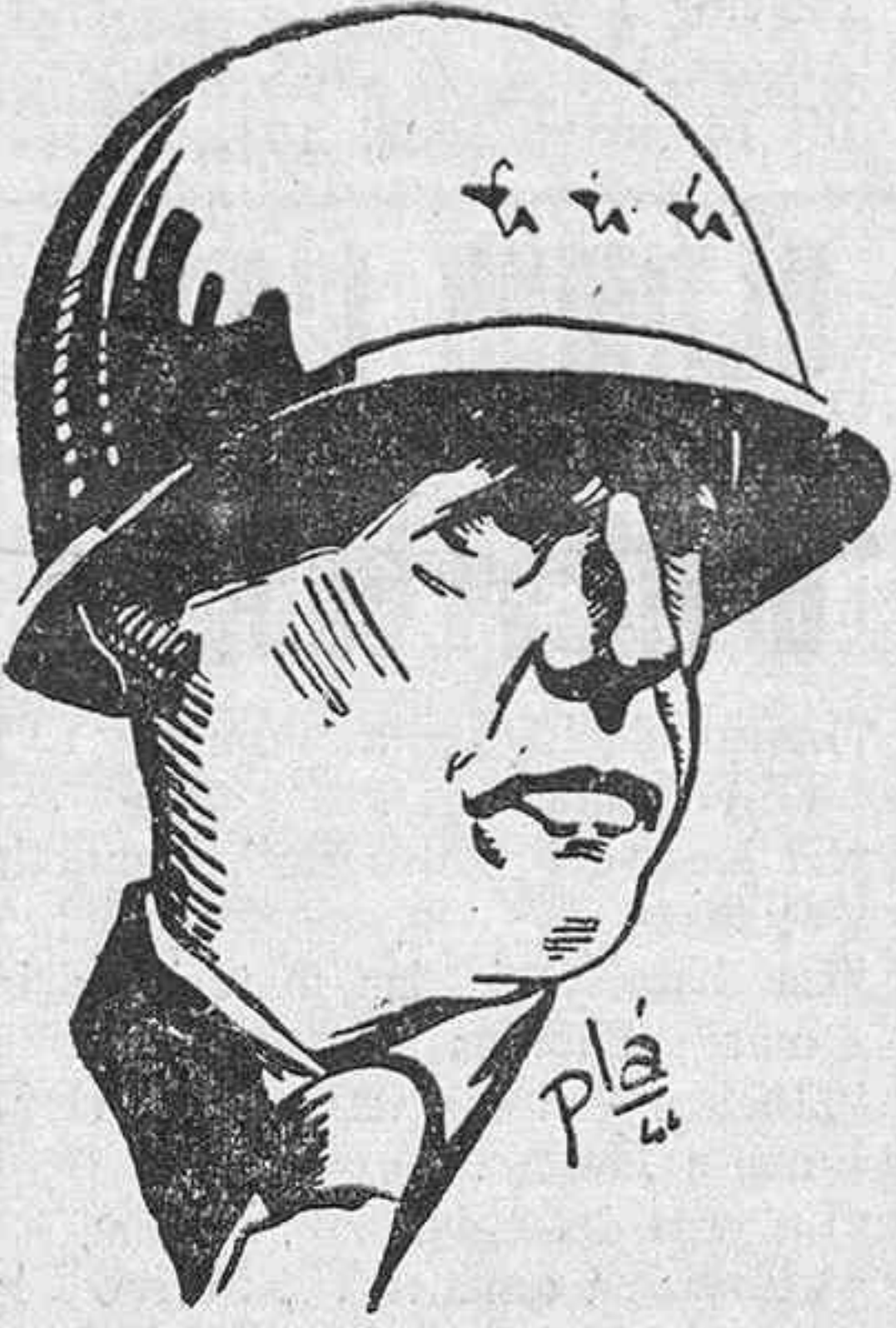
EL GENERAL PATTON

de Guebwiller, de 1.426 metros de altura, comunican en el Cuartel general del Cuerpo expedicionario aliado. —(Efe).