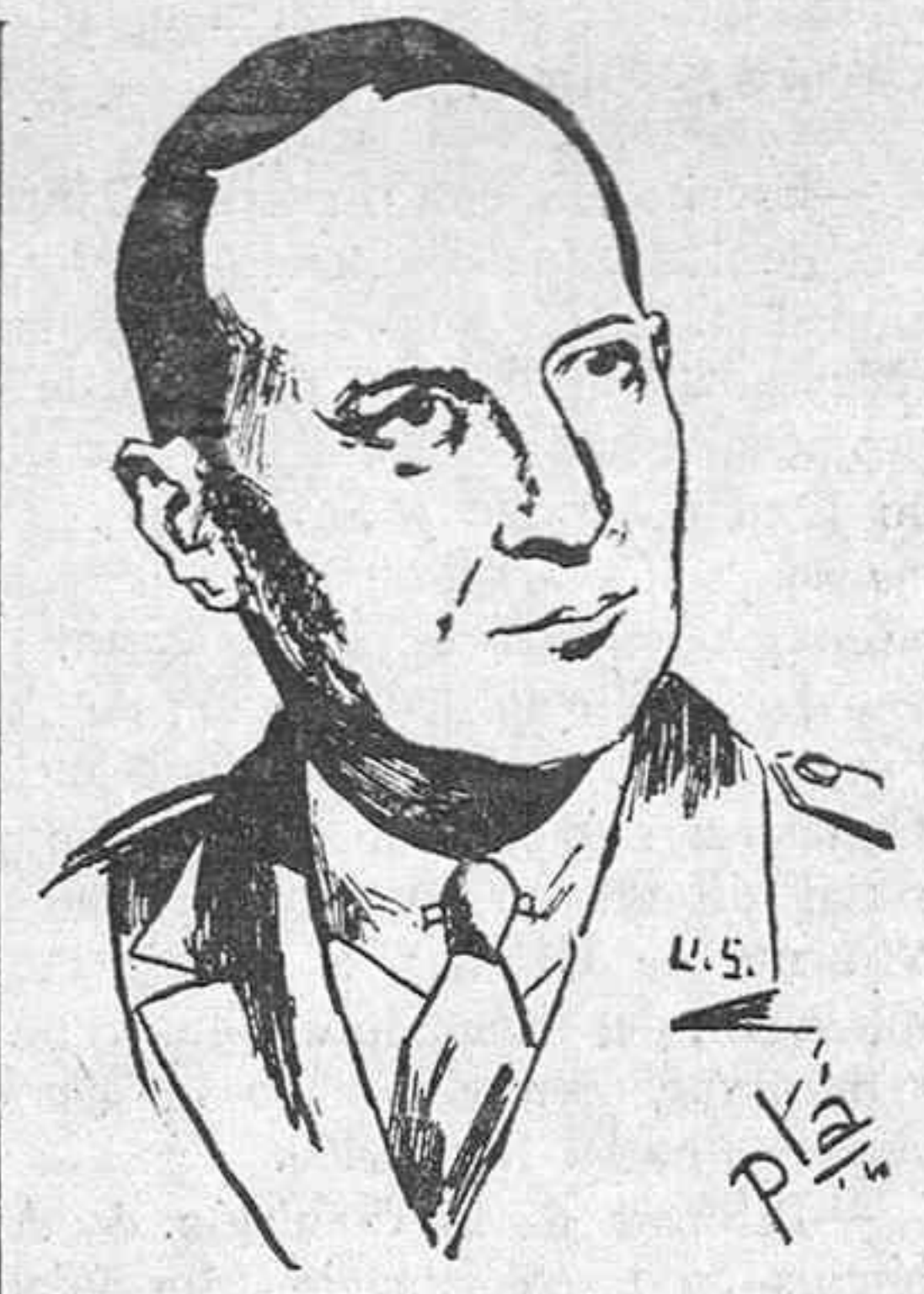
EL GENERAL MAC ARTHUR

Londres.—Esta mañana ha continuado sus sesiones el Congreso Mun-