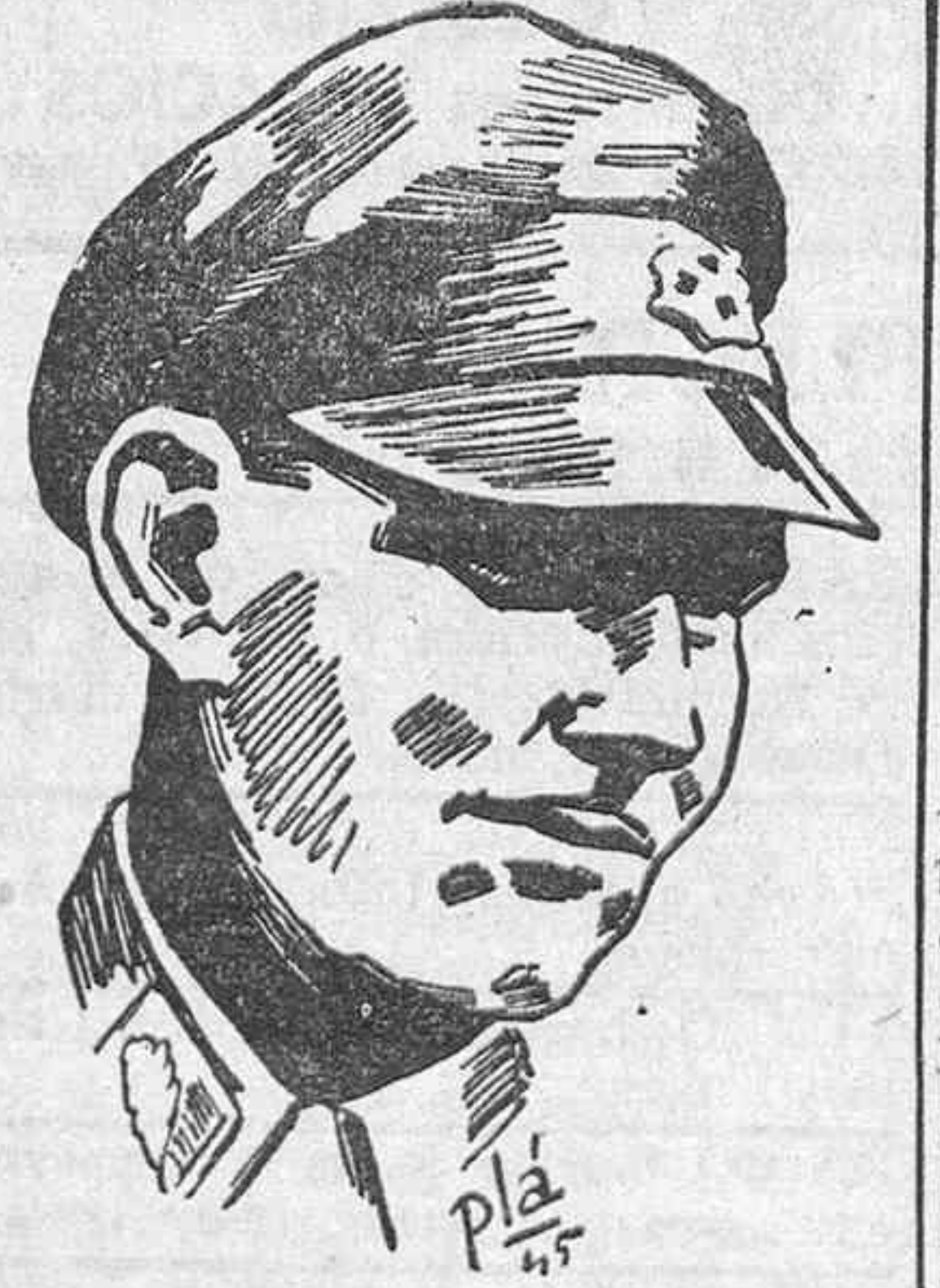
El General Helmuth Doerner que manda las tropas germano-húngaras en Budapest y que desde hace varias semanas resiste con heroísmo los asaltos de los ejércitos soviéticos. El General Doerner procede de las Juventudes Nacional-Socialistas y mantiene con indomable tesón la resistencia de la capital del Danubio.

París.—Por primera vez, el diario "Combat" expresa abiertamente su disgusto contra el Alto Mando aliado en relación con el corto número de trenes que, dice, se dedica al transporte de suministros a la población civil francesa. Con el título "Francia no pide limosna", el diario afirma que la escasez de transportes ferroviarios no es imputable ni al Gobierno ni a la Empresa de ferrocarriles franceses, que el mando aliado utiliza el 60 por ciento del material móvil francés y que debiera emplear el propio, ya que aquello se traduce en un gravísimo problema alimenticio y en el paro de gran número de industrias, esto por falta del carbón francés que utilizan los norteamericanos.—Efe.