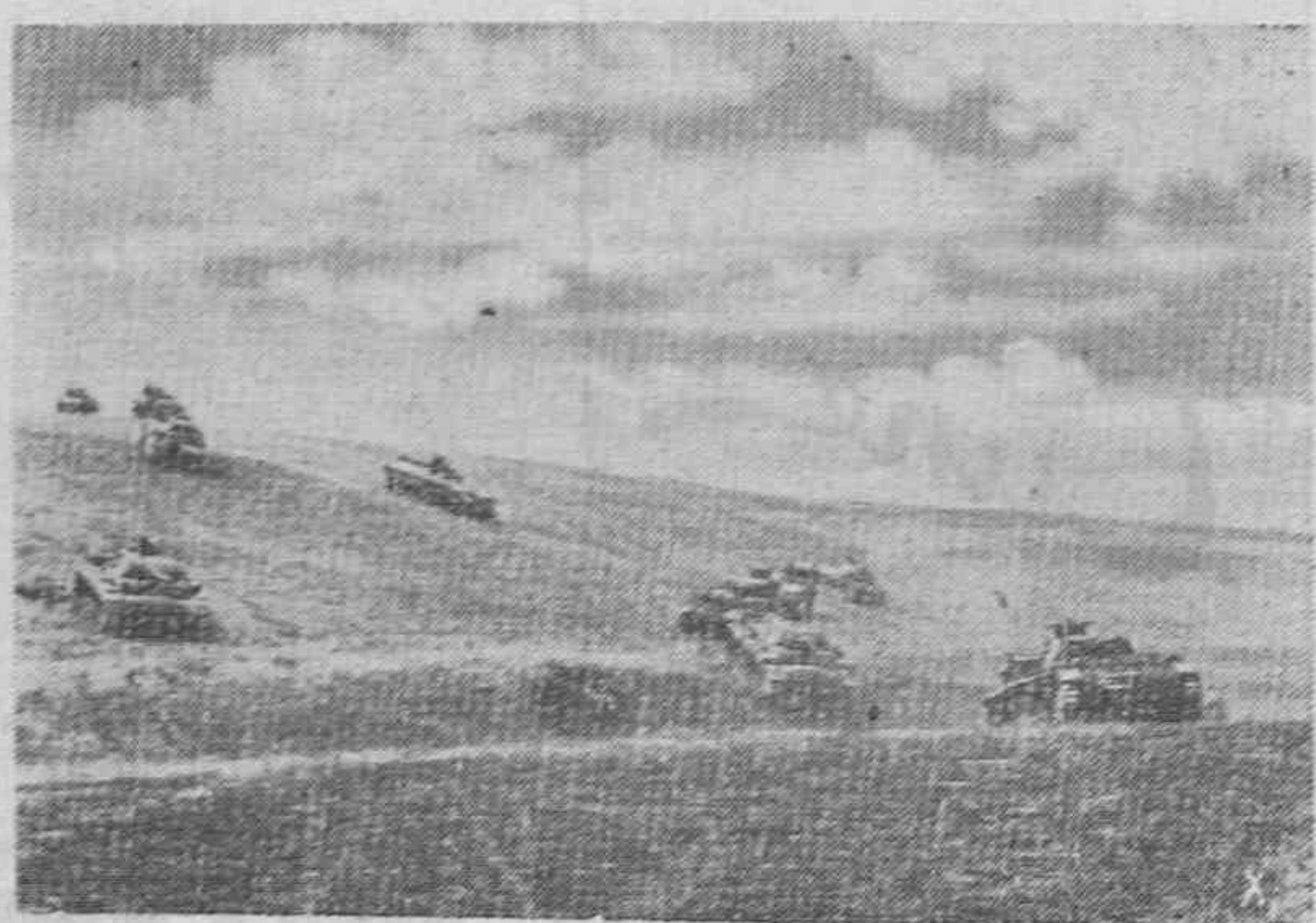
Desde los puntos de concentración detrás del frente avanzan los tanques germanos para atacar posiciones soviéticas de Stalingrado