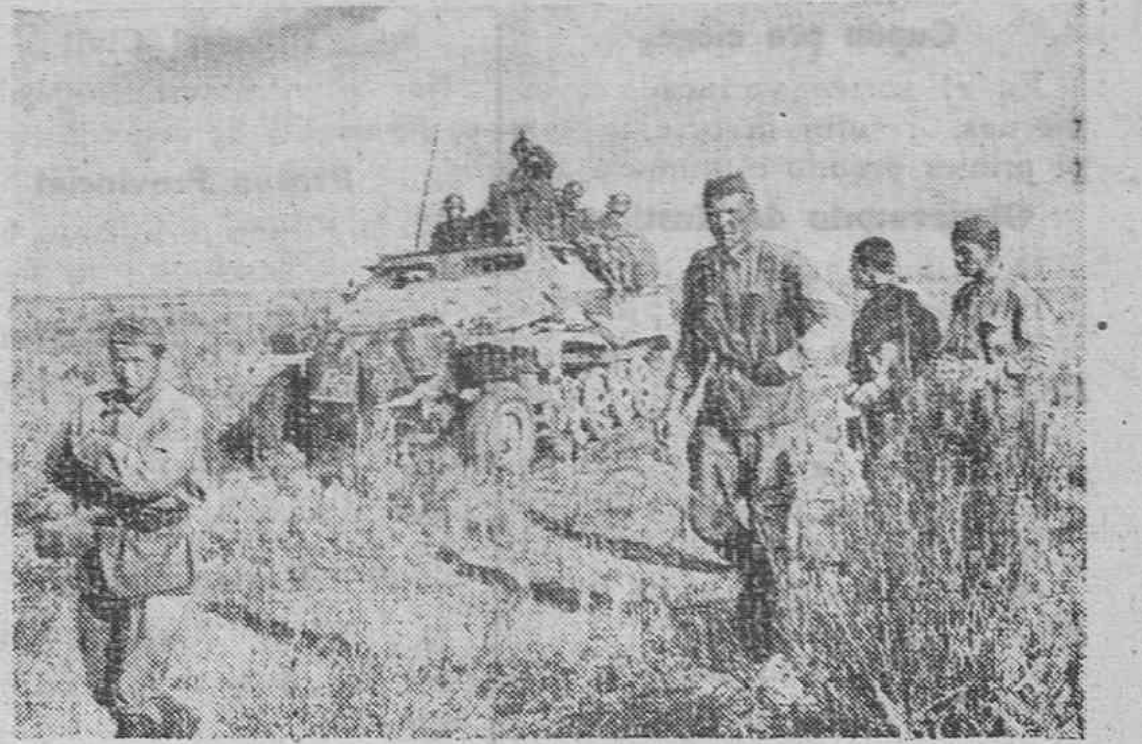
Soldados soviéticos capturados en los alrededores de Stalingrado—el infierno del Este—. Mientras los rusos siguen hacia la retaguardia el tanque alemán avanzará para atacar nuevas posiciones rusas