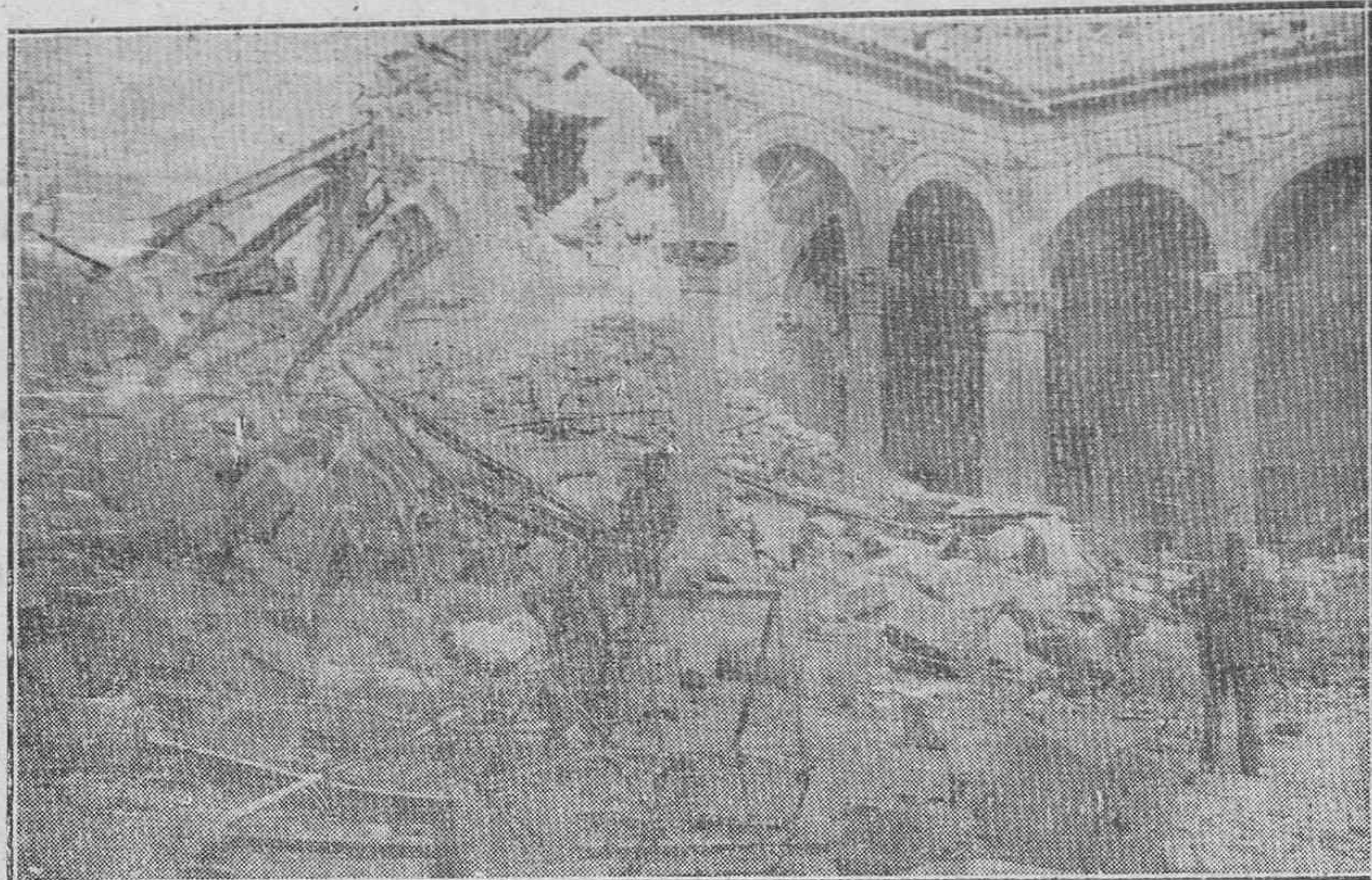
Así encontraron el glorioso Alcázar toledano las tropas del Ejército nacional a su entrada. Bajo estas ruinas gloriosas, un puñado de hombres, capitaneados por el general Moscardó, hicieron patente, ante el asombro del mundo, el espíritu indomable de nuestra raza

Sesenta y ocho días de diarios bombardeos atroces de la aviación y de la artillería de todos los calibres; 68 días sintiendo bajo las plantas, en las entrañas del coloso de piedra, el mordisqueo de las perforadoras que abren las minas. Y de vez en cuando el horretado estallido de es-